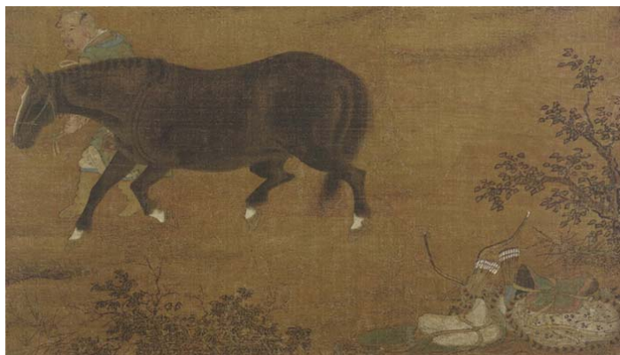
A Tartar Huntsman on his Horse, Ming Dynasty, Gift of Charles Lang Freer, F1911.266 (佛利爾美術館)

此圖描寫黑白相間大犬與三隻小犬，嬉戲於庭院奇石花叢之間，空白背景配以湖石棕櫚點綴，繪法生動，設色簡約高雅，應為明代宮廷畫師所作。畫家能把握住動物生態特徵，其作品略變宋代院體風格，別有生趣。