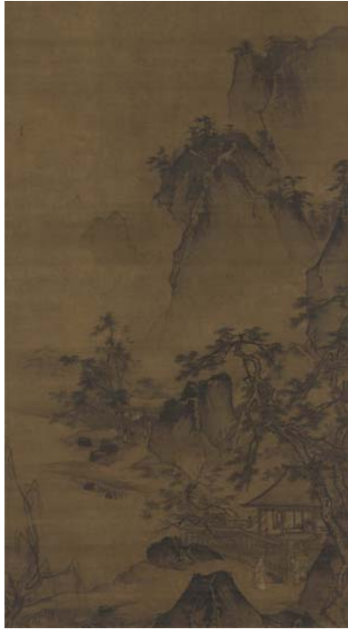
Lu Hong, Ming dynasty, Returning Home on a Moonlit Night, Gift of Charles Lang Freer, F1916.401 (佛利爾美術館)

表現山川宏偉氣象，用闊筆斧劈皴，老幹枯枝縱橫交錯，近景多大石壓角，淋漓毫放的筆勢，取法南宋山水傳統，而妙處多自發之。中景與前景同樣比例，遠山採取南宋馬夏渲染，山頭廓線明顯，內部皴紋墨色濃重。強烈對比的墨色暈染，是明代宮廷繪畫主要的特徵之一。此圖著重前景村居人物活動細節的描寫，樹木種類變化較少，點景人物活動多，有村舍人物來往拜訪。