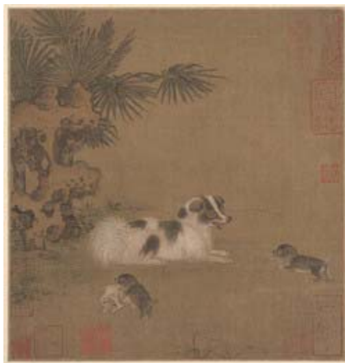
Unidentified Artist, Chinese ,Puppies Playing beside a Palm Tree and Garden Rock, 15th c., 1981.285.14 (大都會博物館)