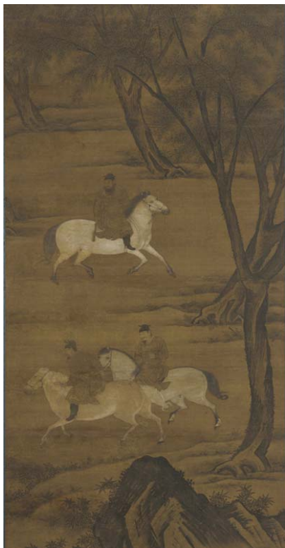
Attributed Zhao Mengfu , (Chinese, 1254-1322) ,Three Horsemen Riding under Willows,15th century, Gift of Charles Lang Freer F1909.163

北方游牧民族靠騎射馳騁草原，獲取衣食，此類「人物鞍馬」題材，內容較常見者，包括「獵騎」追逐獵物精彩瞬間、「按鷹」臂上架鷹的獵手、「番騎」游牧民族軍隊出行、「射雕」舉弓追逐畫面、「早行」帝王與眷屬送行、準備出行情景。宮廷畫師對鞍馬騎術的描寫，反映明代皇帝重視騎射的史實，