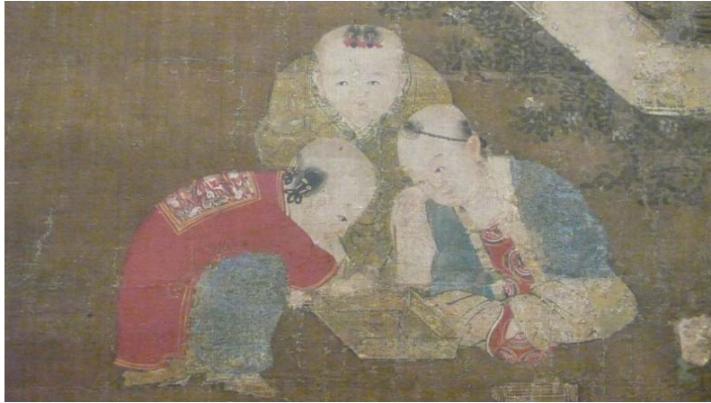
Unidentified Artist, Chinese ,Children Playing in the Palace Garden, Late 13th – 15th c, 1987.150 (大都會博物館)

「百子圖」此類作品表現宮廷生活內容，屬於風俗畫之類，可用來裝飾殿堂陳設。人物繪法源自南宋院畫家蘇漢臣、李嵩之嬰戲作品，但在畫風上面貌各不相同。畫中穿插孩子圍觀的情節，活潑有趣，反映當時人對物質生活的興趣，象徵著城市經濟商業的繁榮。嬰兒服飾鮮豔華麗，背景花卉湖石，帶有濃厚宮廷富麗裝飾色彩。