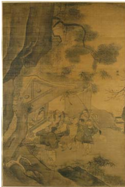
Zhang Lu, Studying a Painting, 16th c., 1990.6 (大都會博物館)

繪佛、道教傳說人物渡海，圖中繪有「八仙」之一李鐵拐，全真教五祖之一劉海。此圖繼承吳道子「吳帶當風」之描法，並受宋、元減筆寫意禪畫之影響。人物衣紋飄舉轉折，筆描能力純熟，姿態動作生動，用筆粗細變化多，海濤以戰筆勾描的特殊效果頗具裝飾性。明代宮廷畫家曾創作許多以「八仙」為題材的人物畫，此類人物畫法與元代浙江職業畫家顏輝畫道釋人物風格極為接近。