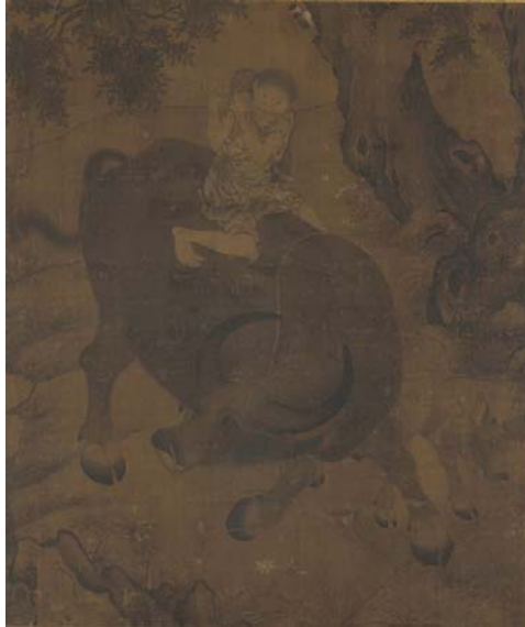
傳 Dai Song, Buffalo with Calf and Herdboy Playing a Flute, ca. 1500, Gift of Charles Lang Freer, F1916.77 (佛利爾美術館)

「百子圖」此類作品表現宮廷生活內容，屬於風俗畫之類，可用來裝飾殿堂陳設。人物繪法源自南宋院畫家蘇漢臣、李嵩之嬰戲作品，但在畫風上面貌各不相同。畫中穿插孩子圍觀的情節，活潑有趣，反映當時人對物質生活的興趣，象徵著城市經濟商業的繁榮。嬰兒服飾鮮豔華麗，背景花卉湖石，帶有濃厚宮廷富麗裝飾色彩。