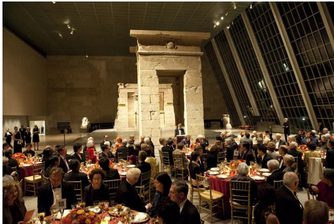
忽必烈的世界 (The World of Khubilai Khan, Chinese Art in the Yuan Dynasty) 2010 年 9 月 20 日開幕晚宴。