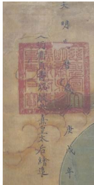
Five Luohan with Attendants Crossing the Ocean, ca. 1610, Empress Dowager Cisheng (1546-1614), Ming dynasty, Gift of Charles Lang Freer, F1911.275 (佛利爾美術館)

明代晚期宮廷畫家所作。圖右上方有金粉題字「大明萬曆歲次庚戌年(三十八年1610)，大明肅貞壽端獻恭熹皇太后繪造。」并鈐有皇太后寶印，應是為皇太后祝壽所作。