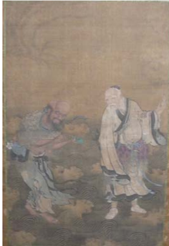
Anonymous, Two Daoist Immortals Standing on the Sea, 17.426 (佛利爾美術館)

繪佛、道教傳說人物渡海，圖中繪有「八仙」之一李鐵拐，全真教五祖之一劉海。此圖繼承吳道子「吳帶當風」之描法，並受宋、元減筆寫意禪畫之影響。人物衣紋飄舉轉折，筆描能力純熟，姿態動作生動，用筆粗細變化多，海濤以戰筆勾描的特殊效果頗具裝飾性。明代宮廷畫家曾創作許多以「八仙」為題材的人物畫，此類人物畫法與元代浙江職業畫家顏輝畫道釋人物風格極為接近。