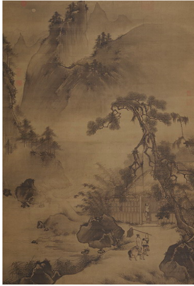
Wang Shichang, Mountain Studio Under Pines, ca. 1525, Gift of Charles Lang Freer, F1916.95 (佛利爾美術館) 明王世昌〈松陰書屋圖〉

王世昌（1462-1531 以後），字時雍，號歷山，山東歷城（今濟南）人。工山水人物。成化時，與吳偉同時被徵，供職畫院，官武英殿直錦衣鎮撫。