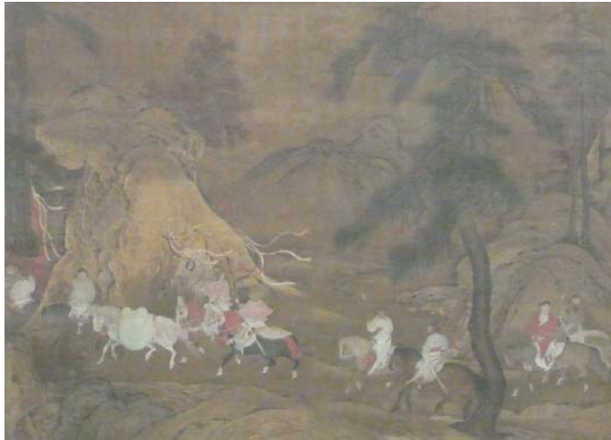
Unidentified Artist, Chinese , Emperor Minghuang' s Flight to Shu, Rogers Fund, 1941,41,138 (大都會博物館)

皇室出遊行樂為主題的繪畫，頌揚天下太平、國富民安之盛世。此畫原訂為唐明皇幸蜀圖，但據畫中人物面貌與服飾風格，可歸於宣德朝宮廷繪畫。此圖繪有王公貴族並騎駿馬，行進於郊外繽紛松林。畫中人物身著華麗衣冠服飾，座騎鞍具上披虎與豹皮、馬轡、絡頭、紅纓，突顯其尊貴之身份地位。