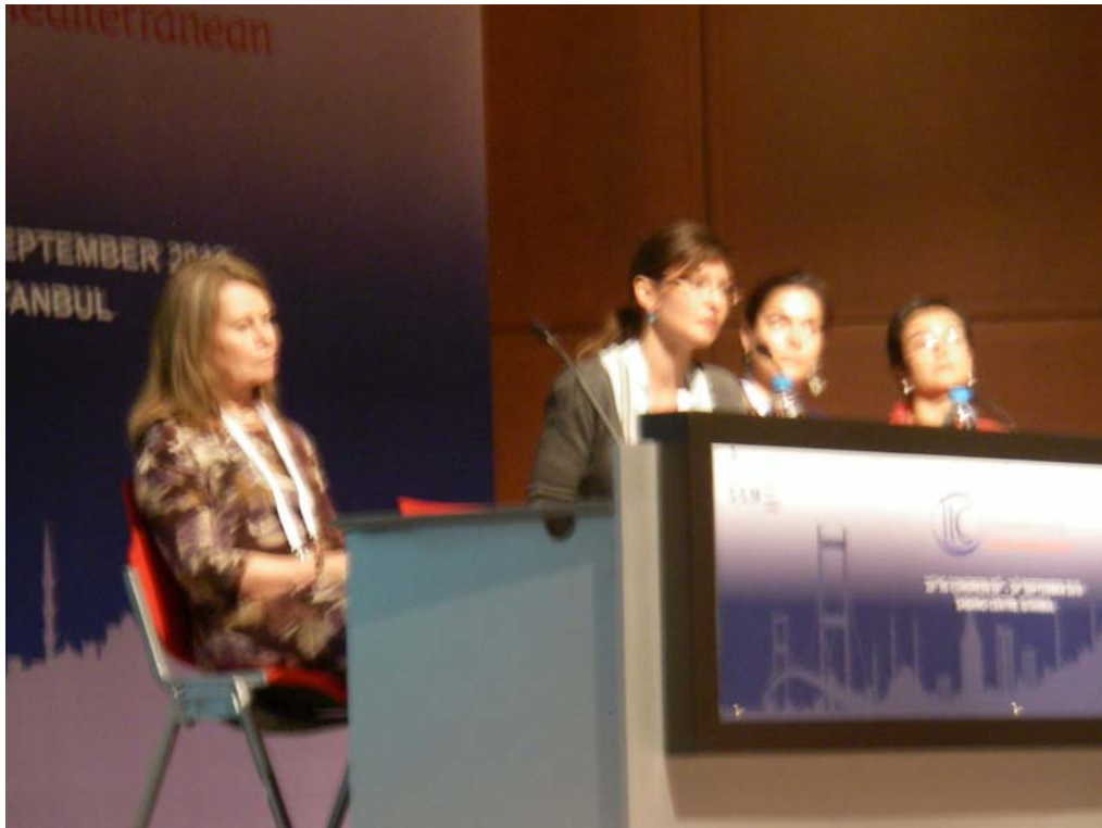
發表論文者與講台下的參加會議者進行雙向討論