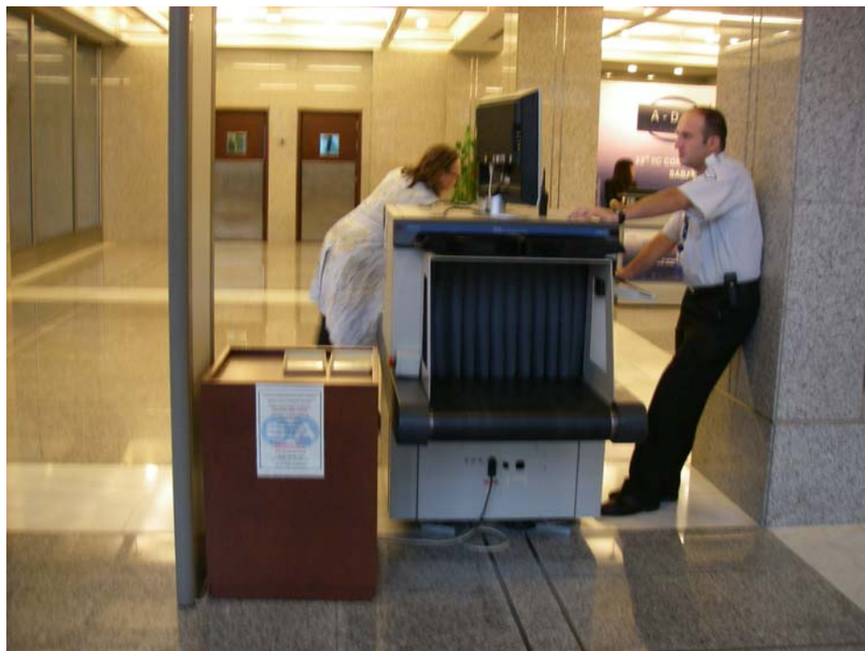
進入會場前須先經過安全檢查