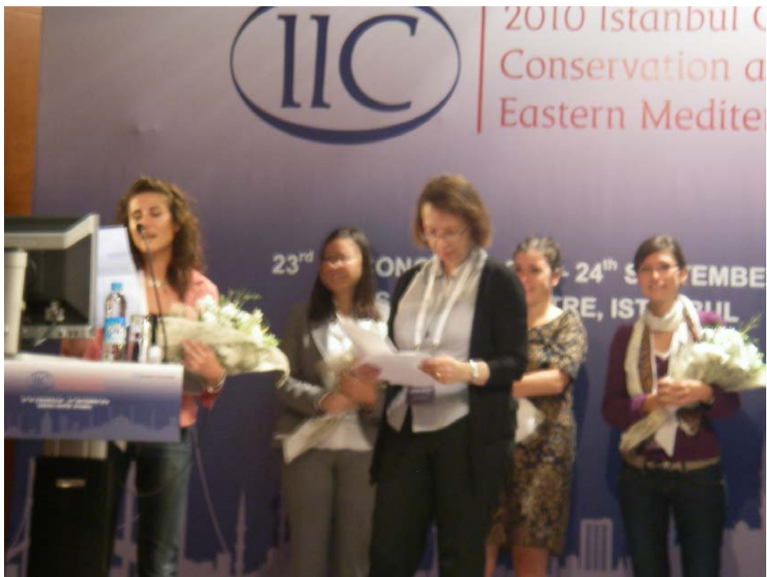
IIC 於閉幕式中向協辦單位一一致謝