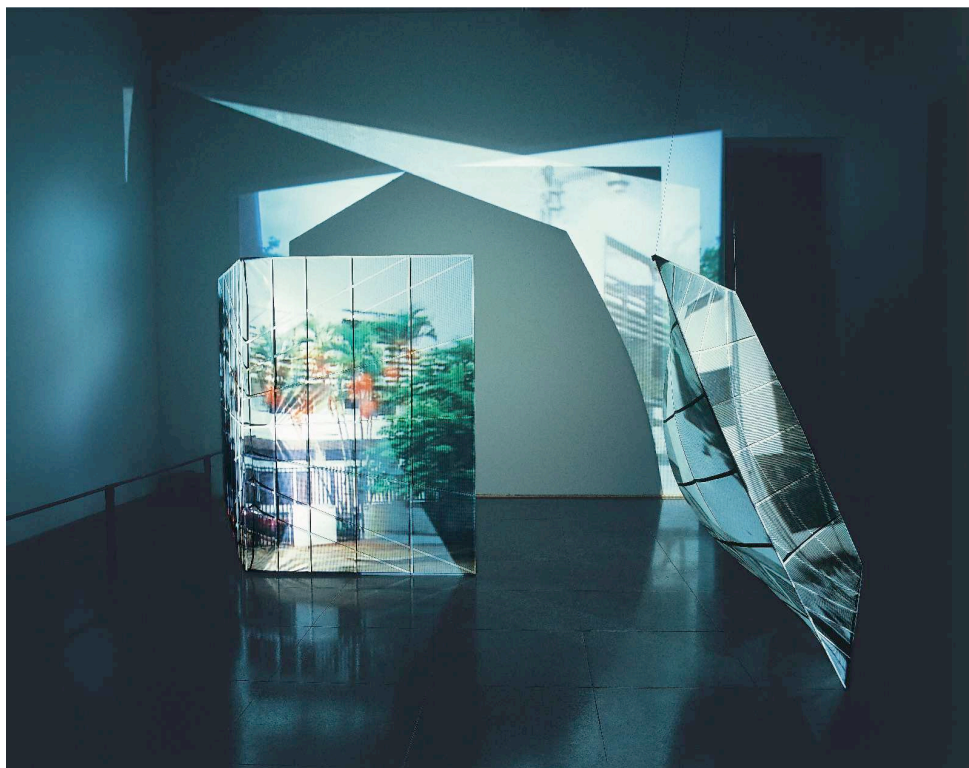
© Ângela Ferreira, Casa Maputo , 1999.