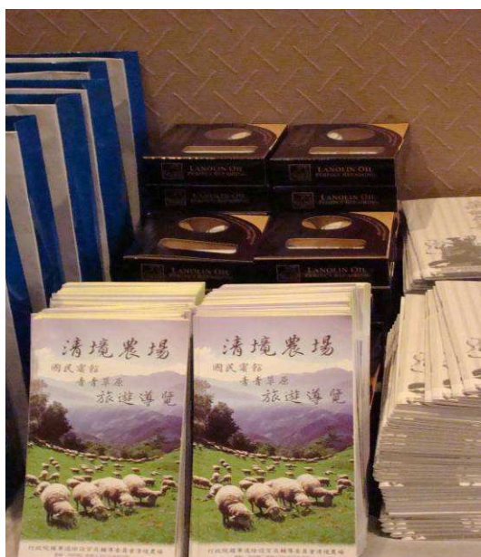
圖 1、香港旅展新聞發佈會清境農場攜帶宣傳物品，DM 及農場專賣之綿羊油產品展示。