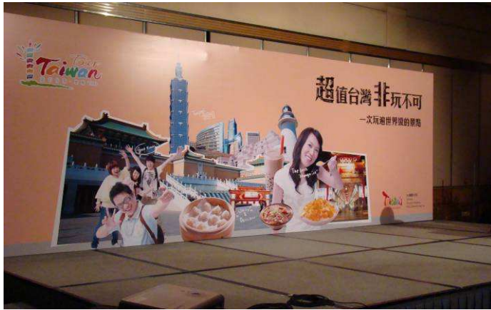
圖 3、新聞發佈會講台佈置