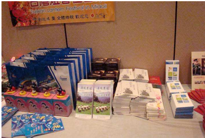
圖 4、新聞發佈會會場文宣佈置