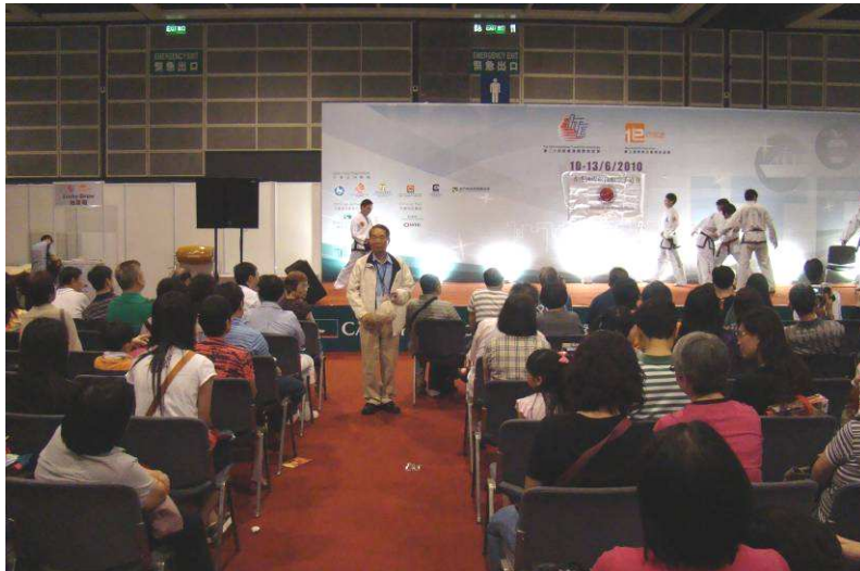
圖 9、展覽會場表演台