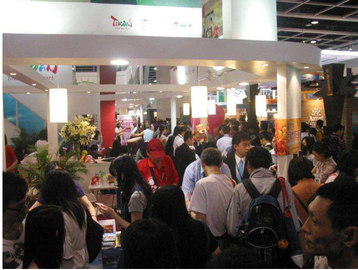
圖 11、展覽會場台灣館盛況