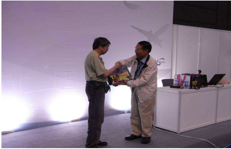
圖 8、展覽會場林處長 （右）做八大農 場文宣簡報有獎 徵答