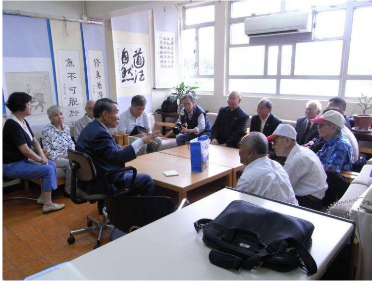
圖 14、林處長與香港榮光聯誼會前輩座談