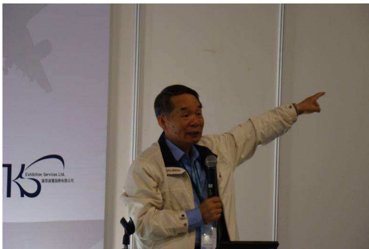
圖 7、展覽會場林處長向與會人員做八大農場文宣簡報