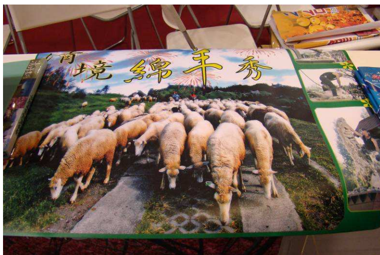
圖 2、清境農場於香港旅展新聞發佈會展示印有清境農場綿羊秀海報。