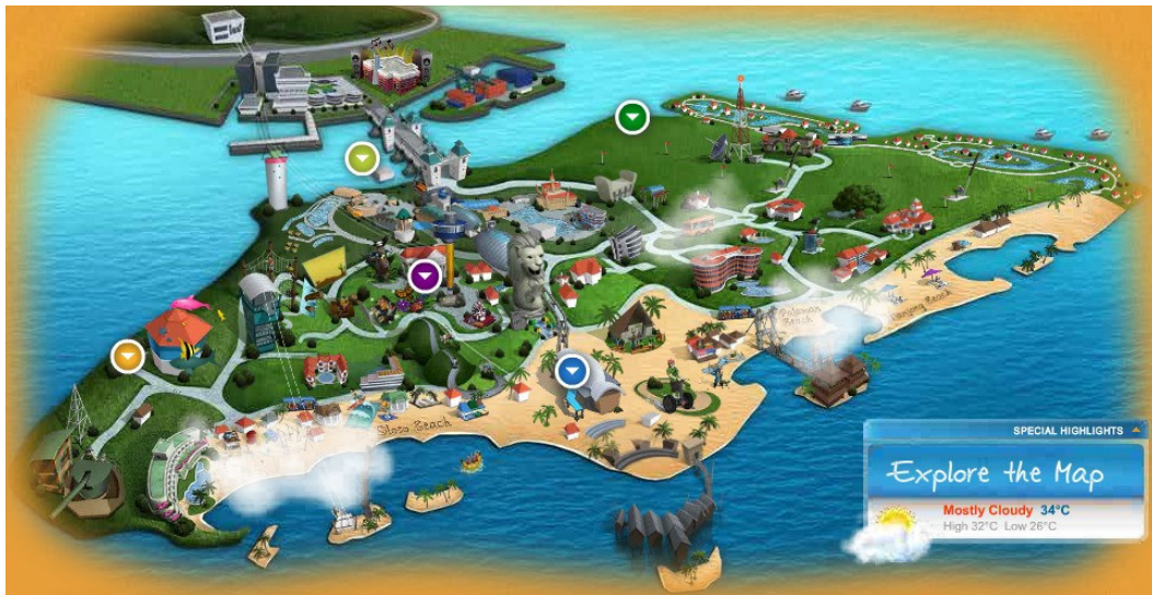
圖 6 聖淘沙島現況分區圖(資料來源：Sentosa Development Corporation)

聖淘沙名勝世界綜合度假區位於聖淘沙島北側，由馬來西亞雲頂集團 Genting Singapore P.L.C.於新加坡所設的子公司 Resorts World Sentosa 所規劃經營，位於聖淘沙島北方，與新加坡本島相望，聖淘沙捷運並於園區東部設置濱海捷運站，整體土地開發面積 49 公頃，總樓地板面積約為 343,000 平方公尺，總投資金額含土地租金約 65 億 9000 萬新加坡元，由美國建築師 Michael Graves 設計，並與新加坡當地 DP 建築師事務所共同合作。