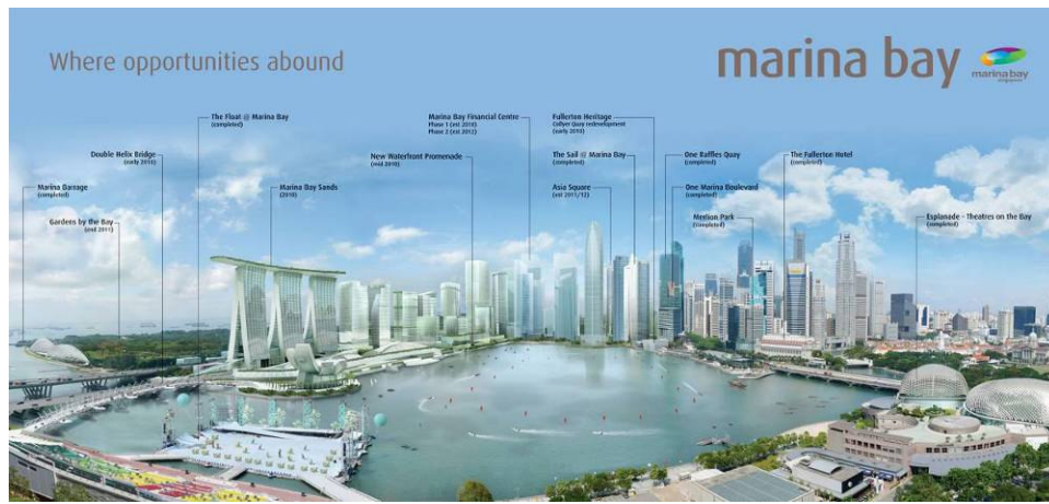
圖 4 濱海灣區計畫圖

依據濱海灣金沙提供的資料，濱海灣 IR 計畫總開發土地面積 15.5 公頃，總樓地板面積約為 581,400 平方公尺，總投資金額含土地租金約 55 億美金，由美國建築師 Moshe Safdie 設計，於 2010 年 4 月 26 日開幕營運(開幕日期較當初投標承諾晚 4 個月)，估計有 1 萬名員工，其中 7 成為新加坡人。濱海灣金沙綜合度假區各項設施如下：