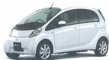
ホワイトソリッド