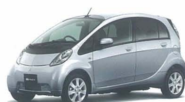
クールシルバーメタリック