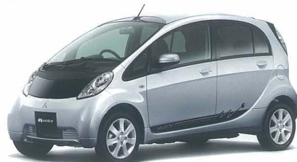
クールシルバーメタリック/ブラックマイカ*2