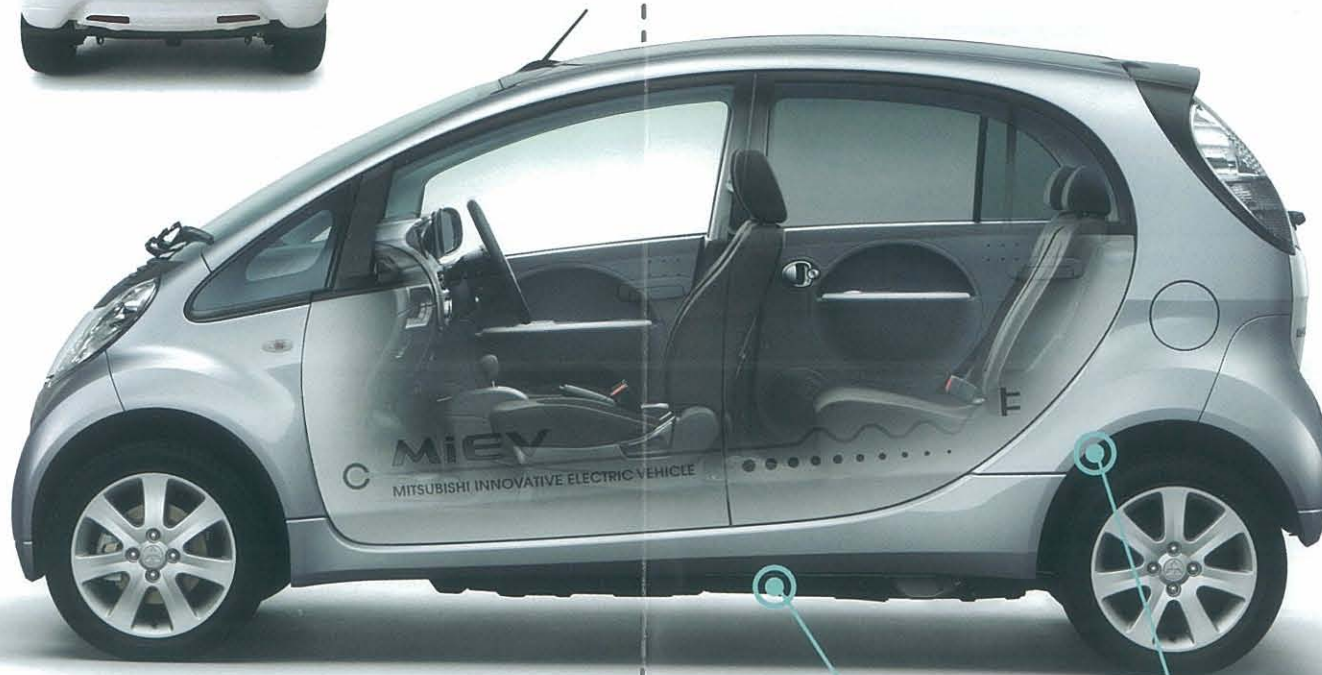
ボディカラー: クールシルバーメタリック/ホワイトソリッド・TYPE A 2トーン(有料色)

コンビネーションメーターが「電力の使用状況」「バッテリー残量」「残り航続可能距離」などをわかりやすく表示します。またセレクターレバーにより、トルクフルな走りや発電しやすい走りに適した走行ポジションを、運転中自在に切り換えることができます。