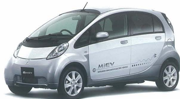
クールシルバーメタリック/ホワイトソリッド*1