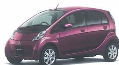
ラズベリーレッドパール*3