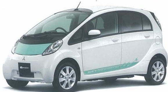
ホワイトパール/ミントグリーンソリッド*2