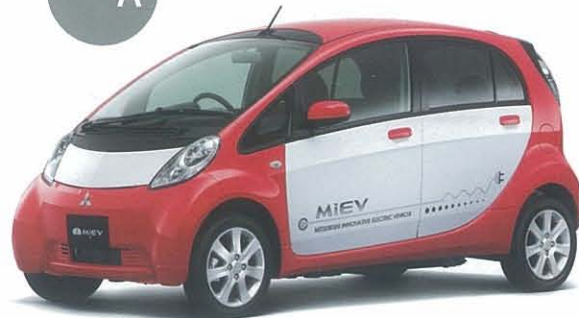
レッドソリッド/ホワイトソリッド*1