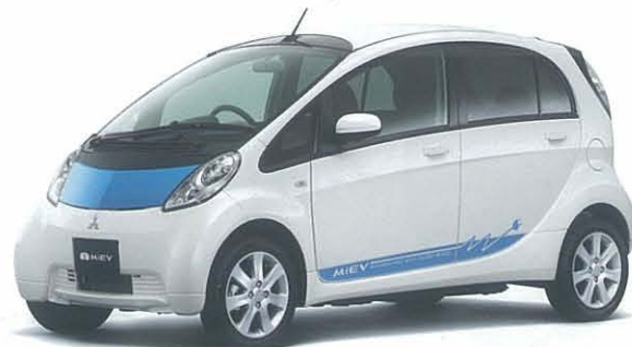
ホワイトパール/オーシャンブルーメタリック*2