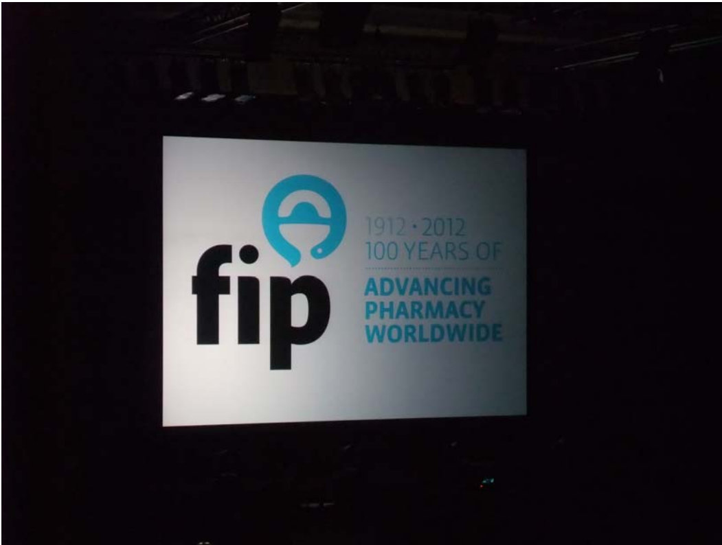
圖一、Opening Ceremony 現場