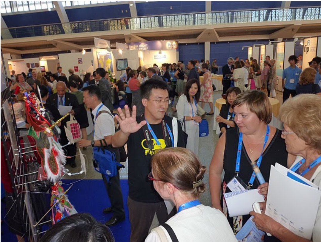
圖十一、大會展場內 2010 FAPA 宣傳攤位盛況