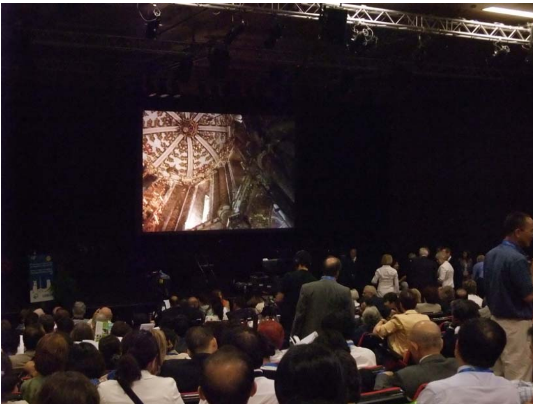
圖二、Opening Ceremony 現場