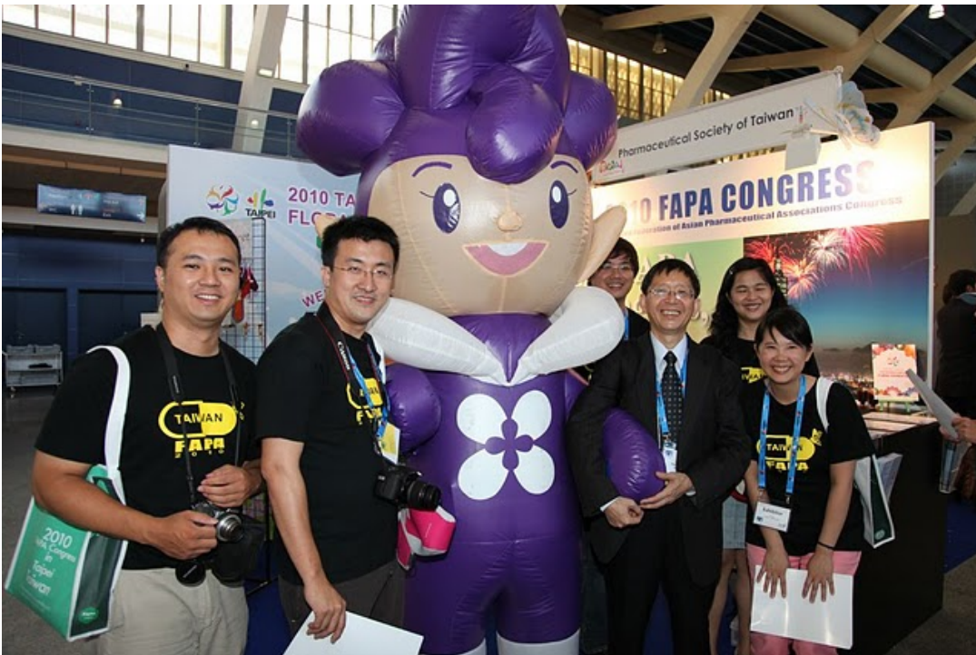
圖十二、大會展場內 2010 FAPA 宣傳攤位工作人員合影