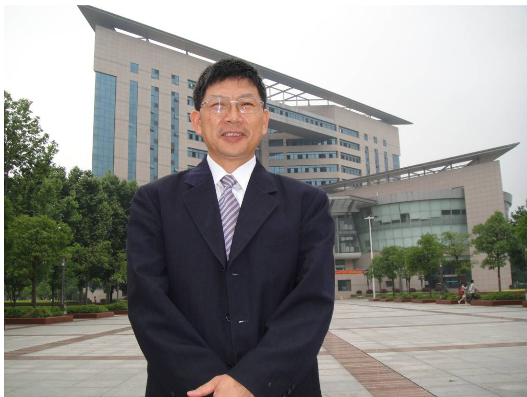
圖 2 徐啟銘教授至湖北大學參訪與演講 2