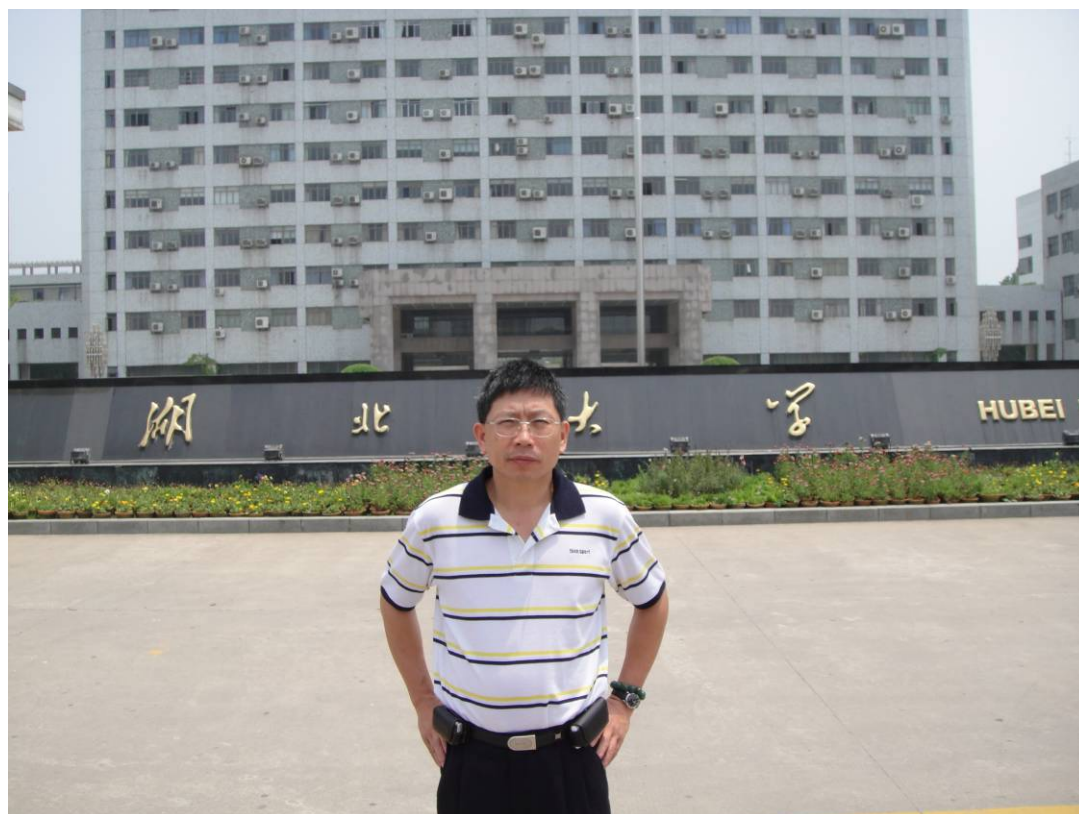
圖 1 徐啟銘教授至湖北大學參訪與演講 1