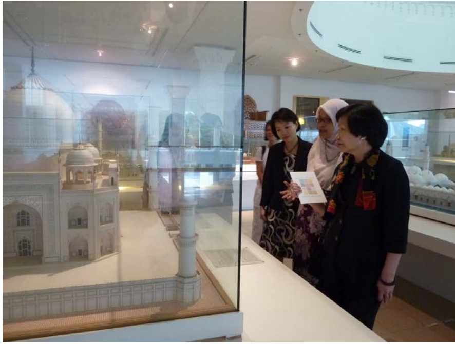
伊斯蘭藝術博物館內各國清真寺模型常設展