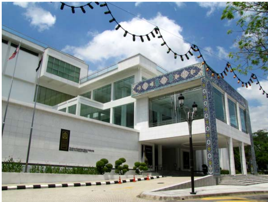
伊斯蘭藝術博物館外觀

於 1998 年落成，仍是相當年輕的一個館，為東南亞最大的伊斯蘭博物館。歷史與地理因素使然，伊斯蘭文化融入了馬來、中國與印度文化，在博物館中展現了因地制宜且具有活潑彈性的伊斯蘭文化。伊斯蘭的圖樣具裝飾藝術特性，看似繁複實則有其簡單規則，應用在展場設計中，表現出現代的摩登氣質。