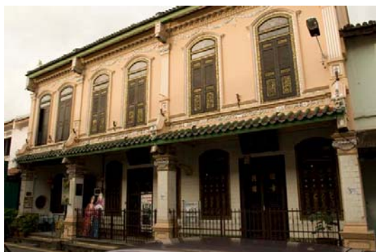
峇峇娘惹遺產博物館外觀

為峇峇三代的故居，建於十九世紀中葉，現開放給一般大眾參觀，內部堪稱典型的峇峇娘惹生活樣貌。建築的特點為屋中有一開放的庭院，為稍顯狹長的街屋帶來採光通風的功能，有時也會配上一口井供住戶取用。室內擺放的器具則以鑲嵌螺鈿的中國硬木家具與來自江西和廣東的特製陶瓷器最引人駐足。