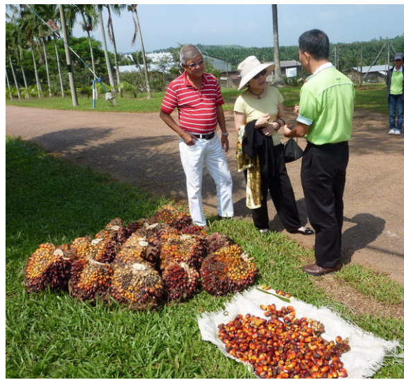
一串串的油棕果，棕油就是從這些果實中萃取出來的