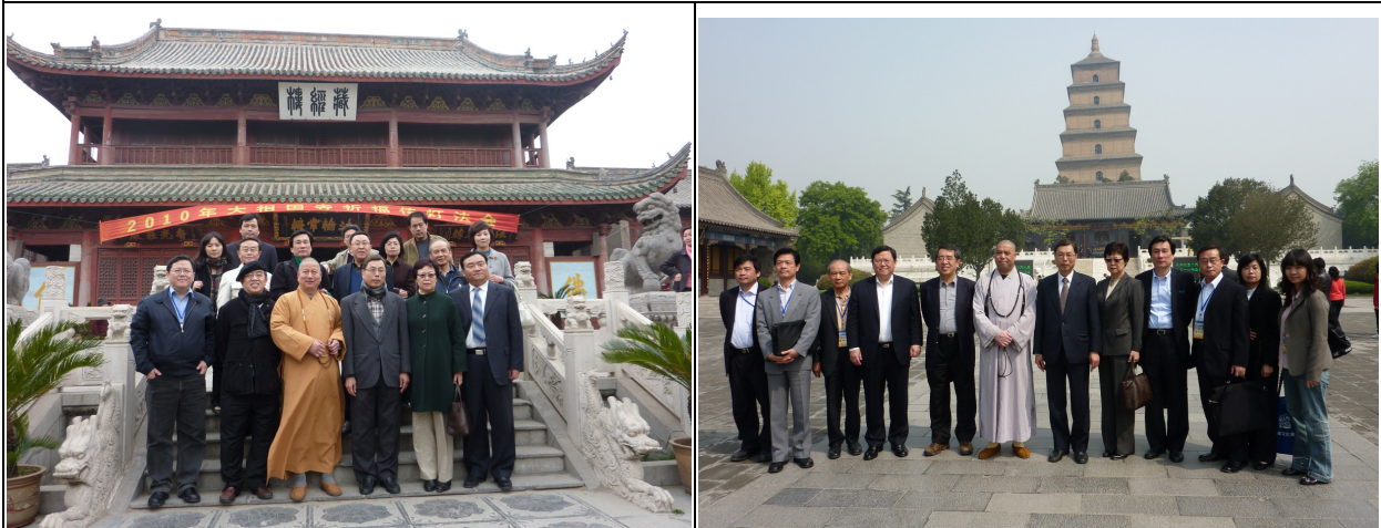
考察團參觀大相國寺（左）及大慈恩寺（右），並與寺方人員合影留念

參訪團在河南、陝西參訪期間，也會見了河南省副省長宋璇濤及陝西省省長袁純清，實地瞭解兩省省情，以及與台灣的交流往來情形，實有助於未來兩岸全方位交流、