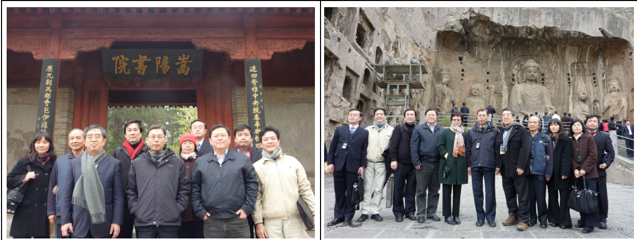
考察團參觀嵩陽書院（左）及龍門石窟（右），並進行合影留念