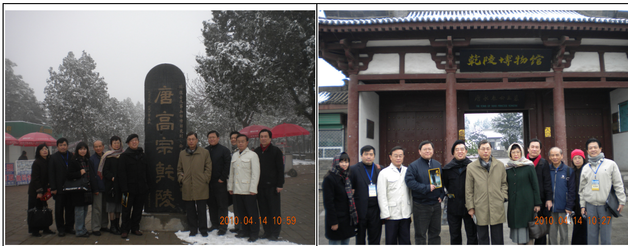
考察團參觀唐高宗乾陵（左）及乾陵博物館（右），並進行合影留念

博物館時表示，在實地瞭解各博物館長項及特色之後，故宮未來規劃相關計畫時可邀請大陸的博物館來台展覽。