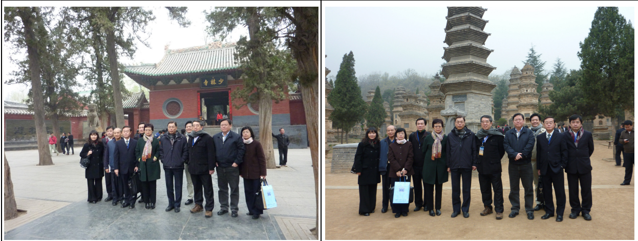
考察團參觀少林寺（左）及少林寺塔林（右），並進行合影留念