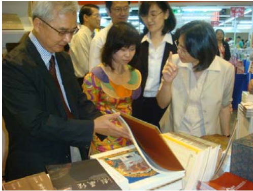
新加坡西南區市長長兼環境與水源部高級政務次長許達值博士參觀本院展示專區，由筆者解說「龍藏經」之珍貴出版價值。