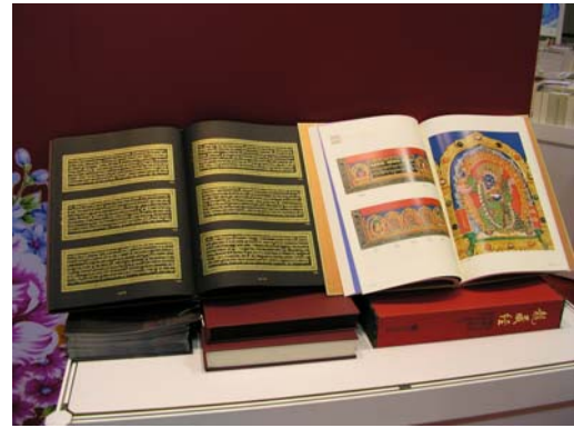
本院展示定價高達新台幣 188 萬元之「龍藏經」圖像之部與經文之部樣書。