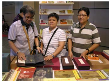
5月28日(農曆四月十五日)書展開展當日，同時是衛塞節（Vesak，俗稱浴佛節），在這一天，東南亞各佛教國家都有盛大的節慶活動，民眾至本院展示專區，對印製精美佛書愛不釋手，各類佛教經書出版品成為這次展出焦點，銷售情形良好。