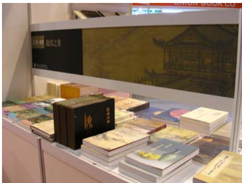
本院出版品展示專區一隅