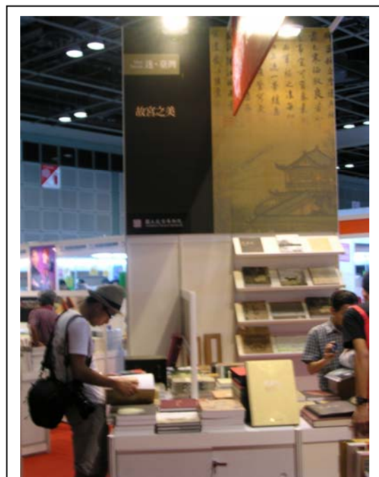
本院出版品展示專區一隅