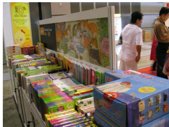
台灣主題館今年以「Meet Taiwan（迷台灣）」為主題，推出趨勢台灣、數位台灣等 10 大主題共逾 2 萬冊書，吸引大批書迷駐足。