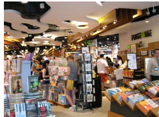
參訪當地主要華文圖書銷售書店—新加坡最大連鎖書店大眾書店、商務印書館有限公司、草根書店及 PAGE ONE 書店。