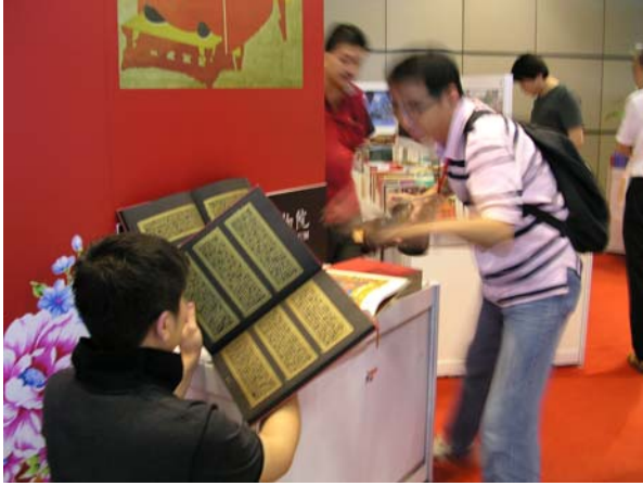
本院專區主題形象牆前展示珍貴「龍藏經」出版樣書，當地媒地拍攝情形