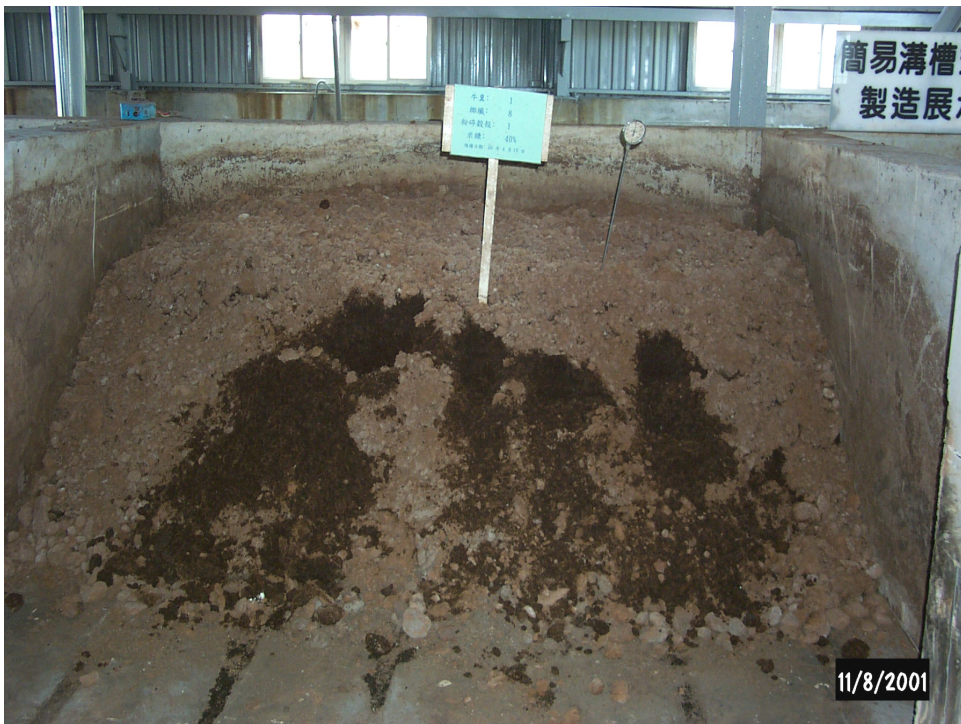
圖 19.堆肥體插置溫度計觀測溫度變化情形