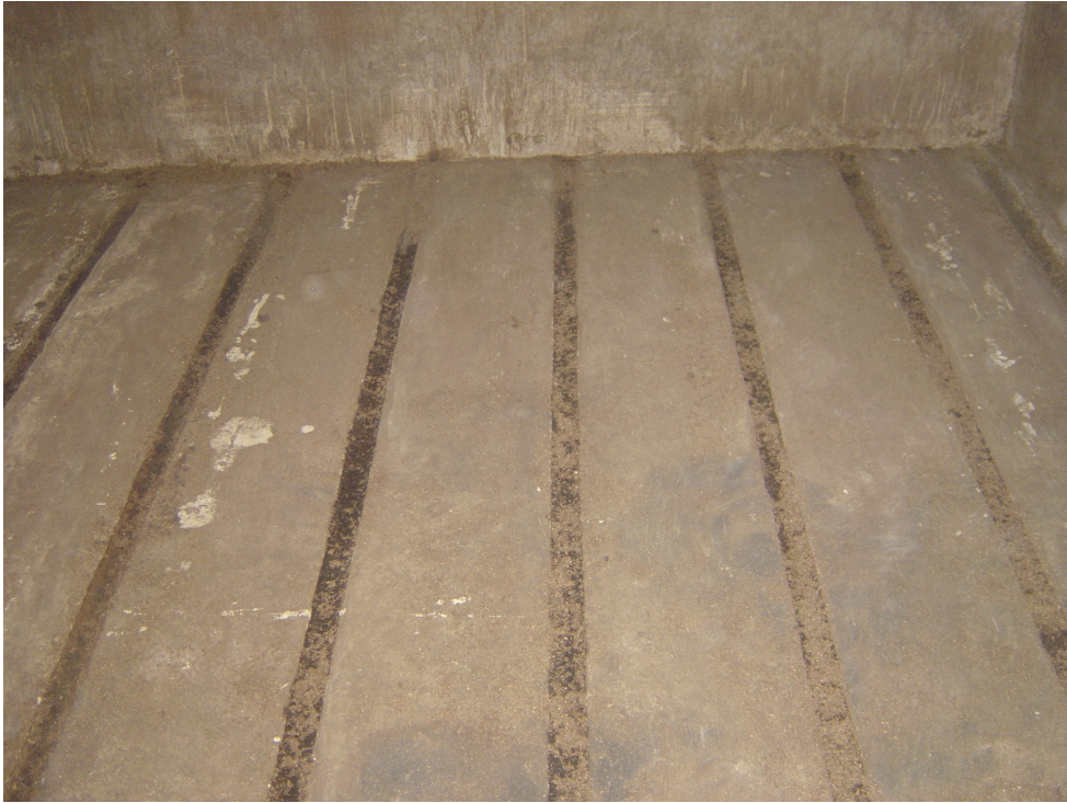
圖 16.堆肥槽底部廢液排放溝