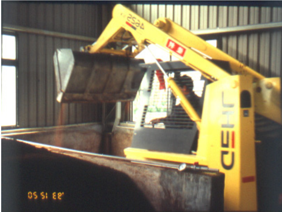
圖 18.以鏟裝機進行翻堆