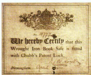
檳榔嶼同盟會可能用此鐵制保險箱來存放現款和文件。它是在 1900 年在英國伯明翰製造，可防火，裝有家室專利鎖 (Chubb's patent lock)。

這裡不僅保留同盟會時期，檳榔嶼同盟會員存放現款和文件的鐵製保險箱，電影《夜·明》電影中「庇能會議」的場景，也在此地拍攝。我們一行人在此除考察有關孫中山和檳城支持者的歷史與事蹟