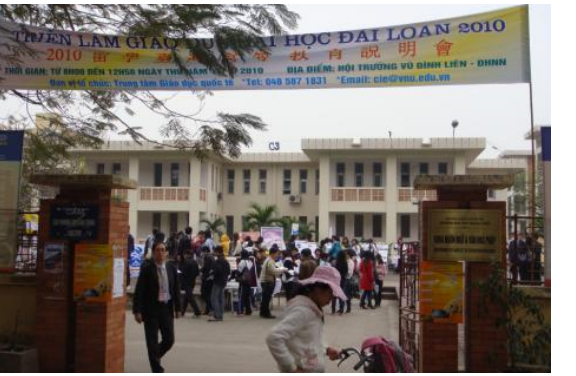
河內國家大學-外國語文大學門口 擺設攤位