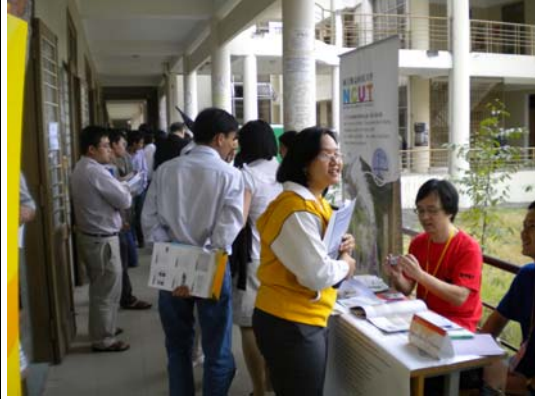
越南學生於各校攤位詢問情形