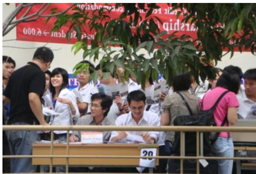
越南學生於各校攤位詢問情形