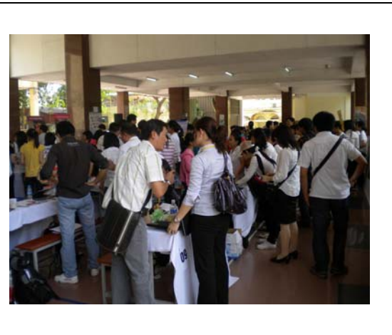
越南學生於各校攤位詢問情形