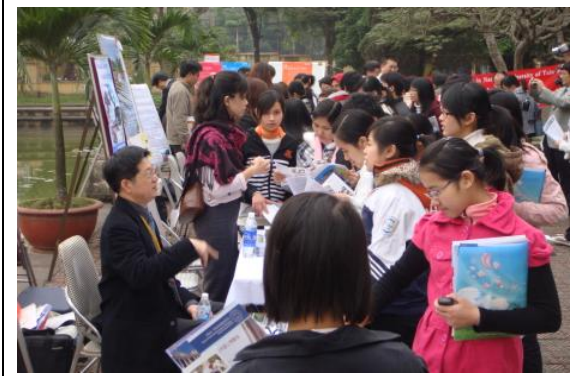
越南學生於各校攤位詢問情形