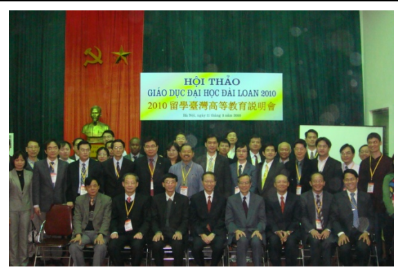
代表團成員與越南大學代表合照