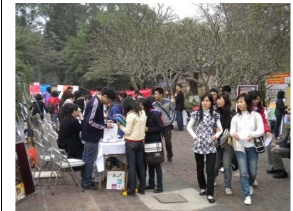
越南學生於各校攤位詢問情形