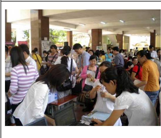
越南學生於各校攤位詢問情形