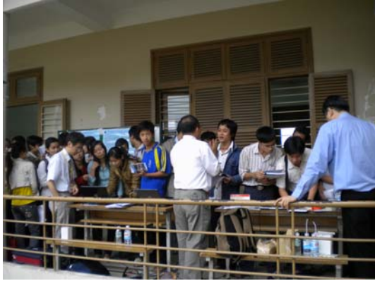
越南學生於各校攤位詢問情形