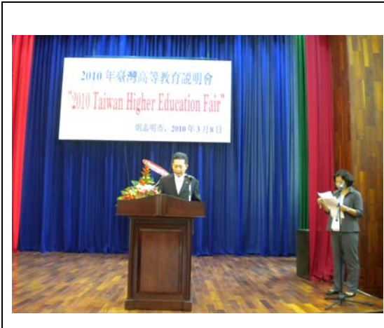
駐胡志明市臺北經濟文化辦事處 楊司恭處長致詞