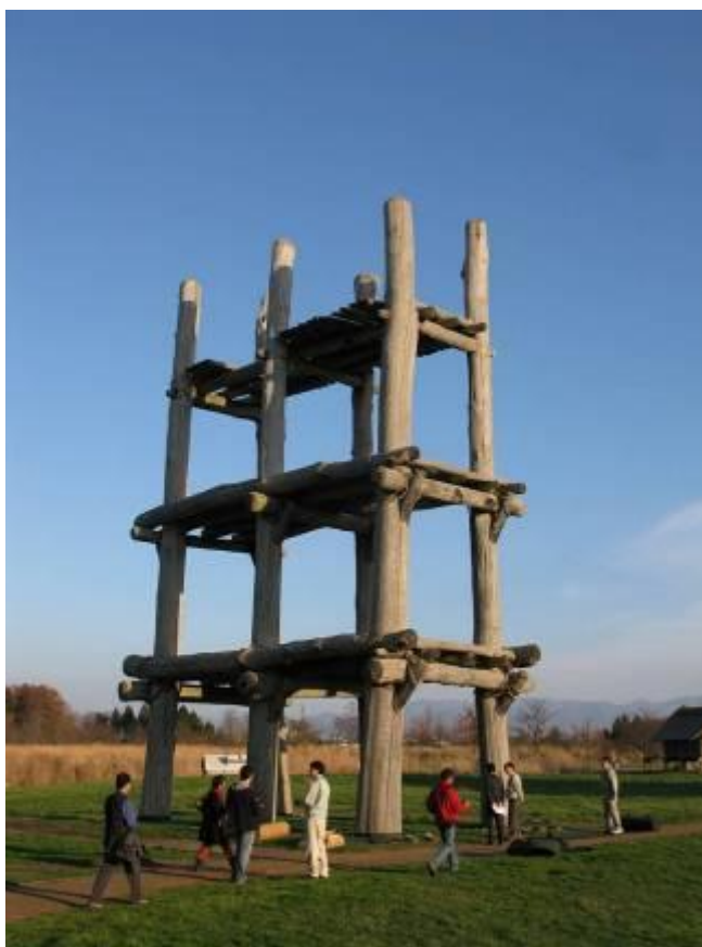
圖 11-9 高約 14.7 公尺的大型掘洞立柱式建築為三內丸山遺址的重要標誌

為了把三內丸山生活過的繩文人村落遺跡作為重要的歷史文化遺產加以保存，並且讓民眾可以感體驗「村落」風情。青森縣政府以三內丸山遺址為基地，規劃繩文之丘三內勝地公園，