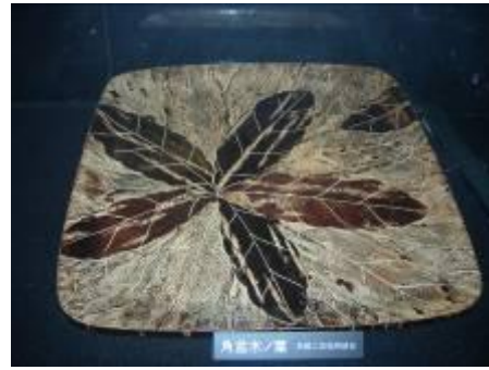
圖 6-8 精緻而紋路變化多端的角盒木