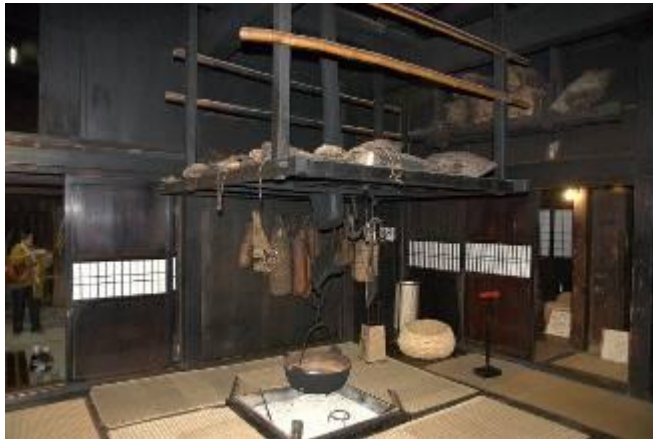
圖 4-11 田麦俣民家內的陳設

另外田麦俣的民家，屋內並無太多的燈光設備，整間民家雖然過於昏暗，但卻頗能讓參觀者身歷其境地去感受昔日的生活環境。