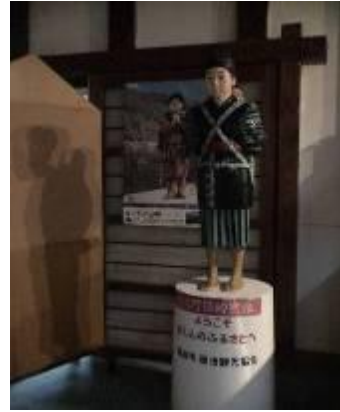
圖 3-9,10 日本連續劇「阿信」拍攝照片及模型展示