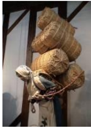
圖 3-16 背負米俵模型