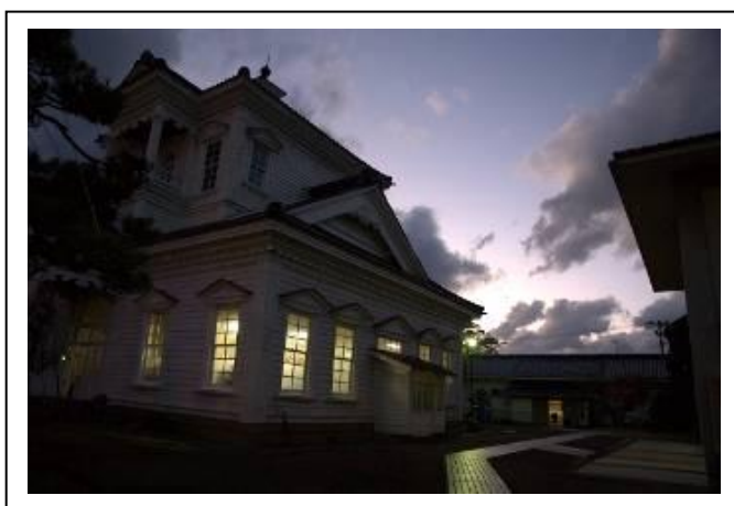
圖 4-5 舊鶴岡警察署廳舍