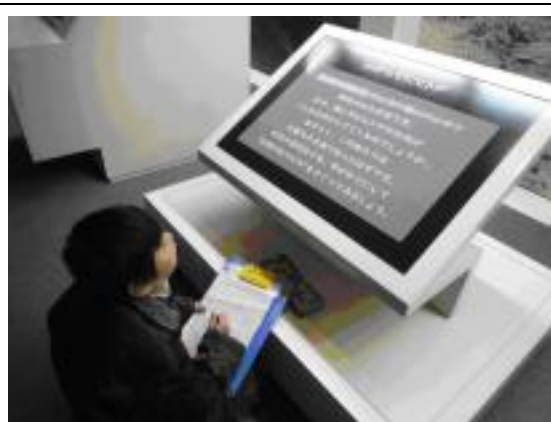
【圖 1-13】小學生帶著學習單參訪博物館

博物館雖然在其 DM 的地圖上有標示出周邊其它民間社區的文化設施或文物館，但目前也只有與山形市資料館討論過兩館合作的可能，並期待未來能夠直接到社區中辦理展覽等相關活動。目前博物館尚未主動與社區合作，博物館的地方生活圈概念未積極進行。