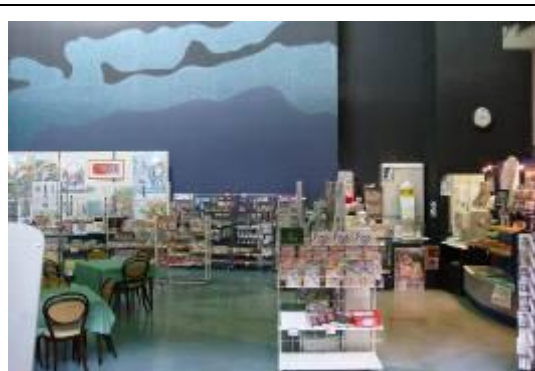
圖 5-8 賣店部份由第三部門來經營，只負擔水電費，不用付租金