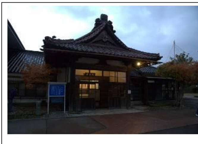
圖 4-4 御隱殿