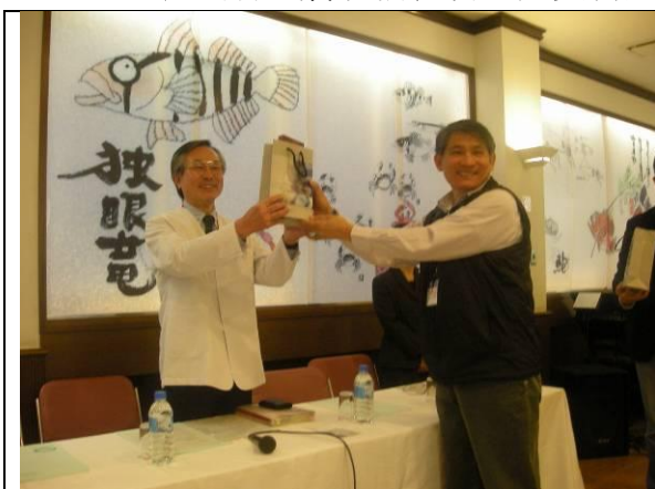
圖13-1 座談會1-主持人贈送館長禮物