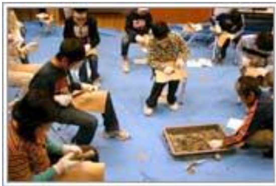
圖 12-9 博物館舉辦「學生利用見學活動」情形

地底之森為公辦民營的博物館，隸屬於仙台市政府，委託「財團法人仙台市市民文化事業團」經營，每年補助預算 1 億 1 仟萬元，於 1996 年 11 月 2 日開館，至今已邁入第 14 年，據館長表示，開館時年參觀人數達 6 萬人，但目前每年僅有 4 萬人入館參觀，主要原因是性質相近的館舍日益增加，且受到人口少子化的趨勢影響，主要參觀群「中、小學生」逐漸減少，因此目前正逐步調整與轉型，除了與校方共同合作提出教案，增加高中生、大學生入館機會、培養對考古學的興趣之外，也朝向與社區互動合辦活動的方式，扮演附近社區公民館的角色，不定期舉辦社區課程或活動提供社區居民或學生報名參加，像是「古代米-親子田間體驗營」、「英語導覽員培訓」、「遴選 10 位中學生以上的學員參加「富沢遺跡挖掘、保存作業體驗教室」、「世界遺產與考古學研討會」等等。