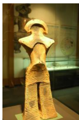
【圖 1-8】鎮館之寶「繩文維納斯」複製展品