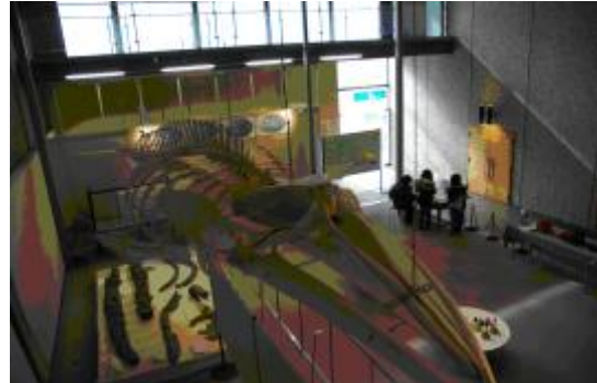
【圖 1-6】大海牛骨骼的展示證明過往的山形縣過去曾是海洋的一部分