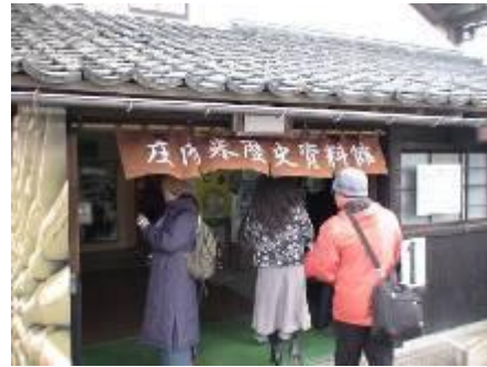
圖 3-5 庄內米歷史資料館入口處