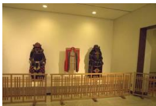
圖 6-3 武夫造型服飾-1