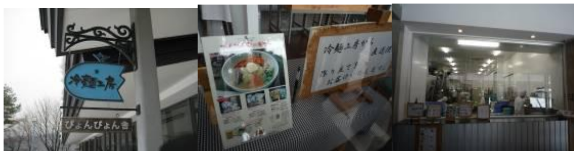
圖 7-9 盛岡冷麵：盛岡冷麵為當地的特產，相當於拉麵，除了可以在這裡體驗製麵的樂趣外，更可以在這裡直接品嚐自己的手藝。