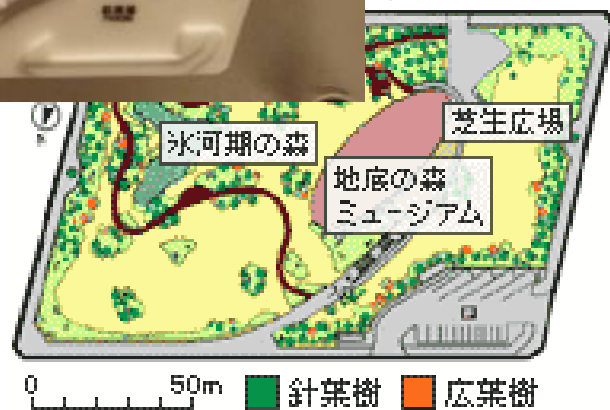
圖 12-6 地底之森博物館全區配置圖

館內有分為常設展及企劃展兩部分，常設展包括地下展示室與一樓展示室，地下展示室為冰河時期針葉林遺跡之保存原貌，並以投影及音效方式還原當時森林情境在壁面上，也透過投影幕呈現舊石器時代人類在此地活動及敲擊石頭取火等行為之推論影片，還原 2 萬年前在這裡可能發生的事件與樣貌；一樓展示室則介紹富沢遺址調查的過程、舊石器時代人類活動情形、石器敲擊剝落過程的推論、及 2 萬年前冰河環境的形成、冰河時期的植物、富沢地區的樹林環境等；企劃展則因應策展規劃，於不同期間作不同主題的展出，目前企劃展主題為「仙台平野的彌生墓」，即蒐集仙台市、宮城縣、名取市等地之教育委員會及東北大學文學研究科所收藏彌生時代各遺址所挖掘出的典藏品。除了展示室，一樓還設有一間研修室，提供專題演講或小型課程使用。