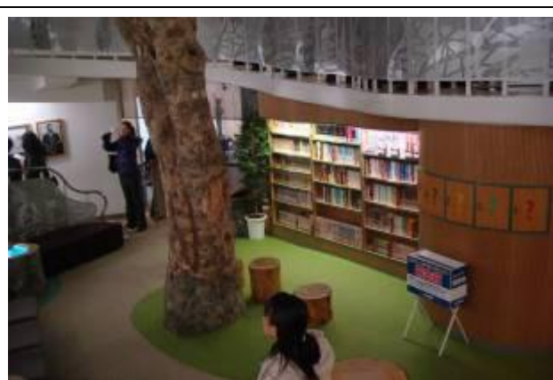
圖 5-5 漫畫展示室