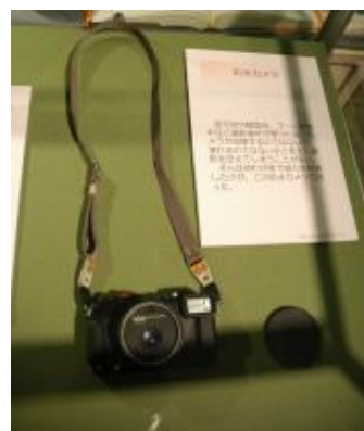
【圖 1-12】博物館之友會會員所搜集的防水照像機