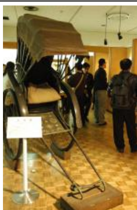
【圖 1-9】第三展示室生活變遷的展區

第三展示室介紹近代山形縣人們 100 年來之生活變遷的文化，象徵著從大正、昭和時期開始的文明開化的物品，電力的使用、建築以及戰爭的影響，山形縣民使用的器具，如人力車、留聲機、西式服裝等等，在這裡能夠感受出山形縣百年來西風東漸的影響以及大時代下山形縣接受的新事物、發動戰爭縣內的防空演習等重要大事如何影響著人民的生活，也展示了鄉土玩具【圖 1-10】，如藏王娃娃以及用稻草、木片所雕刻的家禽等。