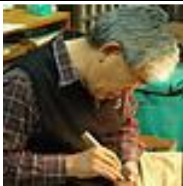
圖 6-5 樺細工實演一師傅打造櫻樹貼皮工

樺細工傳承館從開館的 20 萬入館人次，至今每年仍維持 6-8 萬的參觀人次，館內除了樺細工的展示外，常設展設有左助家的民俗資料館、而主題展則是展出藝術家到角館寫生的傳統版畫展，以及早期農村的生活器物展。整體展區的空間與動線規劃，讓參觀者在武家文化的脈絡下，清晰看到角館武家文化精神轉折為工藝風華的軌跡、而館內最精彩的是可以親眼目睹專業師傅製作樺細工的實地演出，師傅純熟的技術、專注的神情，本身彷彿就是一尊雕塑，其細膩的動作，一刀一磨轉化了武家的精神為樺細的美學雕琢，樺細工的色澤與紋路，都是用手工慢慢打磨而成，除了美學典藏外，也具有生活實用性，只要不亂摔亂撞，通常買了，用上一輩子沒有問題。