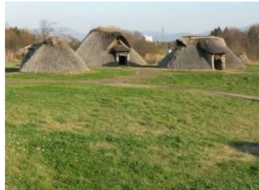
圖 11-1 三内丸山遺跡位於日本本州最北的青森縣

青森縣的歷史在繩文時代（1 萬年前至西元前 3 世紀）遺留下來的遺迹有三内丸山遺跡等。鎌倉時代（12-16 世紀），津輕安藤氏以“十三湊”（中世紀日本海沿岸交易港）為據點進行大量海上貿易。江戶時代（16-19 世紀中葉），主要由盛岡藩和弘前藩所支配。另外，還有八戶藩、