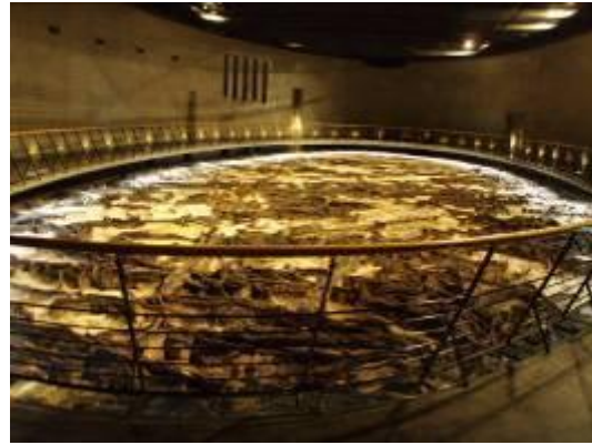
圖 12-2 地底之森博物館最具代表性的展示區-冰河時期針葉林遺跡