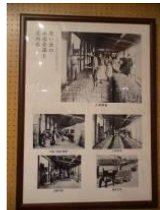
圖 3-8 農村及穀倉老照片

參訪團員大都對山居倉庫及阿信在加賀屋幫傭的精緻模型讚嘆不已，差點忘了苦命阿信的可憐，生產貿易傳播過程說明了稻米的流通，而 1983 年發行的「米券」更引發好奇心，原來米券的功用除了換米外，還有銀行的背書可兌換現金，它可是有價證券呢！米券的發行也說明米的大量流通及重要性；庄內平野的圖文介紹，印證路程中看到的秋收後稻田，成群的白鷺鷥在田間覓食，鳥海山漂亮的山形，跟圖片上一模一樣，所謂好山好水產好米，一點不為過；另一主題農家家屋、昔日圍爐風景呈現早期農村家居生活情形，模型逼真到讓人重回昔日農村生活，還有背米體驗區，展示模型中背米俵的女工共背了 5 個米俵（約 300 公斤）讓我懷疑日本的女人難道都是大力士，經詢問方知是為求效果多放了 2 個，一般來說正常體力是背 3 個米俵（約 180 公斤）。