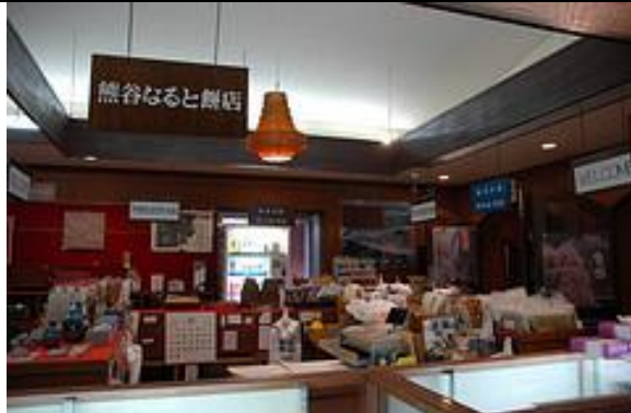
圖 6-2 武家屋敷武家屋敷轉型為樺細工