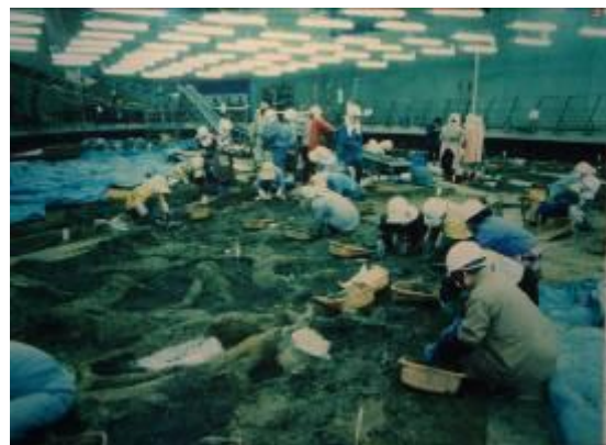
圖 12-4 遺跡挖掘情形。