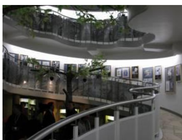
圖 5-6 夢的螺旋梯