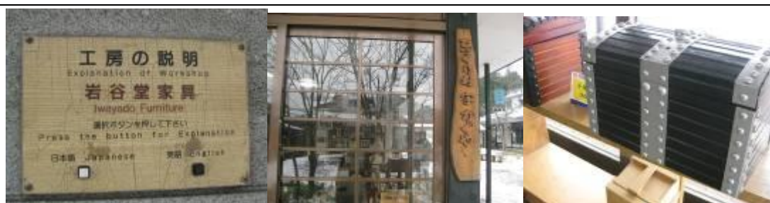
圖 7-3 民藝家具 ：手作村裡唯二不提供民眾手動體驗的工藝，木工上的鐵器例如把手，即是產自於園區內南部鐵器房裡所生產的。

圖 7-2 南部鐵器工房 ：南部鐵器在盛岡手作村裡最為著名，共有五家廠商進駐，所有的鐵器由手工生產，以模鑄及鍛造為主，無法大量生產。原料鐵沙使用當地的鐵礦提煉而成，正因量少質佳，型制多樣，又因其鐵礦質地特殊，加溫或泡茶可釋放鐵離子，許多人不遠千里到這裡購買，現場銷售熱賣。鐵器的工藝品種類繁華，館內可親眼見識師傅細膩的手作功夫，鐵器製作因具危險性、技術性，不提供體驗的課程。