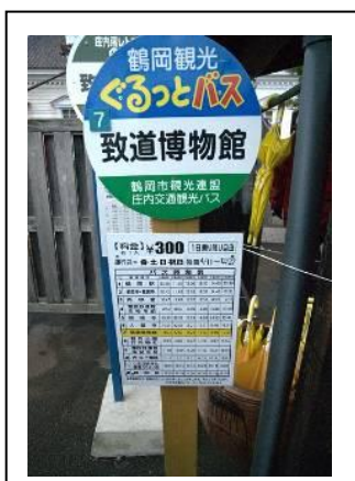
圖 4-2 有觀光巴士行經該館

致道博物館的展示文物，除了酒井家世代相傳的甲冑、美術工藝品、書畫之外，另外也展示了庄內地區出土的考古文物及江戶時代的民俗器物，同時也提供場所做為當地社團、學校策展之用。致道博物館期待透過展示庄內地區的自然環境、人文歷史等在地文化，讓下一代的子孫學習成長，了解自己文化的根源，學以致道，就如同本館名稱「致道」的典故－《論語》子夏曰：「百工居肆以成其事，君子學以致其道。」