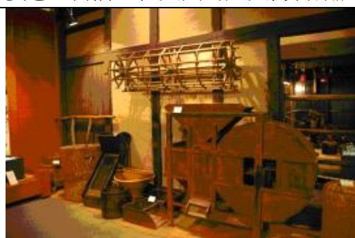
【圖 1-7】第二展示室山形歷史的展區

本館的鎮館之寶，即是素有「繩文維納斯」【圖 1-8】之稱的繩文時代的女性人型土偶等珍貴物品。這個土偶是繩文時代中期的作品，出土時為 5 片陶片，經過考古學家的復原之後，是個高 45 公分的土偶，土偶抽象地表現了女性美妙姿態，目前正在英國的大英博物館展出，借展時間到今年(2009)的 12 月 15 日。