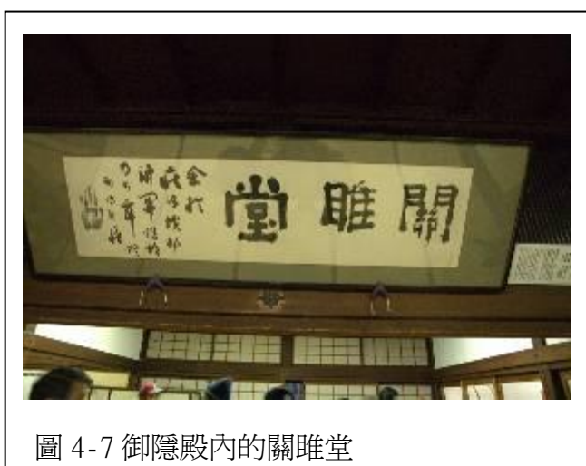
圖 4-7 御隱殿內的關雎堂