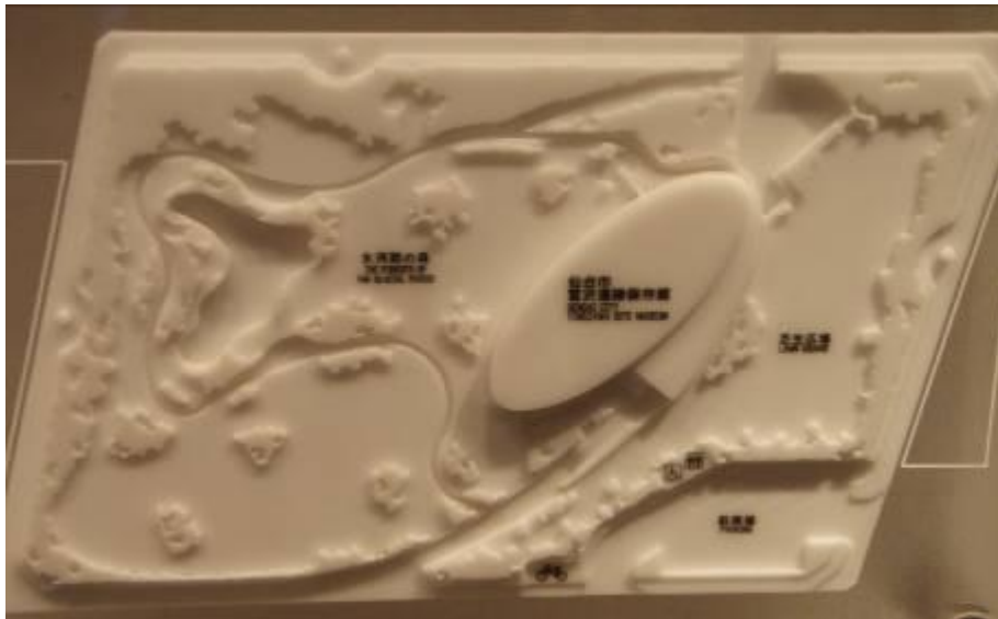
圖 12-5 地底之森博 物館全區模 型

建築面積 1,196 平方公尺，為地上一層、地下一層之兩層樓鋼筋混凝土構造之建築物，建築工法採清水模外牆，建築設計風格呈橢圓形，入口動線採螺旋狀方式向下進入館內。