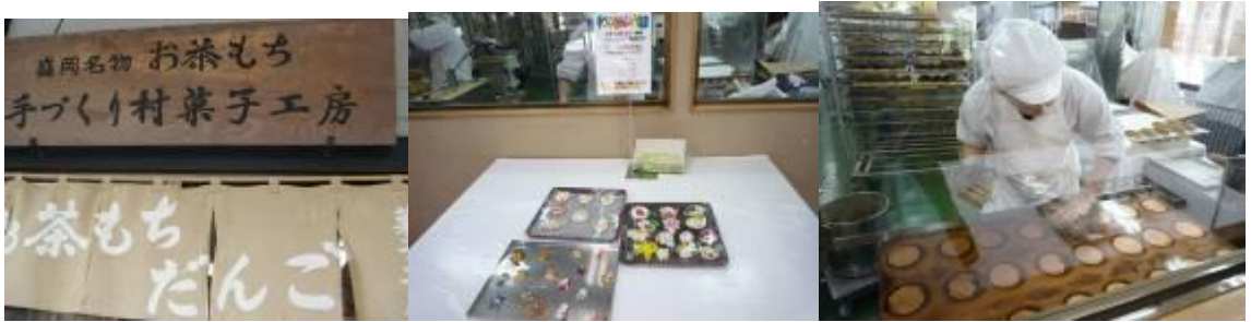
圖 7-6 和果子：各式各樣盛岡特有的甜點，提供多樣的日式甜點試吃試作，是熱賣點之一，觀者或多或少都有買。