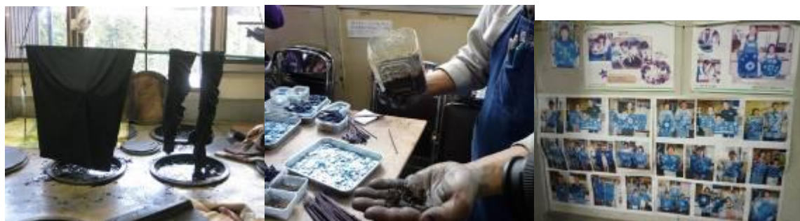
圖 7-11 藍染：手作村裡的藍染作品富創意具有巧思且多樣豐富，一條約 60 公分見方藍染印花包袱巾，在老師示範下，立即變成一別緻提袋，足見巧思；店長也展示應邀來台參加客家藍染活動邀請函及活動證書，並說明其藍染作