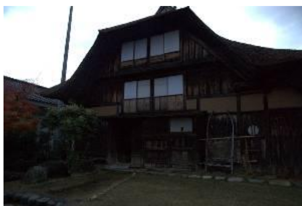
圖 4-10 田麦俣民家