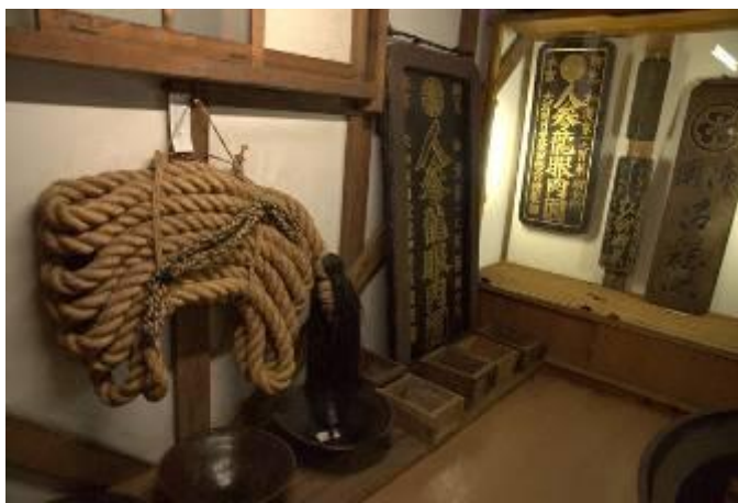
圖 4-12 江戶時期的民俗器物

全園區各館最活潑的展示手法在美術展覽會場，我們抵達時的當期展覽：一是寒蘭展、二是東北藝術科大學版畫展，秀雅細緻的蘭花盆栽與庭園十分契合，很有傳統日本的氛圍；而活潑的版畫展，則看到年輕一代日本學生的活力，有趣的是我們也在作品中看到學生們運用傳統日本紋飾的手法，轉換成當代的語言後，別有風格又不失文化精神，這大概就合了「學以致道」的館旨吧！