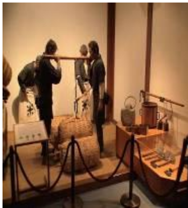
圖 3-6 米倉作業模型展示