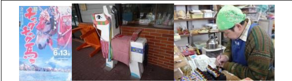
圖 7-4 鄉土玩具：木製彩繪的鄉土玩具，結合當地於盛夏六月辦理的的祭典：「恰咕恰咕馬」名字由來自馬身上配掛的鈴鐺所發出的聲響。盛岡每年在六月時會讓馬穿上衣服掛上鈴鐺在上街遊行，沿途小朋友可騎上馬，享受祭典之樂。