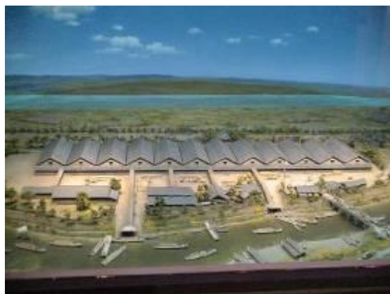
圖 3-2 精緻的山居倉庫建築模型

山居倉庫的屋頂為 2 層建築，具有通風防潮功用，建材就如台灣早期的農家土角厝，後因修繕木板已塗上焦油防蟲害，倉庫群後之山毛櫸更具有防曬防強風之功能，是文化資產，也是參觀者最愛景點之一；佔地約 400 平方米的倉庫群換算用稻草綑綁的 60 公斤稻米包，約可存放 12000 包，這是山居倉庫的主要功能，至今維持不變，不同的是早期稻米運輸藉助千石船運送，現因公路發達已改為卡車運輸，更撥出 1 棟倉庫做為資料館，收藏展示庄內米相關歷史文物、精緻模型等，更結合電影產業，變成旅遊熱門景點。