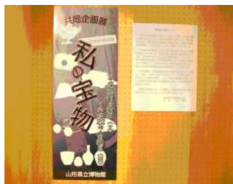
【圖 1-11】「我的寶物展」特展區

除了「我的寶物展」，今年已經辦理過的特展有「山寺-歷史與祈福」展覽；企劃展部分有「庄內沙丘與海岸林-保安林的歷史與自然」展，另外也展出了 2005 年由加藤繁富先生寄贈的海與陸的貝類。