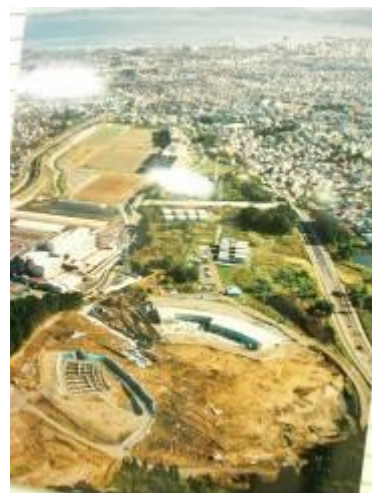
圖 11-3 1994 年興建中的青森縣棒球場因三内丸山遺跡而停工

到目前為止，三内丸山遺址所發掘調查出土的遺跡，包含日本繩紋時代前期到中期(約 5,500 年前~4,000 年前)的大規模村落遺跡 3 ，以及約 1,000 年前日本平安時代的城館遺跡。特別是由日本繩紋時代大規模村落遺跡中，發掘出豎穴住居遺跡、大型豎穴住居遺跡、掘立柱建築物遺跡、巨型柱狀建台。埋有大量遺物的山谷(泥炭層)，花費了大約 1,000 年形成的隆土，超過千座的大人和小孩的墳墓，為了製作土器而挖的洞、貯藏穴等，規模龐大。