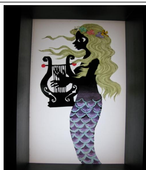
圖13-4 七夕館特展--紙藝家藤城清治的作品之一