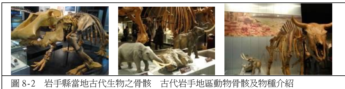
圖 8-2 岩手縣當地古代生物之骨骸 古代岩手地區動物骨骸及物種介紹