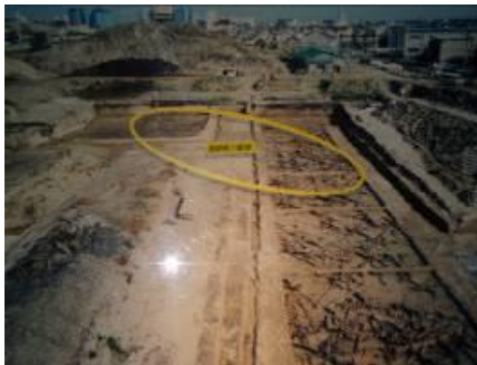
圖 12-3 第 30 次調查發現地表呈現火燒痕跡

地底之森博物館位於日本仙台市太白區，鄰近地下鐵長町南車站、JR 東北本線長町車站及東北自動車道，雖非位於市中心，卻是交通便利的郊區，原本這裡是國民小學預定地，在西元 1990 年時展開公有設施興建前必須進行的挖掘調查動作，以確認地底下沒有遺址或遺跡，就在第 30 次挖掘調查時，發現了冰河時期植物存在的痕跡，同時也發現有舊石器時代以石器敲擊取火所留下的石頭碎片及地面炭化的遺跡，為作更進一步考古調查與遺跡保存，原先興建小學的計畫中止，改為興建這座「富沢遺跡保存館」，從發現、挖掘、考古調查到保存館的規劃、興建與展示設計，仙台市教育委員會共耗時 6 年完成。