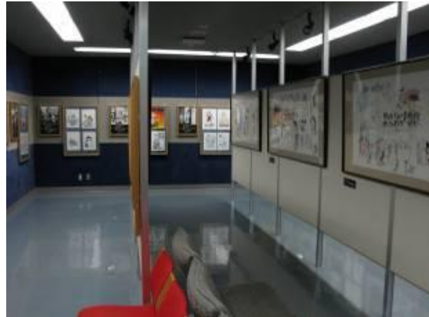
圖 5-7 特展室