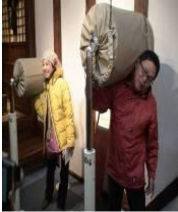
圖 3-15 體驗一下米俵的重量

是當日計算稻米的單位，用稻草層層包覆，每個重量約 60kg，編的相當結實，見證日本的稻草藝術，另稻草編織應用最廣泛的首推日本各式神社，像山居倉庫內的「山居稻荷」就運用很多稻草編織裝飾；米袋沿革從紙袋、樹脂袋到麻袋等，跟台灣差不多，米的分類從壹等到五等，聽說品質控制得當，並將屬豆百科的米的種類分為營養素、玄米、胚芽精米、五分米、精白米等，另縮小比例的千石船模型，在資料館外岸邊有一艘，導遊說又叫北前船，看來日本的造船技術真不錯。