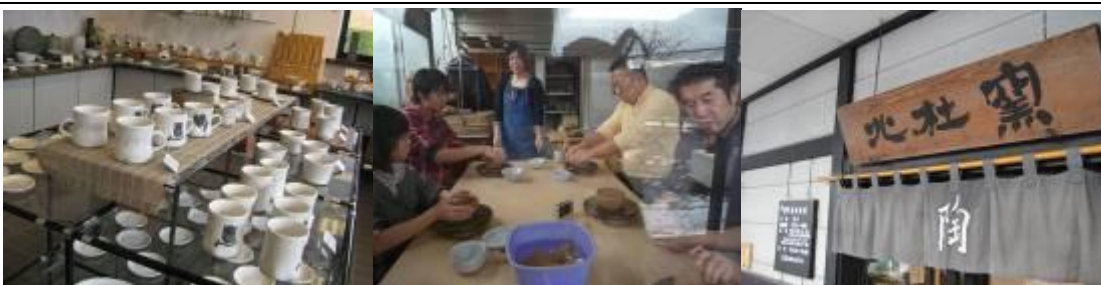
圖 7-10 陶器：以生活陶作品居多，舉凡日常應用器皿一應俱全，其作品開發加值應用，又單價不高，銷路不錯。陶藝教學以擋坯及捏塑為主，參觀時教學區座滿體驗試作者，是相當受到歡迎的體驗之一，可試作陶盤、陶碗或茶杯，。