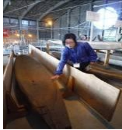
圖 10-7：學藝員導覽解說