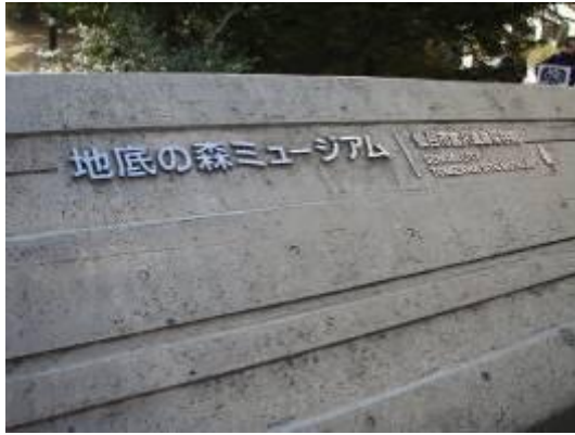
圖 12-1 地底之森博物館入口地標。