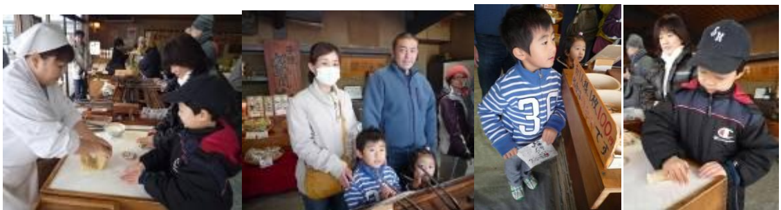
圖 7-7 南部煎餅：最受歡迎的一項體驗，到訪當日有許多父母帶著孩子到這裡進行