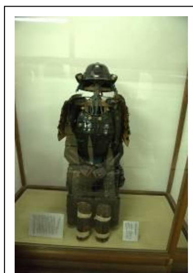
圖 4-8 武士甲冑