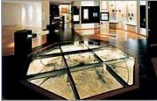
圖 12-7 常設展示：舊石器時期人類取火活動痕跡(資料來源：地底之森博物館網站)。