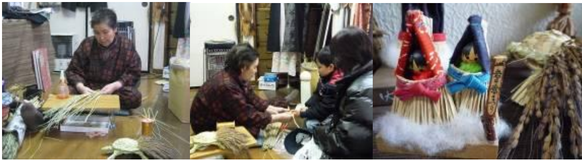
圖 7-5 民藝品：從稻草到竹子再結合當地特色祭典與風俗文物，發展出具當地特色的物品、飾品，這在手作村裡將這些轉化成商品，讓參觀的民眾除可以親身向師父學習稻桿編法外，也讓民眾帶回屬於當地的文化加值手工藝品。