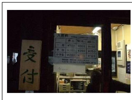
圖 4-3 入口の受付處