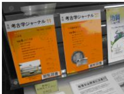
【圖 1-18】山形縣立博物館的出版品