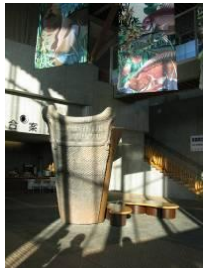
圖 11-2 三内丸山遺跡以繩文陶罐為入口意象

青森所擁有的自然資源豐富而迷人，無論是十和田湖、奧入瀨溪流或是被指定為世界遺產的白神山地，通通都是令人讚嘆的壯麗絕景。從充滿異國懷舊感的弘前、鄉土文化學術氣息濃厚的津輕半島、可遍嚐美味海鮮的八戶到最主要的行政區域青森市，都能夠讓人領略青森的魅力。