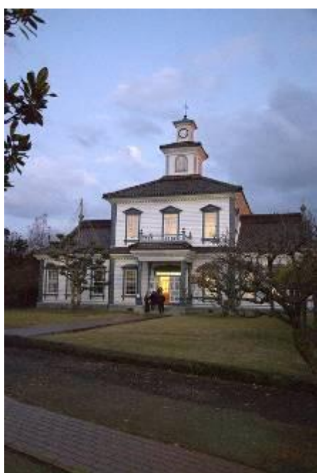
圖 4-9 舊西田川郡役所