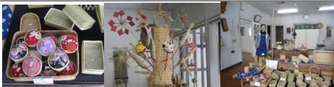
圖 7-8 竹工藝：手作村裡讓竹編創作相當多元，不再只限於器皿，而有許多創意巧思結合在裡面，作品中的材料竹子來自於盛岡地區特產的竹子。