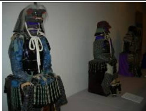
圖 6-1 武夫造型服飾-1

角館幾乎是自一建城就和櫻花埋下美麗的源頭。食館藩主佐竹義鄰來自京都，第二代城主因為迎娶了來自京都的公主，所以角館是模仿京都而建造的，思鄉情切的公主更從京都移植了櫻花樹，遍植於角館各處，柔化了黝黑結實的武家之町，增添了京都華美的古都氛圍，於是角館就有了東北小京都的封號，以及滿城櫻樹搖曳的迷人氣氛。到角館看櫻花，可同時有溫柔和霸道兩種截然不同的感受，垂在莊嚴凜然的表町武家屋敷板土屏間的枝垂櫻，看來格外嬌弱惹人疼惜，但一走到檜木內川堤畔，望去悠長不見盡頭的櫻林隧道，盛開得有些放肆，傳統建築與櫻花交互輝映成為角館最富地域魅力的代表。