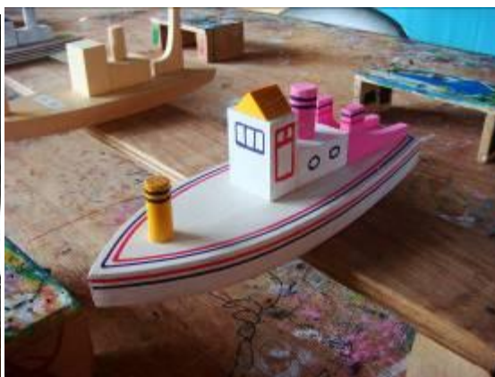
圖 10-5：DIY 活動區