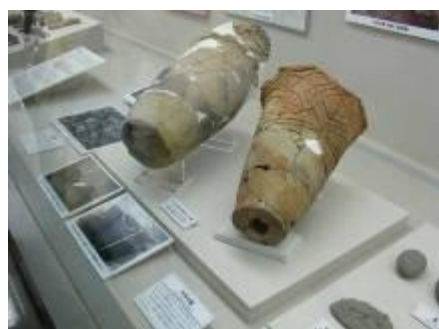
圖 11-8 獨特的遺物，造型之多，讓人歎為觀止