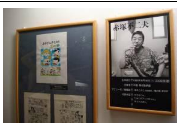
圖 5-9 展場裡的作品都是由矢口先生引介、邀請 100 位日本知名的漫畫家，以無條件、無期限的方式提供館方展出