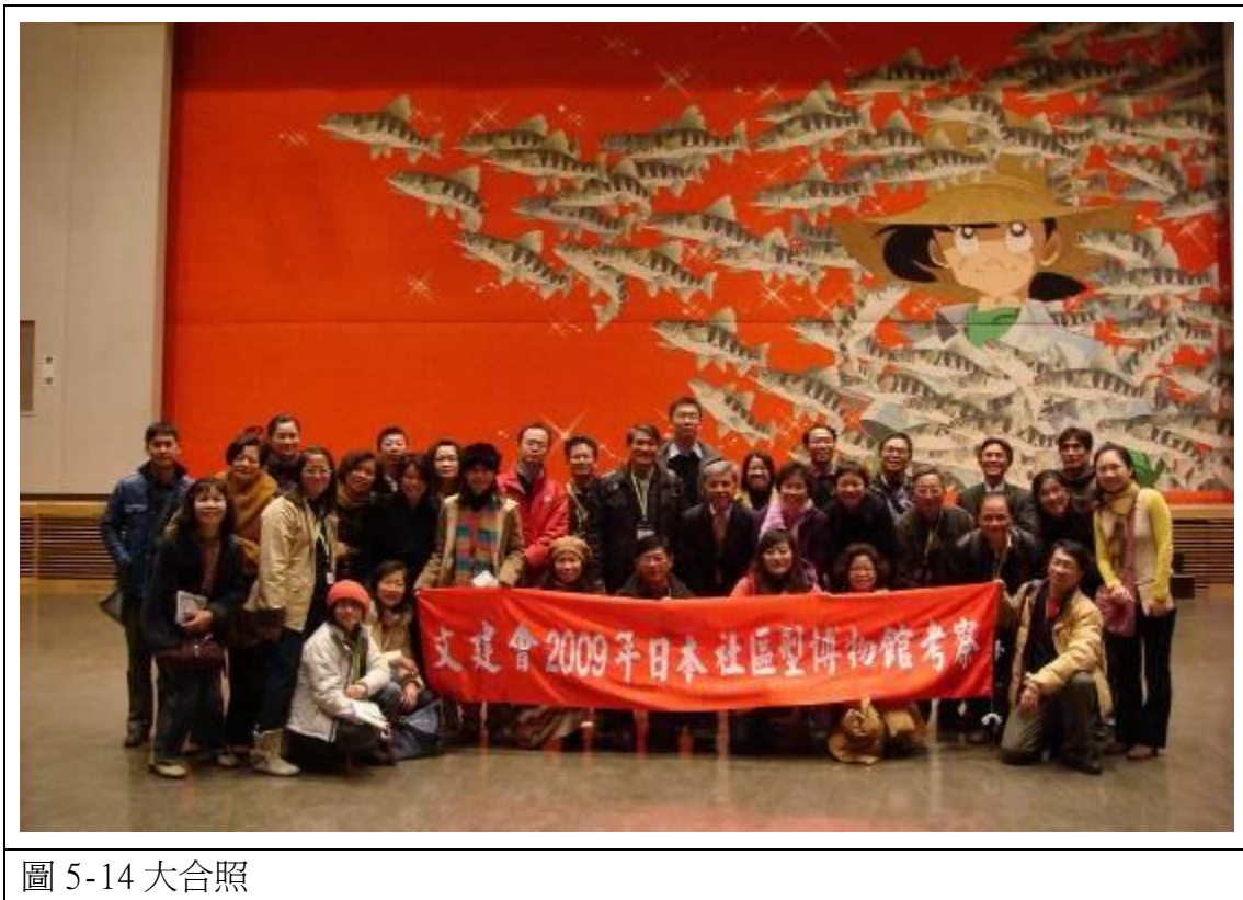
圖 5-14 大合照

爲是公家經營，所以顯得保守，也看不出未來有何大的進展，對地方的發展的助益有限。橫手漫畫美術館可說說是後繼無力，可惜了它「好的開始」，只成功了一半，也就是說，橫手漫畫美術館創造了全國性的知名度，但卻沒有帶動地方的觀光產業。