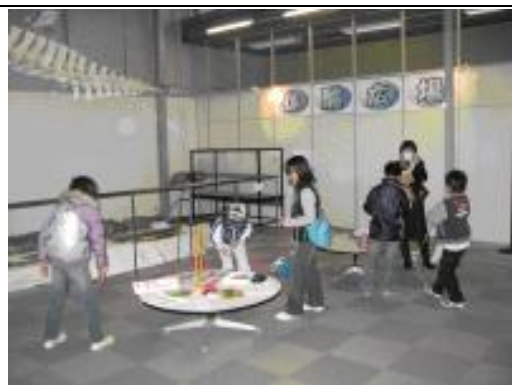
【圖 1-17】山形縣立博物館重視教育工作是兒童學習的重要場域

最重要的是，博物館多元化的經營、募款及行銷，是未來吸引人潮、增加收入的重要方法。如開發特色產品(而不僅只有出版品【圖 1-18】)、賣店的經營、細膩且精緻的特展、吸引人活動、巡迴展等，都是未來地方文化館及博物館必須要面對的課題。