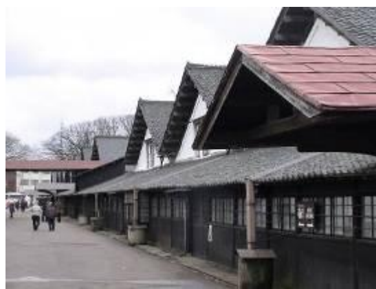
圖 3-3 山居倉庫外觀

米竟可成立博物館？源自庄內米素以品質優良聞名日本，據日方統計目前東北有八成的米來自庄內地區，最有名的品種為「越光米」及「一見鍾情」，阿信則是庄內米最佳代言人，「流傳至今的阿信也喜愛的庄內米的歷史米倉」帶領大家探究庄內米的歷史。資料館入口處外觀以「庄內米長廊」輸出圖引導遊客入內參觀，館內展示陳設首先映入眼簾的是山居倉庫及其貿易的精緻模型，一路帶領遊客從稻作的歷史、品種改良、生產、保管、流通等，還有庄內平野介紹、米俵展示及扛米體驗區、米袋種類介紹、及以真實比例精緻模型重現農家家屋、圍爐裡的風景、千石船模型，最後是老照片展示及小學生種稻比賽展示區，「庄內米歷史資料館」是有形文化財，也是文化資產空間活化再利用之最佳案例。