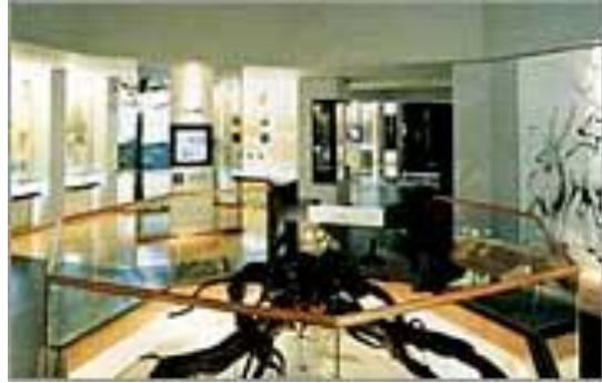
圖 12-8 常設展示：富沢的環境。