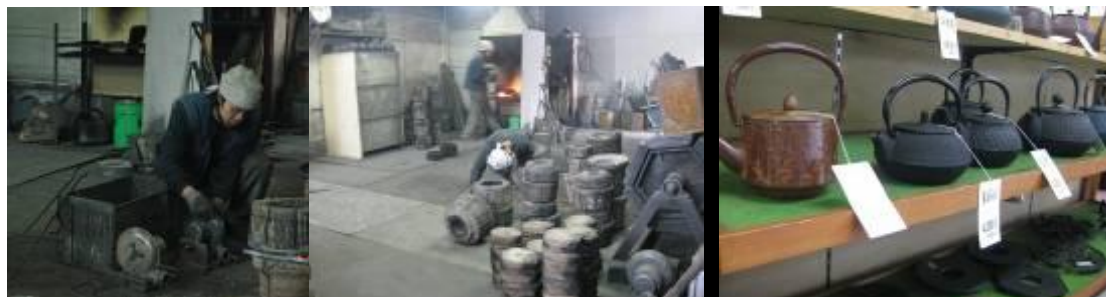
圖 7-2 南部鐵器工房 ：南部鐵器在盛岡手作村裡最為著名，共有五家廠商進駐，所有的鐵器由手工生產，以模鑄及鍛造為主，無法大量生產。原料鐵沙使用當地的鐵礦提煉而成，正因量少質佳，型制多樣，又因其鐵礦質地特殊，加溫或泡茶可釋放鐵離子，許多人不遠千里到這裡購買，現場銷售熱賣。鐵器的工藝品種類繁華，館內可親眼見識師傅細膩的手作功夫，鐵器製作因具危險性、技術性，不提供體驗的課程。