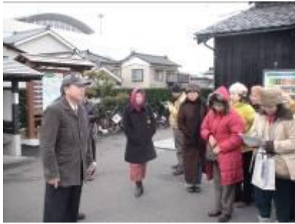
圖 3-4 參訪團員聚精會神聆聽山居倉庫 工作人員解說