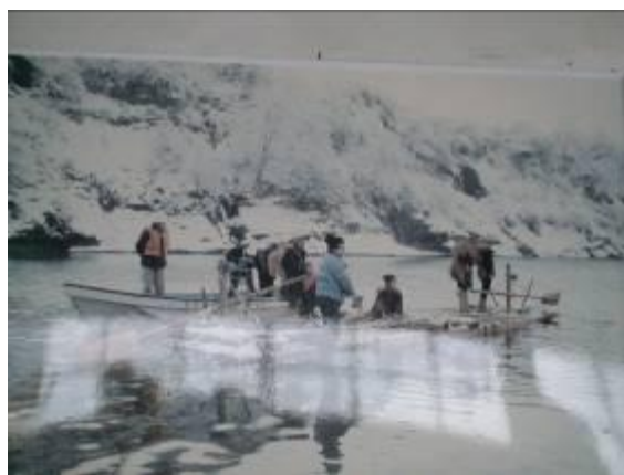
圖 3-1 最上川舟楫便利帶動觀光產業

庄內米素以品質優良聞名日本，目前東北有八成的米來自庄內，但因氣候乾燥冬天更有積雪，以致稻作一年僅一穫，不同於台灣南部 2 穫，中間還穿插種其他經濟作物，其中最有名的品種「越光米」及「一見鍾情」就是庄內米。長達 200 多公里的最上川不僅是國有一級河川，也是孕育山形縣的母親，更因詩人松尾芭蕉加持，當文學遇上觀光，不僅擦撞出燦爛火花，更讓後人無限嚮往。