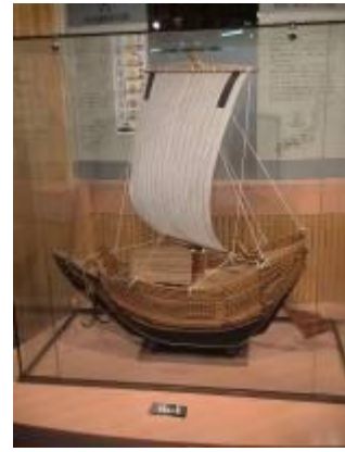
圖 3-17 北前船模樣