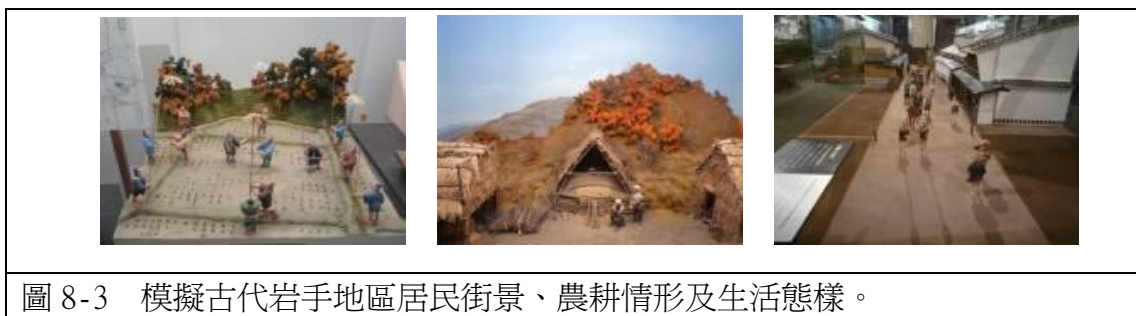
圖 8-3 模擬古代岩手地區居民街景、農耕情形及生活態樣。

近年來由於地球環境保護的意識高漲，所有事物急速的接受國際化並且各項生活型態、自然生態也都在一步一步的被改變中，爲了讓民眾能有生涯學習的概念，博物館將『新的地域文化創造』設立爲目標及使命，努力的強化博物館的各項機能，博物館自開館以來，亦不斷積極的與民眾進行交流且日趨進步，不但提供了自主性學習的場所，也讓民眾可依自身的興趣規劃出生涯的學習活動及對下一個世代做到了教育上的傳承。