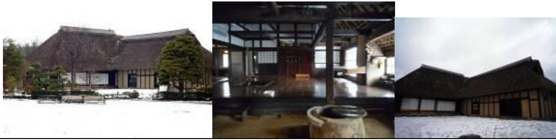
圖 7-12 南部曲家：此為南部轉彎屋，一般來說日本房屋的外觀為一條的型式，這是在這個地方特別的建築形式，外型有個轉彎所以稱作轉彎屋，為人馬共住兩棟結合的建築形式。盛岡在過去農耕社會裡面，馬不僅農耕上需要另外在運輸上更是扮演不可或缺的角色，他們把馬視為是家族的一部分，所以讓馬住在房子裡面，也因為這個地區比較冷，馬也需要一個較溫暖舒適的地方，轉彎屋由此形成。正因為馬在盛岡當地的重要性，也成就了每年六月舉辦的馬的祭典：恰咕恰咕祭典。

品不暈染、不退色特色，成功的行銷作品；另提供藍染 DIY 體驗，可作為台灣發展藍染地區的借鏡。