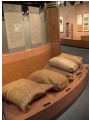
圖 3-7 米袋沿革見證稻 米變遷史