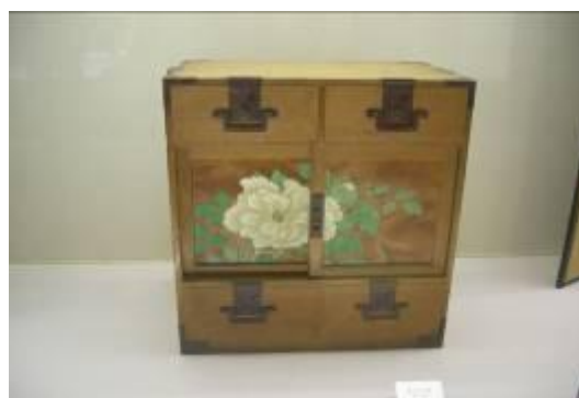
圖 6-6 樺細工精品家具