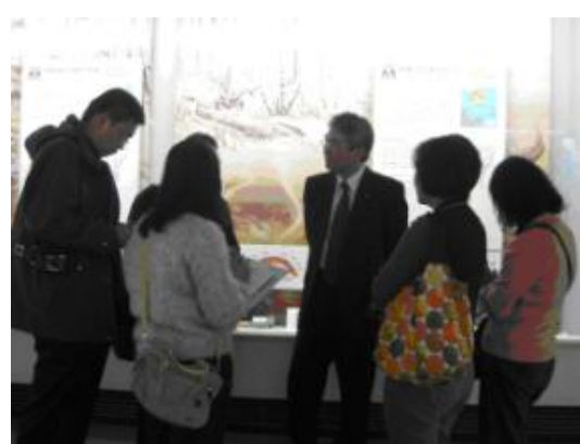
【圖 1-4】本團與與山形縣立博物館人員進行交流與討論