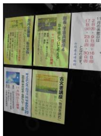
【圖 1-14】博物館辦理各式活動的海報