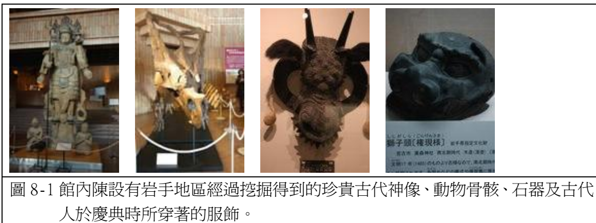
圖 8-1 館內陳設有岩手地區經過挖掘得到的珍貴古代神像、動物骨骸、石器及古代人於慶典時所穿著的服飾。

岩手縣立博物館內展出主要為有關岩手縣自然資源方面的珍貴資料、以及與岩手縣內有歷史淵源的重要文化遺產。博物館內的展示場有 綜合展覽館 (考古、歷史、民俗、地質、生物) 屬於常態性展覽；如氣仙殞石，為 1850 年掉到日本土地上來的最大隕石。從岩手縣出土的各種化石，可以找到恐龍滅絕的證據。如三萬年前石器時代的人使用的工具與製作的陶器、埋葬時的裝飾品與死人骨骸。4500 年前繩文人生活的形態；半穴居與狩獵的生活狀況，以及造型各異的土偶。