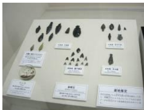
圖 11-7 遺物中發現外地所產的岩石與木頭，推測在這時期已經有商業交易行為。

三內丸山遺址出土遺物種類繁多，如動物遺骸、魚的骨頭、野生穀類、植物的種子與花粉、繩紋土器、石器、木器和土偶等。遺物中發現有北海道、新潟縣、岩手縣等外地所產的岩石、木頭，可能做為貨幣之用，由這些遺物可以推測在這時期跟遠方有商業交易。而這裡也似乎有專門的漆器師傅。另外還有許多獨特的遺物，造型之多，讓人看了歎為觀止，顯見當時的手工藝品製作技巧已臻至相當純熟的地步。三內丸山遺