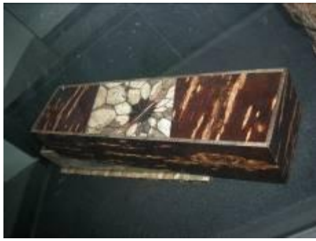
圖 6-7 防潮耐摔可用來當作飾品容器