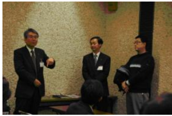
【圖 1-3】山形縣立博物館館長親自接待本團成員

上午 10 點整，參訪團到達位於山形縣霞城公園內的「山形縣立博物」，入內後即由館長、課長和學藝員〔研究員〕進行接待【圖 1-3】，並直接進入常設展室及特展室等進行逐一的介紹與說明，最後再進入會議室進行雙方的交流與討論【圖 1-4】。