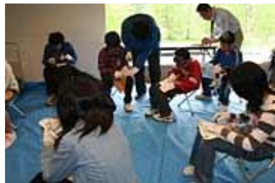
圖 12-10 博物館舉辦「學生利用見學活動」情形