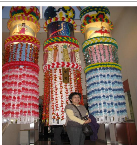
圖13-3 館中展出獲金賞獎的巨大七夕祭裝飾—吹流

回應：日本的博物館法對於各類型博物館採認定制，七夕館已獲仙台市認定，但也是經過非常多的努力。日本的各級政府對私人的博物館幾乎沒有補助，連仙台市博物館或國營的博物館，每年的預算都遭到刪減，要持續經營確實不易。