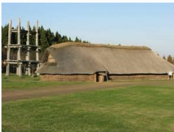
圖 11-4【大型豎穴住居遺跡】