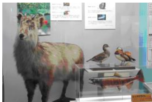
【圖 1-5】第一展示室「豐富的自然恩澤」展區

館內設有三個常設展區，第一展示室以「豐富的自然恩澤」為主題【圖 1-5】，介紹山形縣內東側的奧羽山、流經三分之二山形縣的最上川，以及西側的日本海，介紹縣內森林、植物、昆蟲、野鳥以及對馬海流與大雪對自然環境的影響。館內展出大海牛骨骼【圖 1-6】、縣內南方海岸的大海龜標本、昆蟲、鳥類以及隨著氣候影響而能改變體色的兔子等等，是縣內珍貴的自然教育場所。