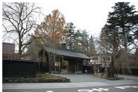
圖 6-4 武家屋敷板土屏間的枝垂櫻