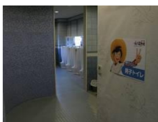
圖 5-10 在男廁與女廁入口地上分別鑲嵌一塊劃有天才小釣手圖案的陶製地磚，加深遊客的參觀印象