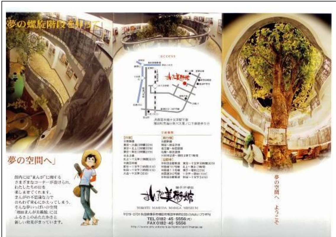
圖 5-2、5-3 增田漫畫美術館摺頁正反面