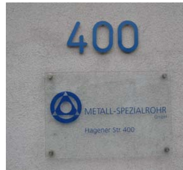
圖一、MSR 公司 營業辦事處 (蘇瓦特)