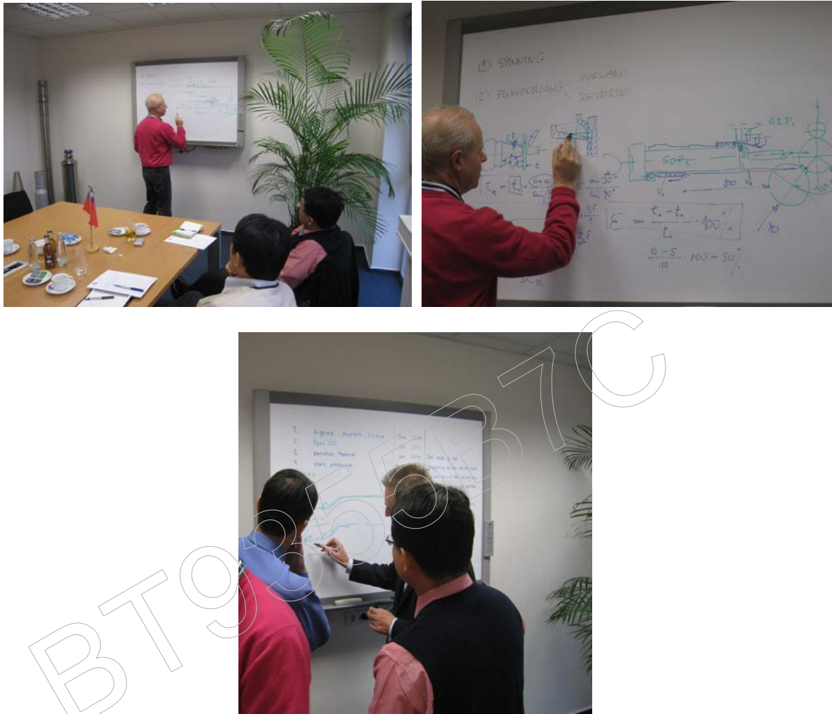
圖四、旋型加工技術研討及說明