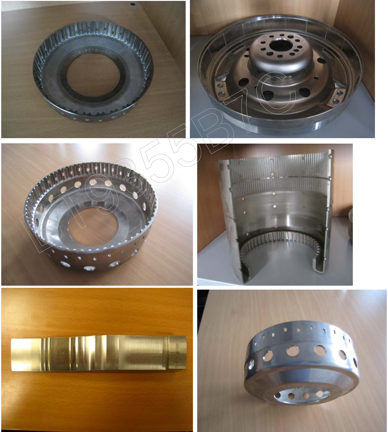
圖五、旋型加工產品