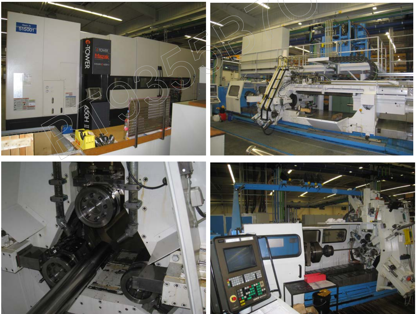
圖二、旋型加工機械設備

其生產線規劃係採二十四小時三班輪班制，每個操作人員同時負責 2~3 台自動化機器，使其人力達到最佳化之運用，