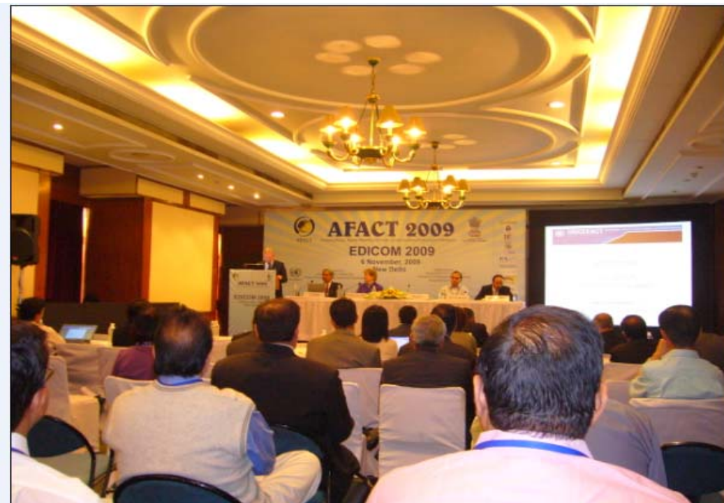
EDICOM 2009 研討會