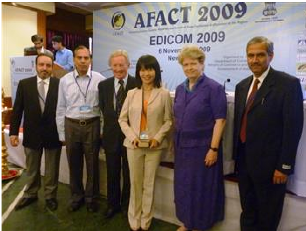
關貿網路史蘭亭經理(左 4) 領取電子商務民間類獎