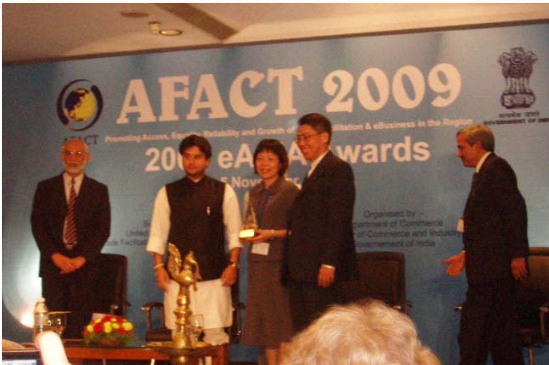
中華台北獲頒 AFACT 特別貢獻獎