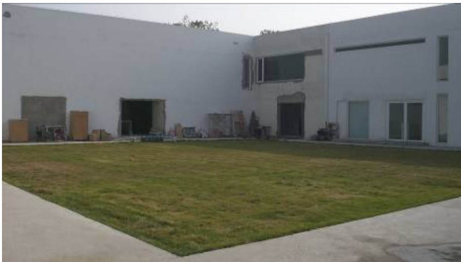
(工廠改建為展場實景，如圖上)