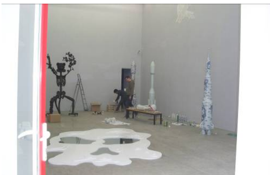
(外籍藝術家佈展景象，如圖上)