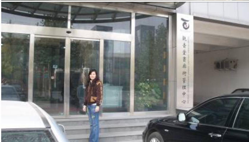
(觀音堂畫廊街管理中心，管理者如圖上)