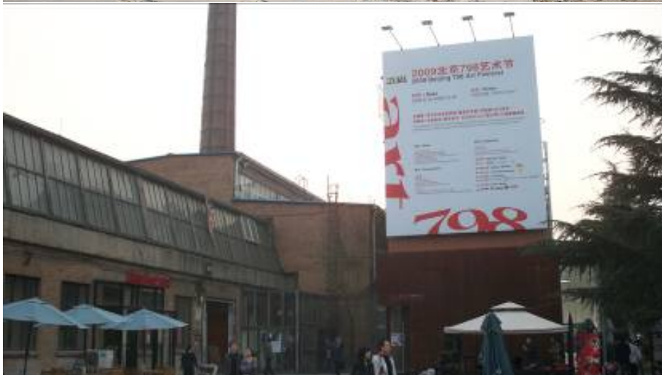
(2009 北京七九八藝術節 (時間於 2009.10.20,地點:北京七九八藝術節特區)於 2009 北京 798 藝術節,主題展“青年藝術家推薦展/雕塑藝術/展同盟展/設計單元”。主辦單位北京文化基金會等,場景側拍圖片如上。)