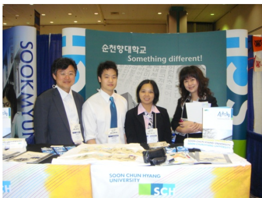
【韓國 Soon Chun Hyang University】