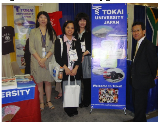
【日本 Tokai University】