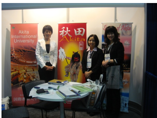
【日本 Akita International University】