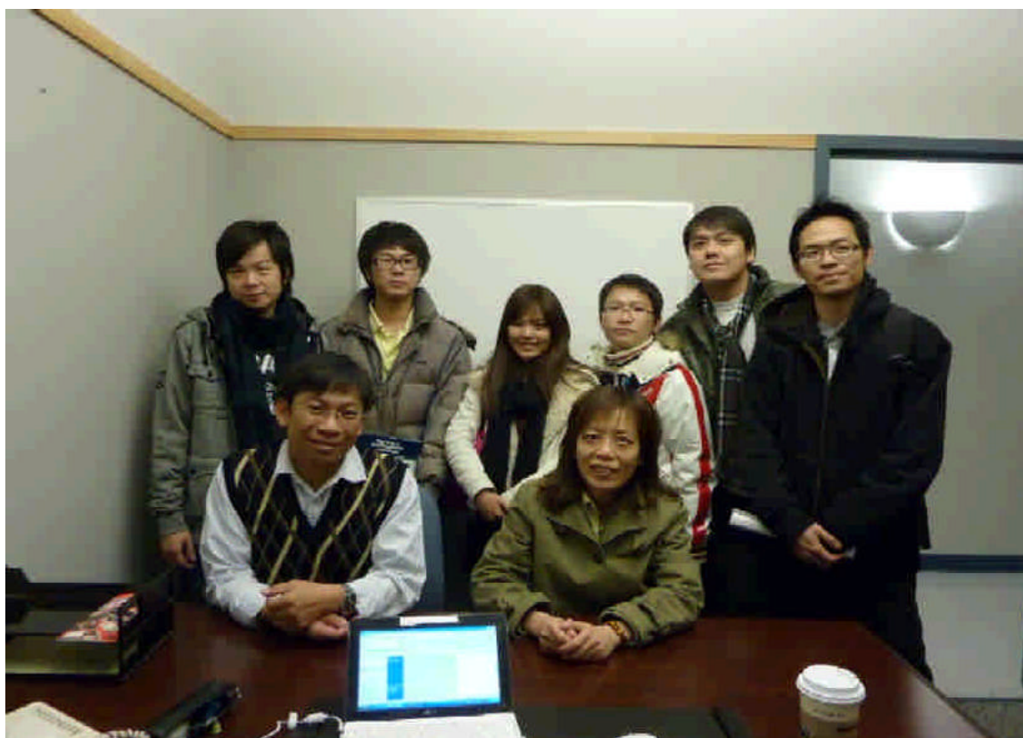
臨行前與在 UWL 修讀學位及訪問的高大

「行萬里路，勝讀萬卷書。」年輕時代若有機會到不同的地方體驗生活及學習，對於一個人的視野及人生觀都有極大的影響，且對於多數人來說，這樣的經驗足以一生受用。本校基於此一理念，近年來積極與世界各國知名校院簽訂不同等級的學術合作協議，截至目前為止已經締結逾四十所姐妹校，也與十餘所大學校院簽訂交換學生或雙聯學制。本校每年選送出國短期進修人數，近年來有逐漸上升的趨勢，雙聯學制的推動雖然開始得比較晚，也已經有三人完成海外雙聯學制，近期內更陸續有數名學生啓程赴加拿大、日本及澳洲等姐妹校修讀雙聯學制。本校為鼓勵學生出國進修，這兩年來不惜斥資提供出國進修學生高額補助，並協助學生向教育部爭取獎助經費。為了能使更多學生有機會出國進修或修讀學位，未來希望能夠藉由與其他姐妹校更密切的互動與溝通，儘量再爭取更多雙聯學制、交換學生或短期交流的機會，讓學生有機會走出校園、走出台灣，在學習力最旺盛的階段，得到最好的磨練和學習機會，以培養更優秀的人才。