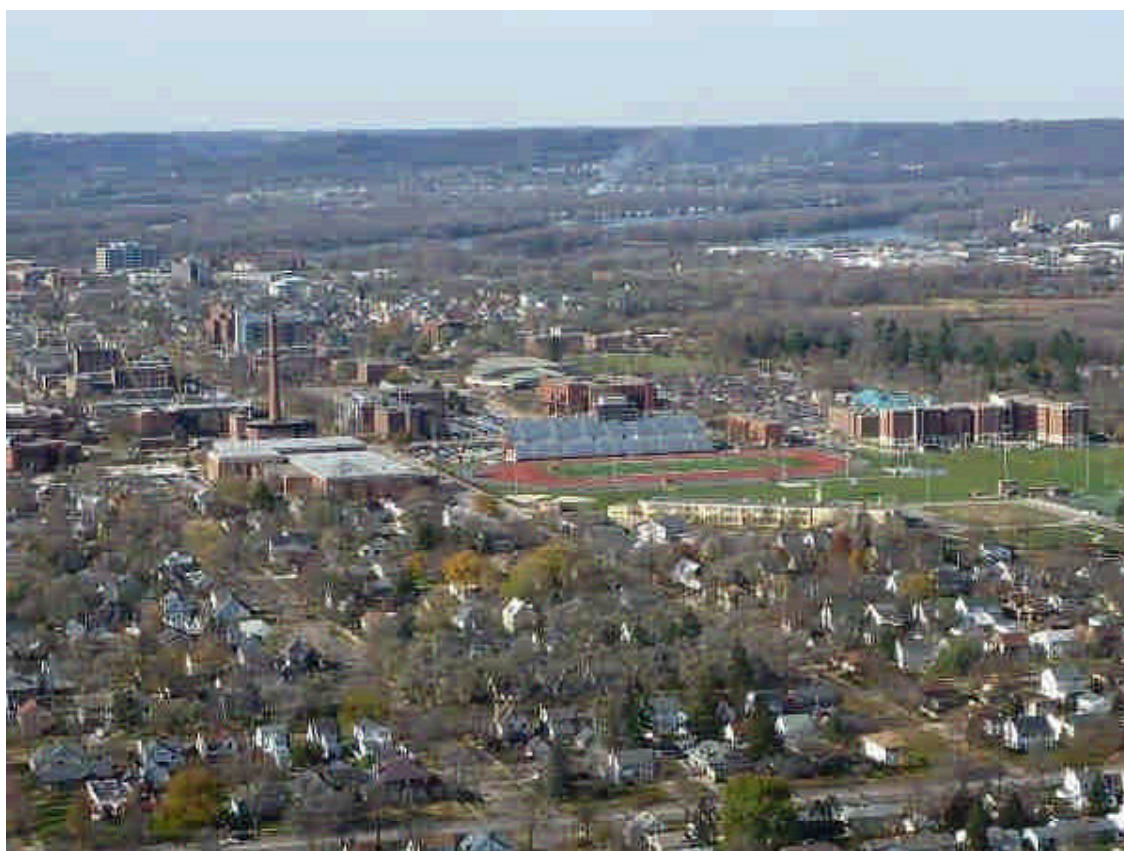
進入校園前於附近高地眺望校園風光

本次考察之行係配合報告人出國參加學術會議之既定行程，配合會議議程，於 98 年 11 月 3 日，由會議地點明尼亞波利市(Minneapolis, MN, USA)搭乘美國 Amtrak 列車前往拉克羅斯市(La Crosse, WI)，並於當日晚間搭乘回程車返回原會議地點。抵達當地前已聯絡該校相關人員，由主要聯絡人員協助往返接送及校內訪問行程安排。參訪期間前往校區參觀校園景致及設施，並與商管學院副院長代替院長(是日正於國外出差中)共同商討推動雙聯學制事宜。