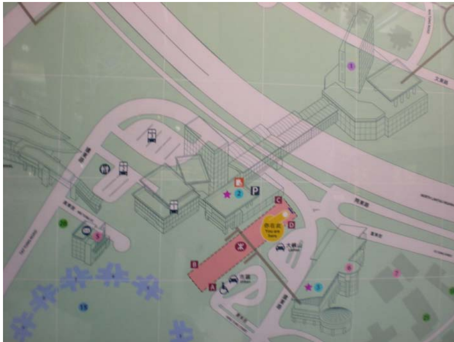
圖 7-3 東涌站位置、連通道及出入口圖

本項發展構成東涌新市鎮的主體部分，整個發展計劃由 5 個地段組成，計住宅、商場、辦公大樓和酒店總面積 1,028,910 平方公尺，並以空中走廊連接，佔地 21.7 公頃，包括(1)32 幢高層大樓和低密度住宅；(2)一幢面積約 15,000 平方公尺的辦公大樓；(3)面積約 56,000 平方公尺的商場用地(包括一個大型購物中心)；(4)一家 440 個房間的酒店；(5)超過 3,800 個停車位；(6)4 所幼稚園合共逾 1,400 平方公尺和一個約 508 平方公尺的市場；(7)廣闊空間和景緻優美的平台。本物業發展包括東堤灣畔、東薈城、酒店、海堤灣畔、藍天海岸及映灣園等。