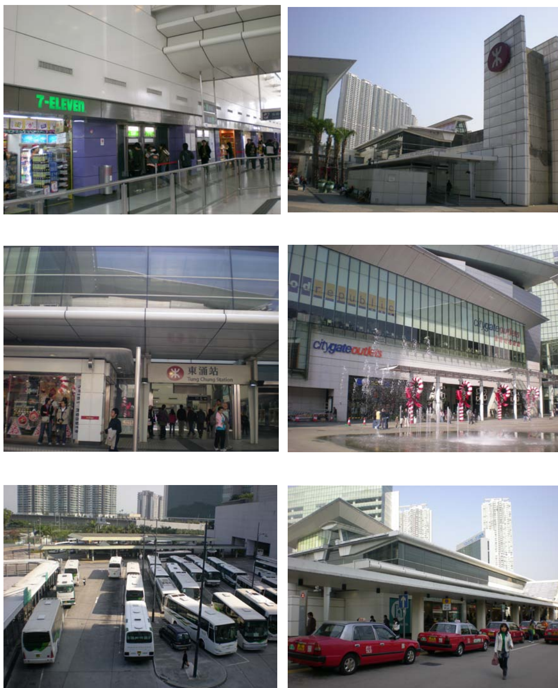
圖 7-2 東涌站內外部環境景觀圖

其中 A 出口通往東堤灣畔（第一至第三幢）、富東商場、中小學等；B 出口通往昂坪 360 東涌站、巴士總站、東堤灣畔（第五至第九幢）等；C 出口通往東薈城名店倉、映灣園、藍天海岸、諾富特東薈城酒店、海堤灣畔等；D 出口通往富東街等（詳圖 7-3）。