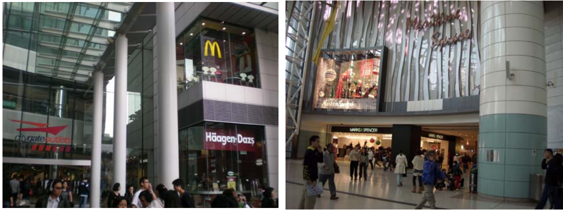
圖 7-5 東薈城建物及外部環境景觀圖（續）