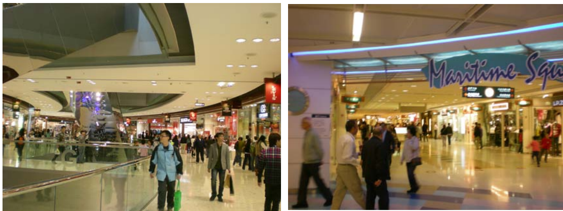
圖 7-6 東薈城內部環境圖