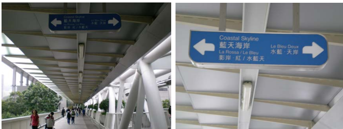
圖 7-7 東薈城外部連通道至物業發展區圖