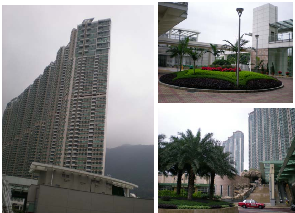
圖 7-10 藍天海岸建物、出入口及外部環境景觀圖

藍天海岸 (Coastal Skyline) 位於香港新界大嶼山東涌海濱路 12 號，是東涌站物業發展項目第二期 (詳圖 7-10)，計分四期發展，包括 7 幢 45-50 層高密度住宅大樓、6 幢 15 層中密度住宅大樓及 41 幢低密度花園洋房組成，共計 3,370 個住宅單元，單位面積約 75 平方公尺，由香港興業國際集團、豐隆實業有限公司、Recosia Pte. Ltd 合組投資興建，並由港鐵公司管理。