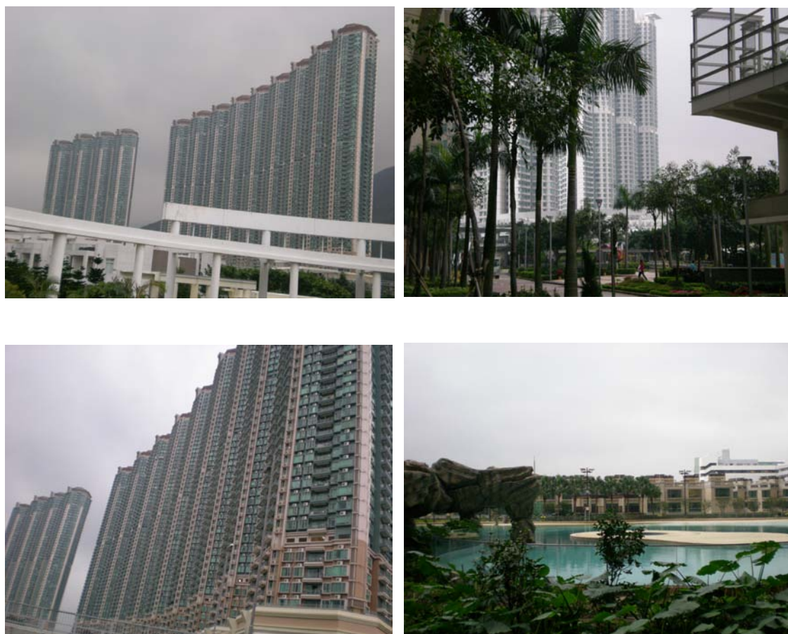
圖 7-11 映灣園建物、出入口及外部環境景觀圖

映灣園 (Caribbean Coast) 位於新界大嶼山東涌，是東涌站物業發展項目第三期 (詳圖 7-11)，共計 13 幢高層大樓與 56 幢低密度住宅，分為 5 期發展，第一期為賞濤軒 (Monterey Cove：第 1 幢至第 5 幢)、第二期為映濤軒 (Albany Cove：第 6 幢至第 8 幢)、第三期為悅濤軒 (Carmal Cove：第 9 幢至第 12 幢)、第四期為聽濤軒 (Crystal Cove：第 15 幢及第 16 幢)、第五期為海珀名邸及商場部分為映灣坊 (Caribbean Bazaar)，共計 5,336 個住宅單位，單位面積約 76 平方公尺，由長江實業(集團)有限公司、和記黃埔有限公司合組投資興建，並由港鐵公司管理。