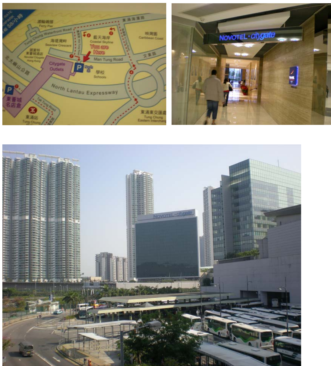
圖 7-8 諾富特東薈城酒店出入口及外部環境景觀圖

諾富特東薈城酒店 (Novotel Citygate Hong Kong) 位於香港新界大嶼山東涌文東路 51 號，樓高 23 層，由雅高酒店集團 (Accor) 管理，為東涌之唯一綜合型的商務休閒酒店 (詳圖 7-8)，可提供 440 間客房，並設有 7 間可容納 12 至 400 人的宴會廳。