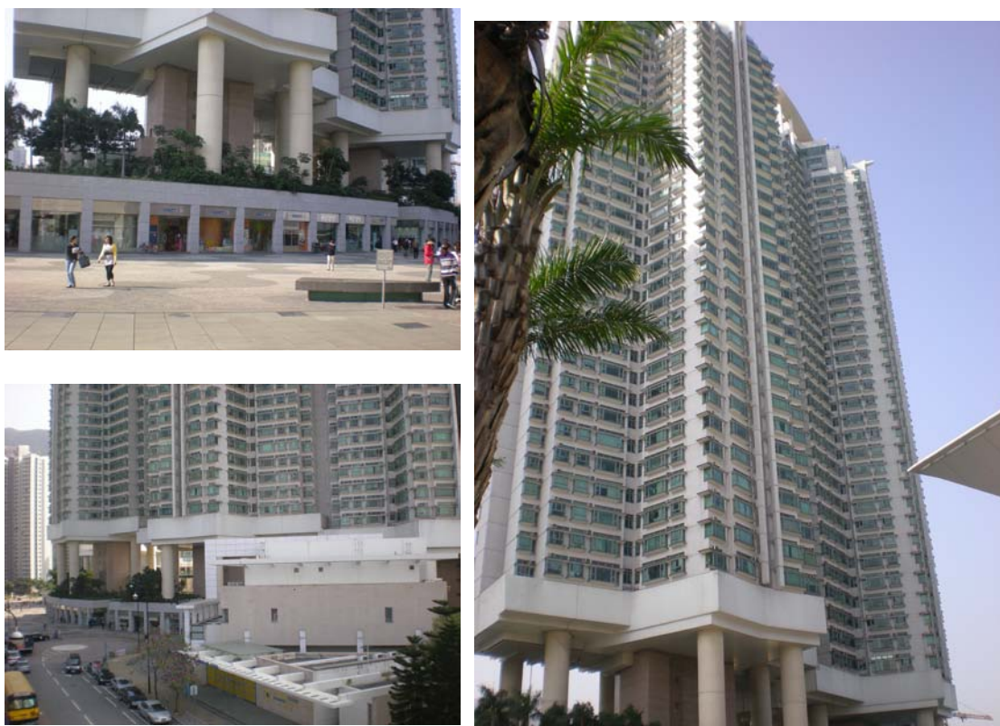
圖 7-4 東堤灣畔建物及外部環境圖

東堤灣畔 (Tung Chung Crescent) 位於香港大嶼山東涌慶東街一號，其為 8 幢住宅大樓和一個會所組成，建於圓形廣場上的平台，共計 2,158 個住宅單元，單位面積約 77 平方公尺 (詳圖 7-4)，由恒隆集團有限公司、恒基兆業地產有限公司、新世界發展有限公司、新鴻基地產發展有限公司、太古地產有限公司合組投資興建，並由港鐵公司管理。該住宅鄰近港鐵東涌站、東涌纜車站、巴士總站、東涌郵政局、露天停車場和大型商場東薈城。