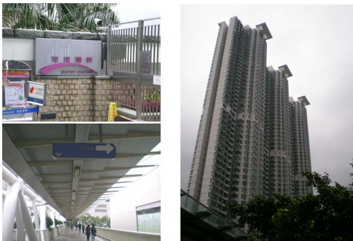
圖 7-9 海堤灣畔建物及出入口圖

海堤灣畔 (Seaview Crescent) 位於香港大嶼山東涌海濱路 8 號，屬於東堤灣畔三期 (詳圖 7-9)，其為 4 幢住宅大樓，共計 1,536 個住宅單位，單位面積約 71 平方公尺，由恒隆集團有限公司、恒基兆業地產有限公司、新世界發展有限公司、新鴻基地產發展有限公司、太古地產有限公司合組投資興建，並由港鐵公司管理。