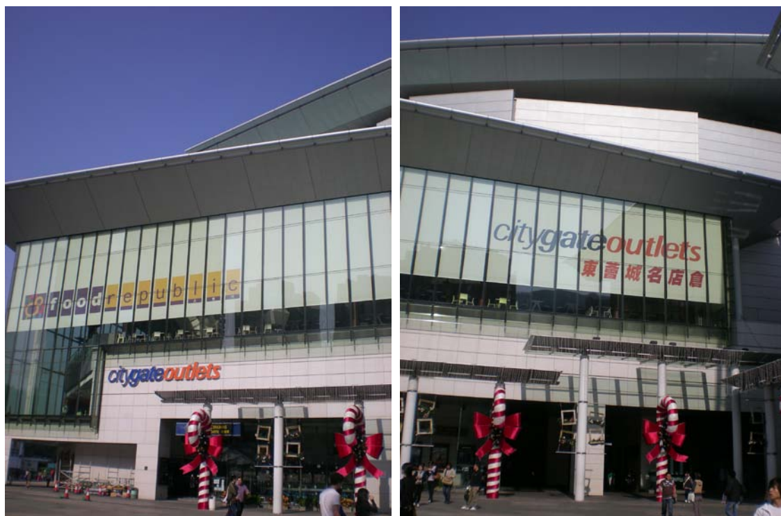
圖 7-5 東薈城建物及外部環境景觀圖

東薈城名店倉位於東涌站上蓋，樓高 5 層，設有一條連接東涌南北兩端、橫跨北大嶼山高速公路的購物橋廊，是全港唯一的 OUTLET MALL，近年來已經吸引了越來越多的國際品牌進駐，將原來分散各處的各品牌的 OUTLET 店匯聚一堂，其聚集效應已經變成巨大的購物新引力 (詳圖 7-6、圖 7-7)。