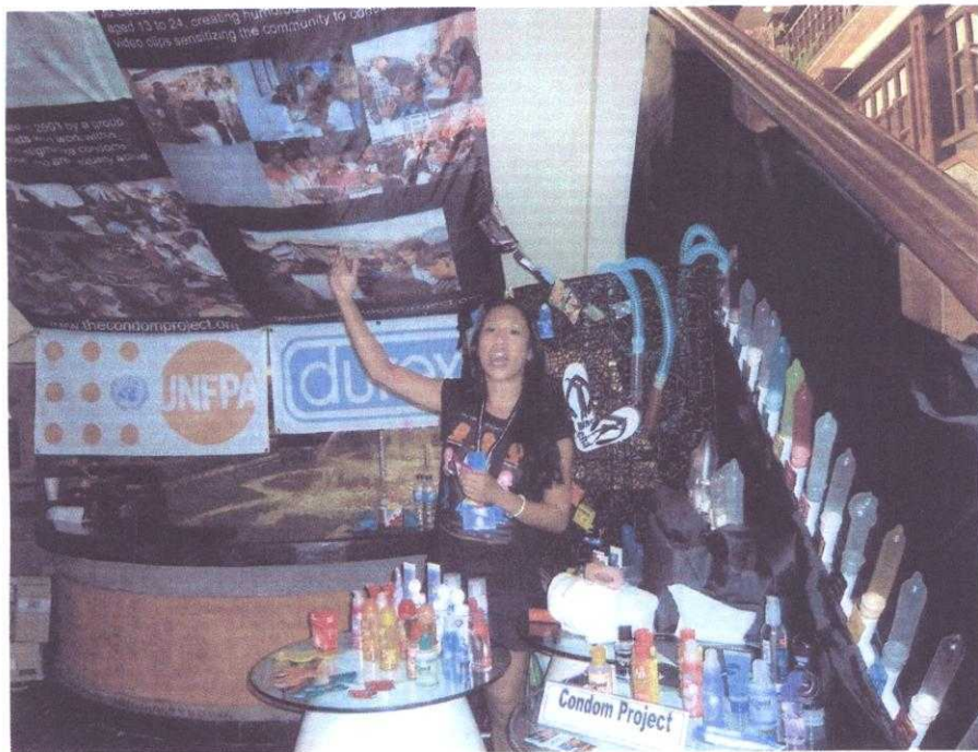
會場有保險套公司設攤介紹各種不同顏色味道之保險套