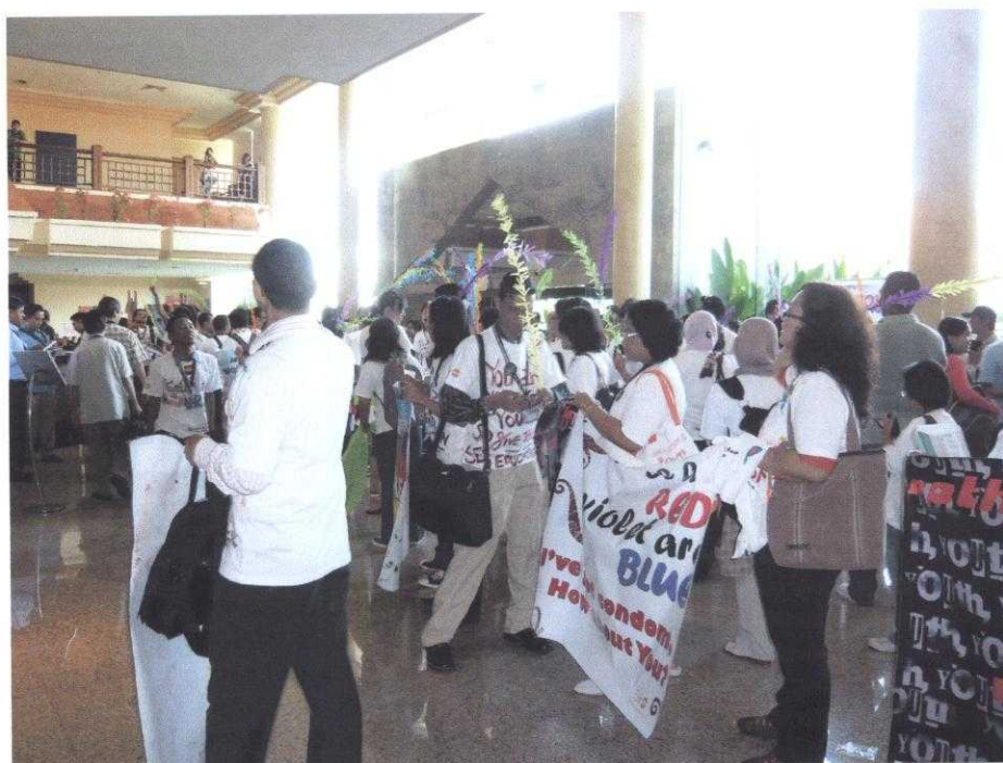
會場中青少年感染者與支持者遊行宣誓自己的權益