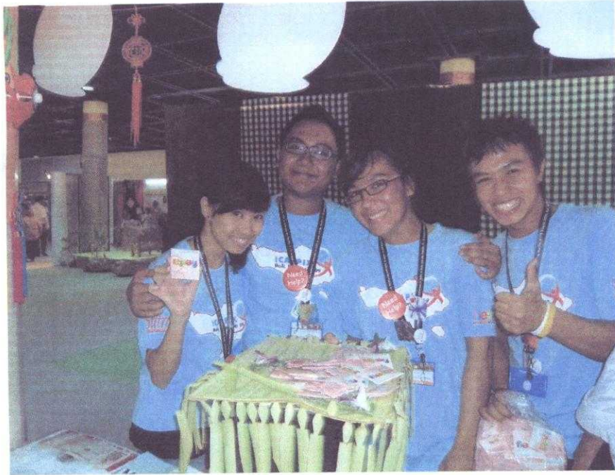
現場有學生志工免費發放贈送保險套