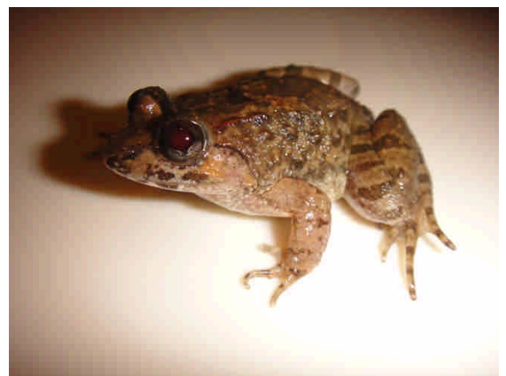
灌口大頭蛙可能是新種

武夷山位於遙遠的閩北，搭火車一趟就將近 12 小時，我們把 10 月 31 日至 11 月 2 日間歸給路程和考察。在前往武夷山之前，抽控到廈門的科技館看一下。廈門科技館是一個很新穎的科學博物館，頗具規模，但展示內容和其他科技館比起來無特殊之處，所以瀏覽一下就離開，倒是隔壁有一個大展示中心，正在進行海峽兩岸的商展，熱鬧滾滾，貨品精良，可以看到大陸的進步在那裡。然而，台灣的品质還是更勝一籌。看了歷史博物館之後，回到廈大為赴武夷山