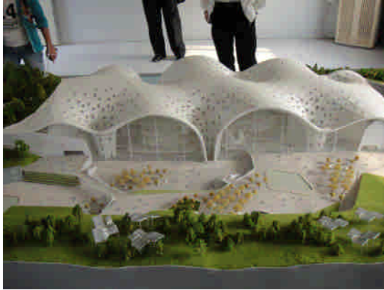
新余自然科學博物館模型。周文豪攝