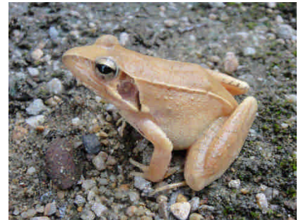
左圖：考察人員在鎮海棘蝮保護區前留影。中圖：鎮海考察之疑似滑蜥。右圖：鎮海林蛙 Rana zhenhaiensis 的真面目。

晚上請了劉老師和浙江自然博物館的同仁吃晚飯，飯後一行人浩浩蕩蕩的出發，幾盞手電在山溝、水塘、山徑上尋尋覓覓，果然考察得本次的目標物種“鎮海林蛙 Rana zhenhaiensis ”。之前，當地蛙癡不信此時有鎮海林蛙，如今大腹便便的雌蛙也都出來了，他們終於相信我的話不假。我們在這一帶的山溝搜尋，也找到了中華大蟾蜍“ Bufo gargarizans ”，花色真的與台灣的盤谷蟾蜍不同，可是DNA的分化卻是有限。另外，我們也獲得澤蛙 Limnonectes limnocharis 、拉都希氏蛙 Sylvirana latouchii 和棘胸蛙 Paa spinosa 。奇怪的是，此地的拉都希氏蛙很少在靜水邊出現，大都在枯水階段的溪流環境獲得，而且體型很小；另外，棘胸蛙的形態略為可疑，