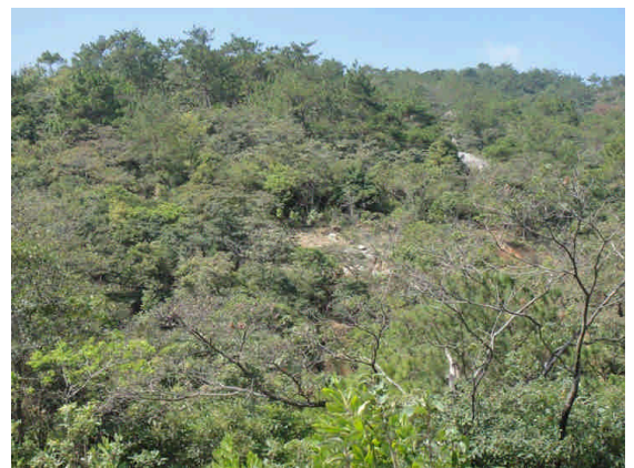
灌口山區地形陡峭，次生林恢復得並不好