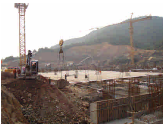
新余自然科學博物館工地。