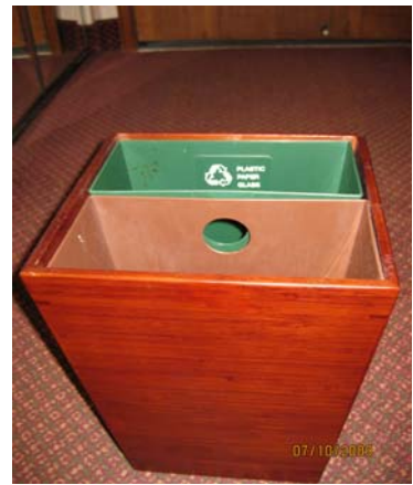
飯店每個房間皆有紙類回收桶

由旅宿業來推動生活環保，讓住宿民眾於休閒旅遊之餘，亦能為地球盡一份心力，並推動旅宿業與周邊社區結合為夥伴關係，共同帶動社區環境改造及產業發展，以營造出「清潔、舒適的生活環境」，達成循環共生，永續家園的目標。