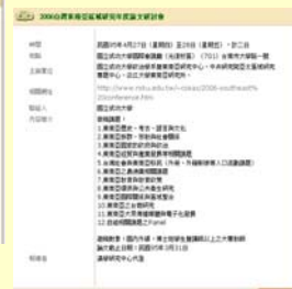
學術活動詳細內容 12