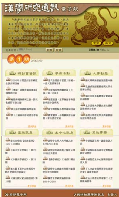
95年元月第一期「漢學研究通訊電子報」首頁