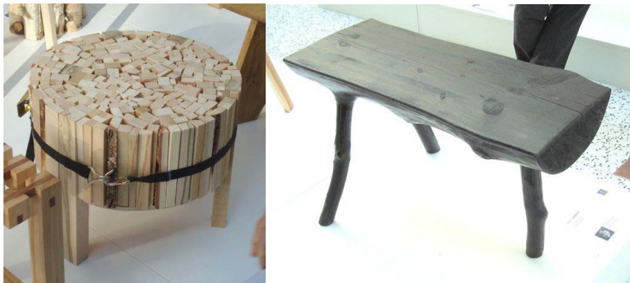
圖十五 其他設計師參展作品