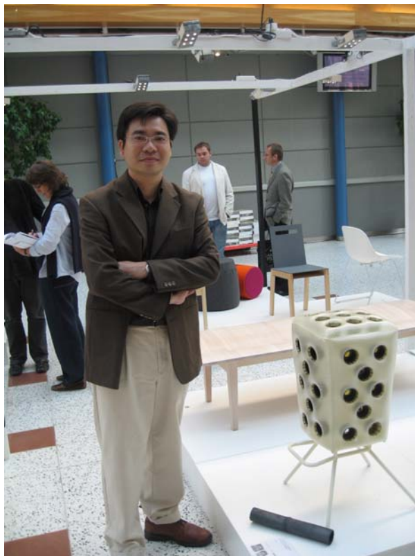
圖七 筆者與參展之作品-Proes 合影