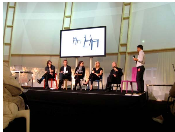
圖五 展覽之研討會