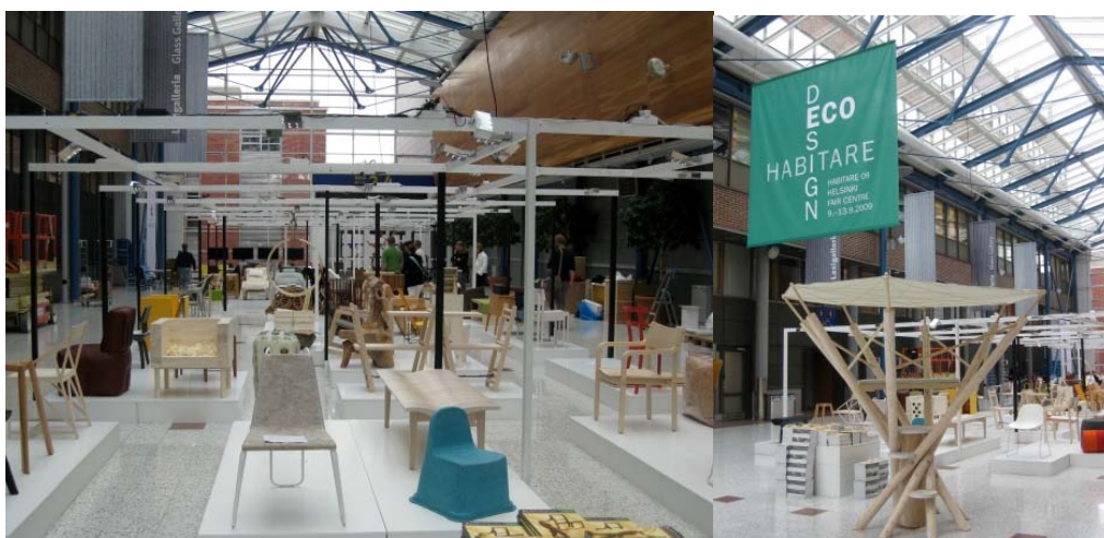
圖二 展覽場地規劃