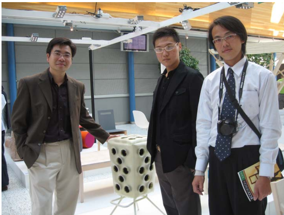
圖八 參展設計團隊與作品-Proes 合影