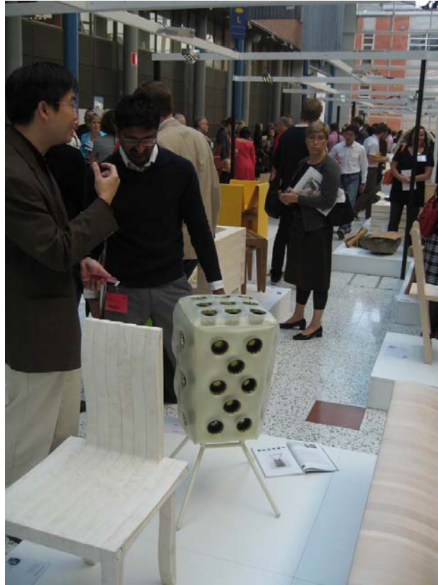
圖十二 展覽會場一隅