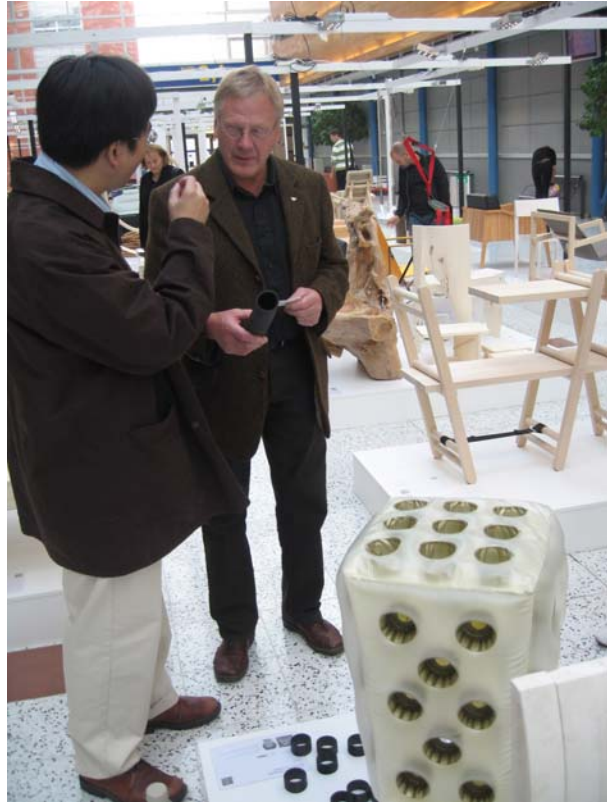
圖十 筆者對芬蘭設計師進行作品-Proes 解說