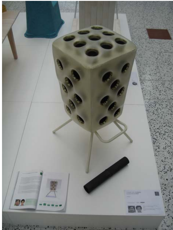
圖六 筆者參展之作品-Proes