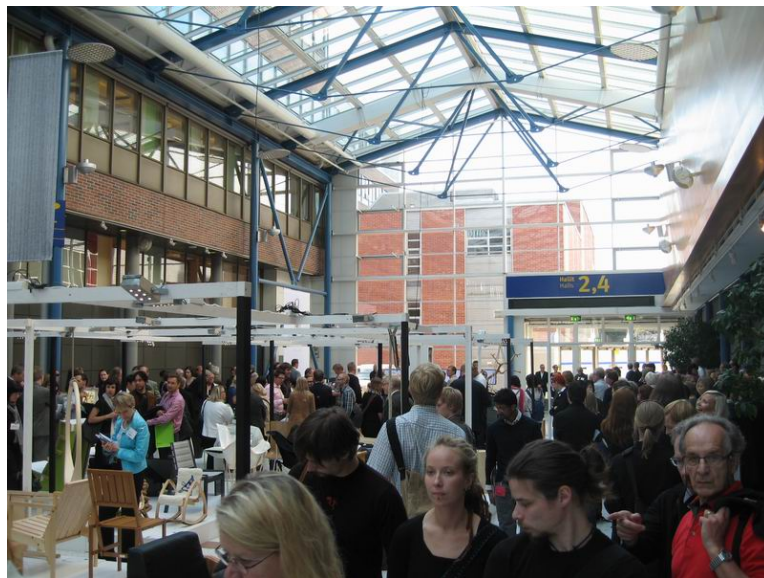
圖十一 展覽會場一隅