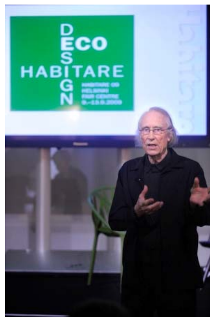
圖四 展覽策展人國際知名設計大師Yrjö Kukkapuro