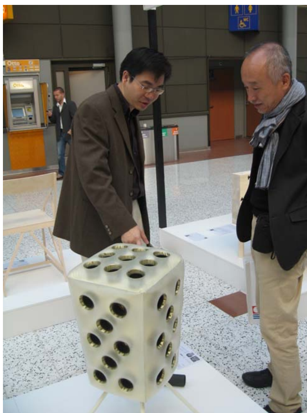
圖九 筆者對日本設計師進行作品-Proes 解說