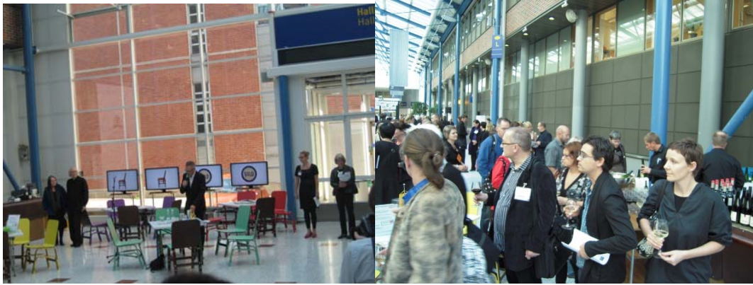
圖三 展覽開幕酒會