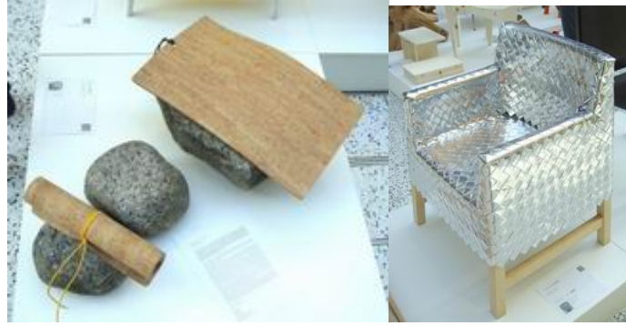
圖十四 其他設計師參展作品