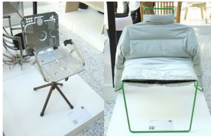
圖十三 其他設計師參展作品