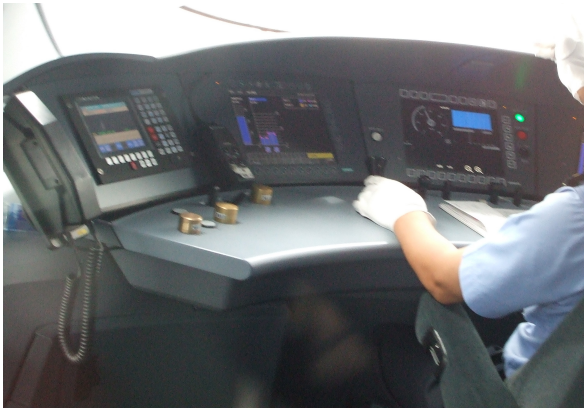
圖 9：動車組駕駛室內之 GSM-R 無線電、ATP 及 LKJ 車上台整合配置情形