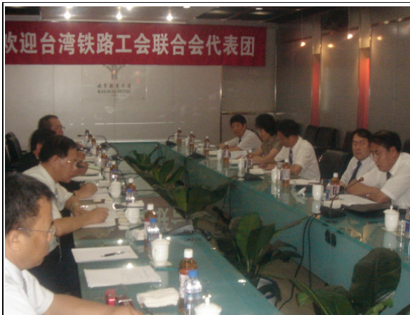
圖 15：中華全國鐵路總工會座談會