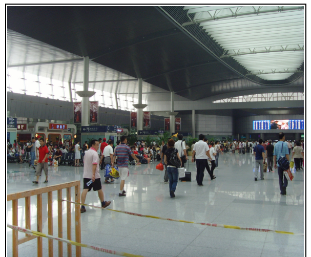
圖 12：天津站內寬敞之候車大廳