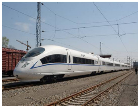
圖 7：和諧號 CRH3 型動車組