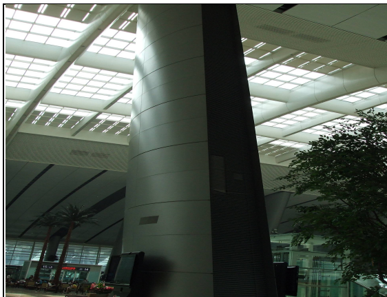
圖 3：屋頂自然採光、空調出氣孔與樑柱完美結合