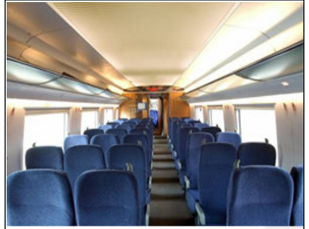
圖 8：和諧號 CRH3 型動車組客室