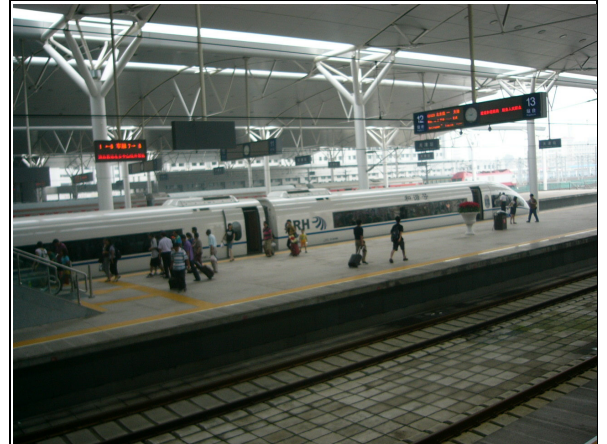
圖 14：天津站月台旅客搭乘動車組情形