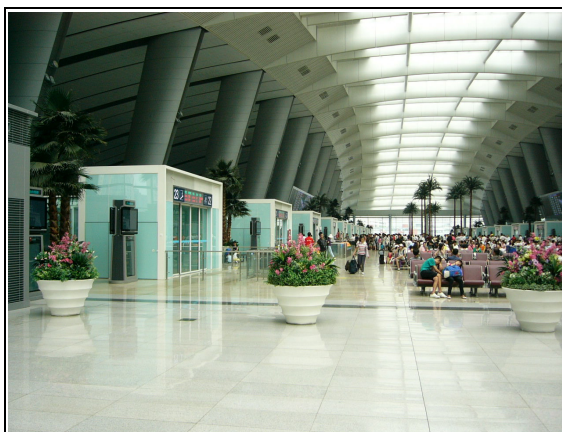
圖 5：北京南站寬敞、明亮、創意景觀大廳