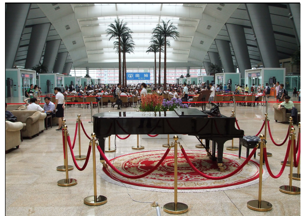
圖 4：北京南站寬敞、明亮、創意景觀大廳