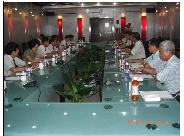
圖 16：中華全國鐵路總工會座談會