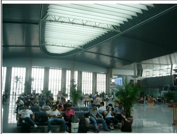
圖 13：天津站內旅客候車大廳情形