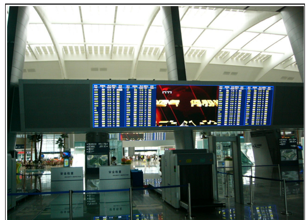
圖 6：北京南站寬敞、明亮、創意景觀大廳