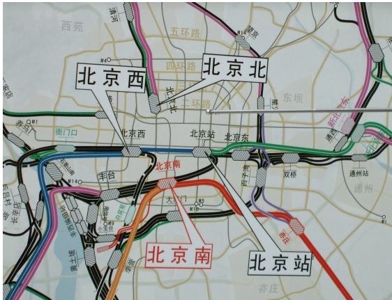
圖 1：北京之 4 個車站配置