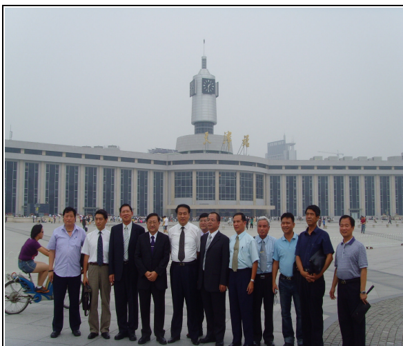
圖 11：天津站外寬大、創意特色廣場