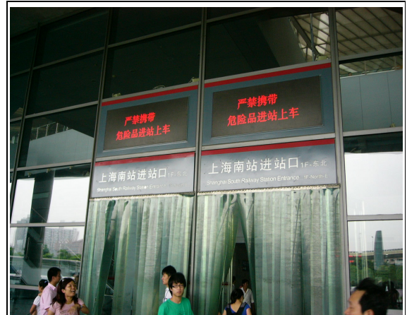
圖 62：上海南站旅客進站檢查