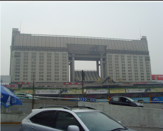
圖 51：杭州站站體外觀