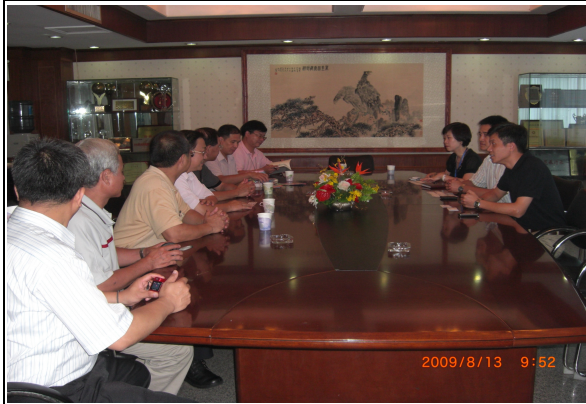
圖 55 與杭州中國旅行社會談，宣導臺鐵鐵道之旅。