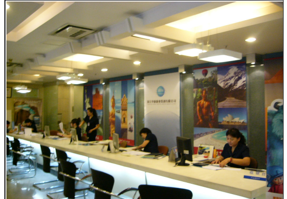
圖 56 杭州中國旅行社。