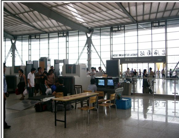
圖 63：上海南站旅客進站安檢情形