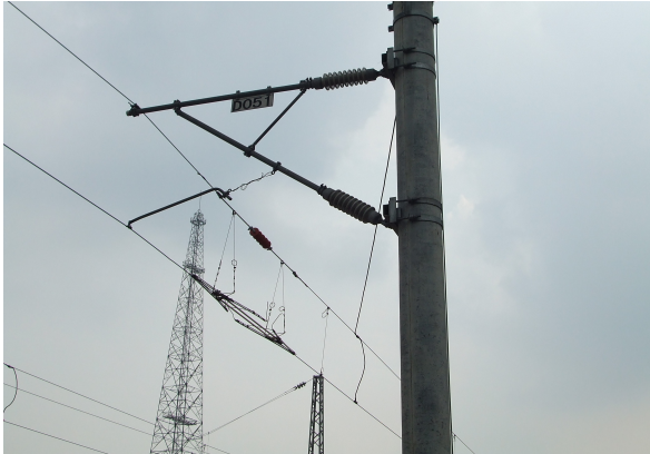
圖 67：上海鐵路局電車線採用之區分絕緣器