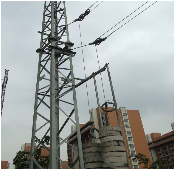
圖 69：電車線主吊線與接觸線分離之平衡錘組