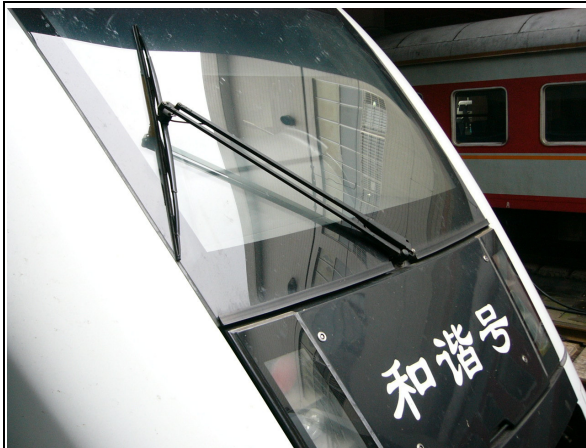
圖 57：滬杭線動車組和諧號駕駛室外觀。