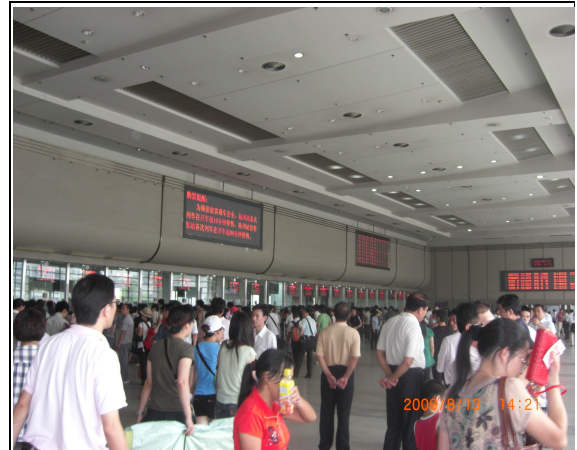
圖 52：杭州站售票大廳旅客購票情形