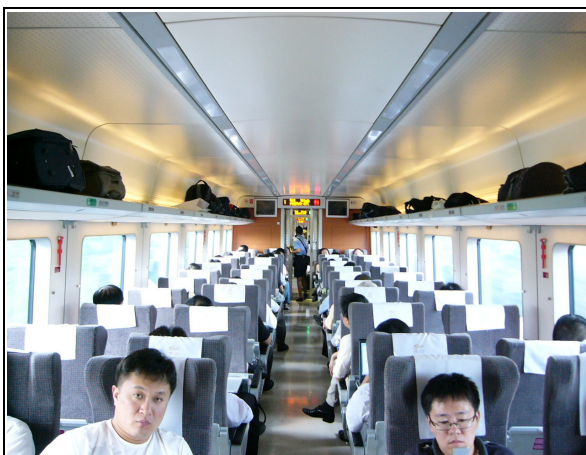
圖 59：滬杭線動車組車廂客室。