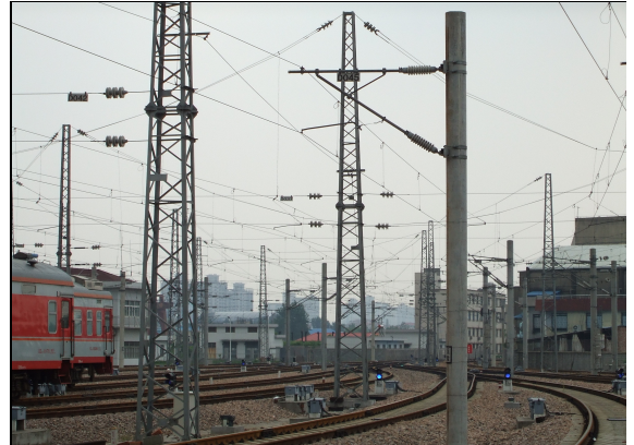
圖 68：中國大陸電車線之懸臂組