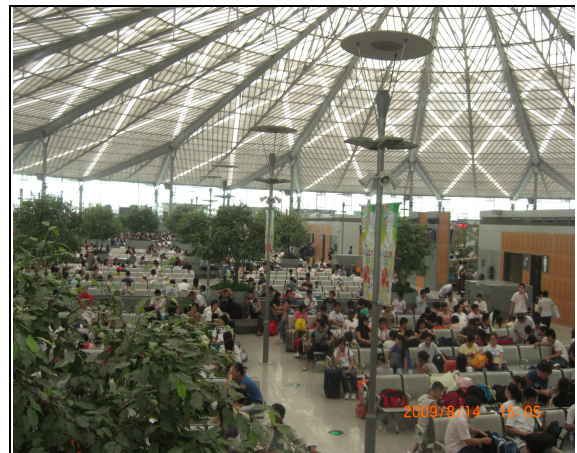
圖 66：上海南站候車大廳旅客候車情形