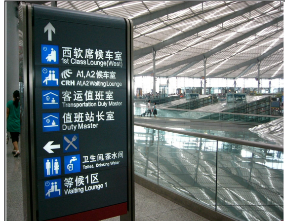
圖 64：上海南站旅客嚮導標誌