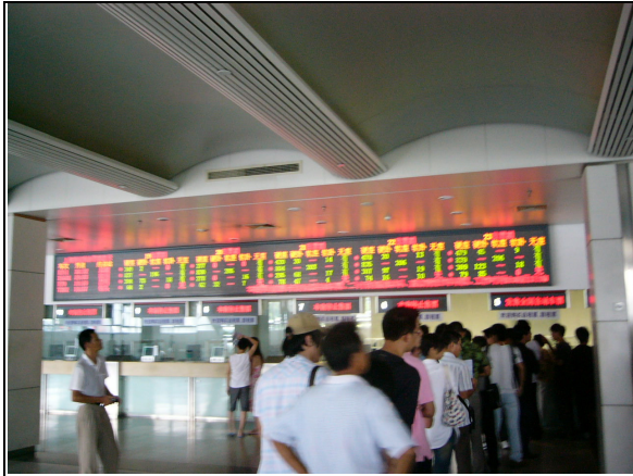
圖 61：上海南站旅客售票處