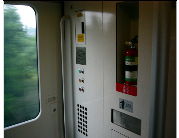
圖 58：滬杭線動車組車廂出入臺門設施。