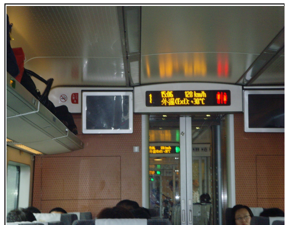
圖 60：滬杭線行駛之車廂時速最高 180 公里。