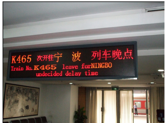
圖 54：杭州車站旅客資訊告示屏顯示列車晚點