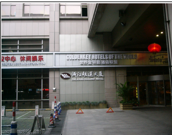
圖 53：杭州站一樓為售票處上樓為鐵道大廈供營業使用