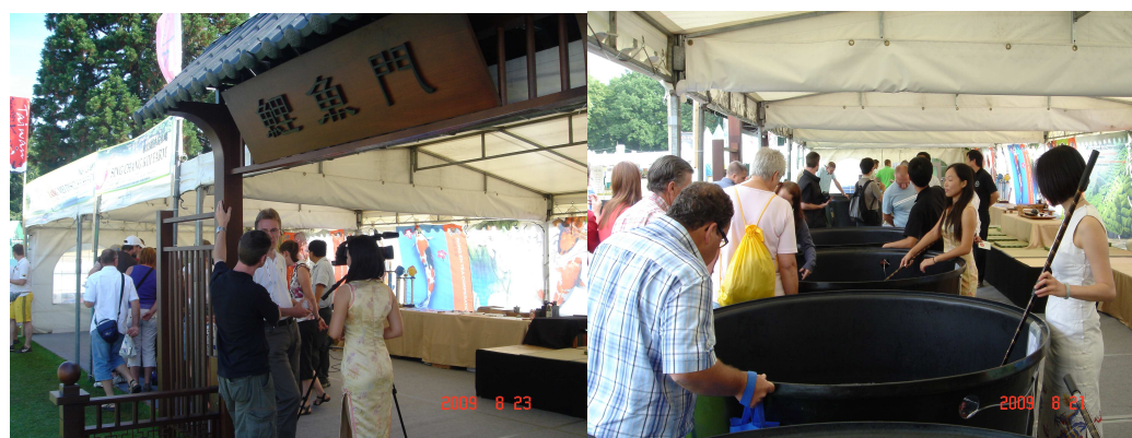
台灣館之參展攤位實景，入口處為「鯉魚門」