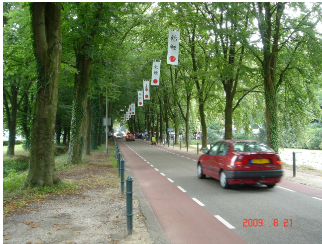
會場周邊道路皆懸掛日本風味之錦鯉旗幟