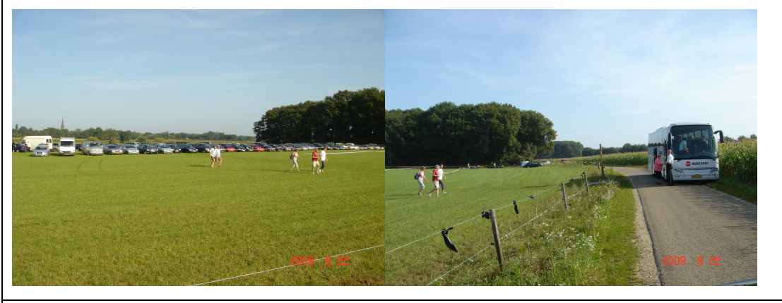
展期第二天，原停車場已不敷使用，另闢停車場並備接駁車接送