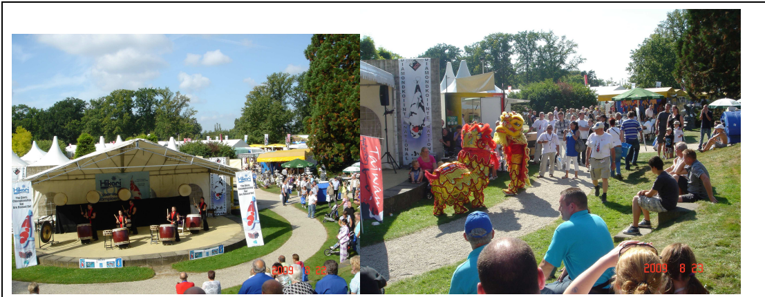
安排東方文化之太鼓及舞獅表演，吸引遊客參觀