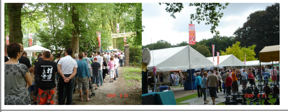
第一天(星期五)入場之排隊及參觀人潮眾多(第二、三天週末人潮更擁擠)