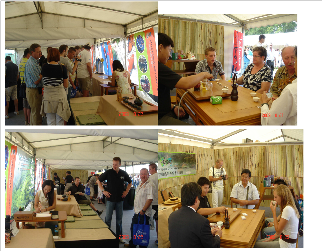
台灣館裝飾以東方風情為主，參觀者多有好奇飲茶及書法文化者