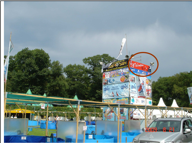
競賽錦鯉池共約 70 組，上方廣告招牌其右上角紅色者為台灣錦鯉廣告