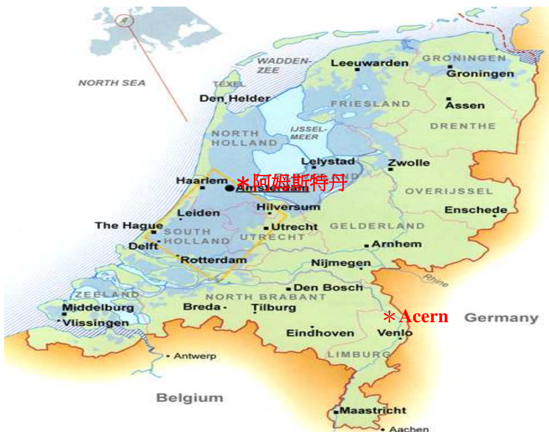
圖一、荷蘭錦鯉展所在地 Arcen 地理位置

Castle 經營，全面積約 60 公頃，具備眾多休閒設施，自城堡建築、河流景觀、各式庭園、溫室、兒童遊戲場、動物園、餐廳、酒吧皆有，可滿足不同年齡層及愛好者之休閒需求。