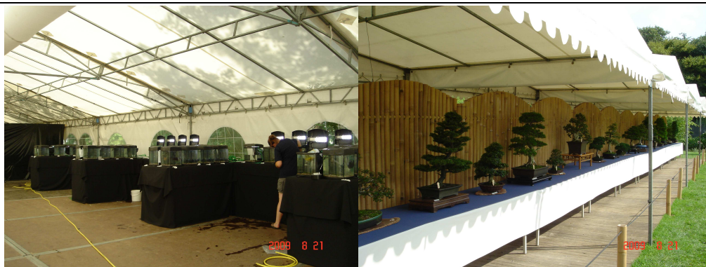
水晶蝦及盆栽秀現場，皆為小規模搭配主展