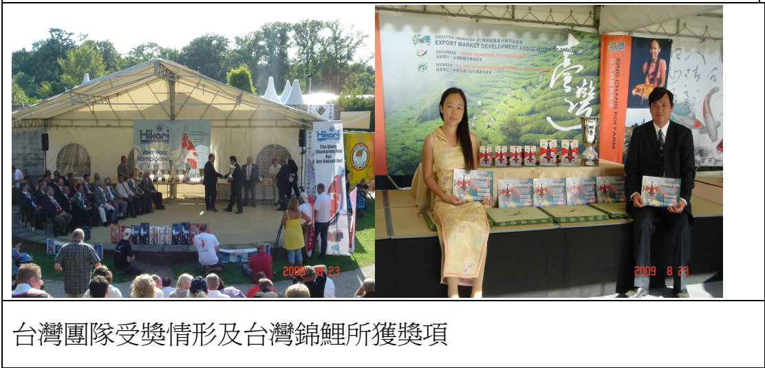
台灣團隊受獎情形及台灣錦鯉所獲獎項