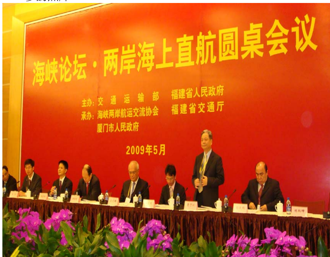
海峽論壇-兩岸海上直航圓桌會議與談