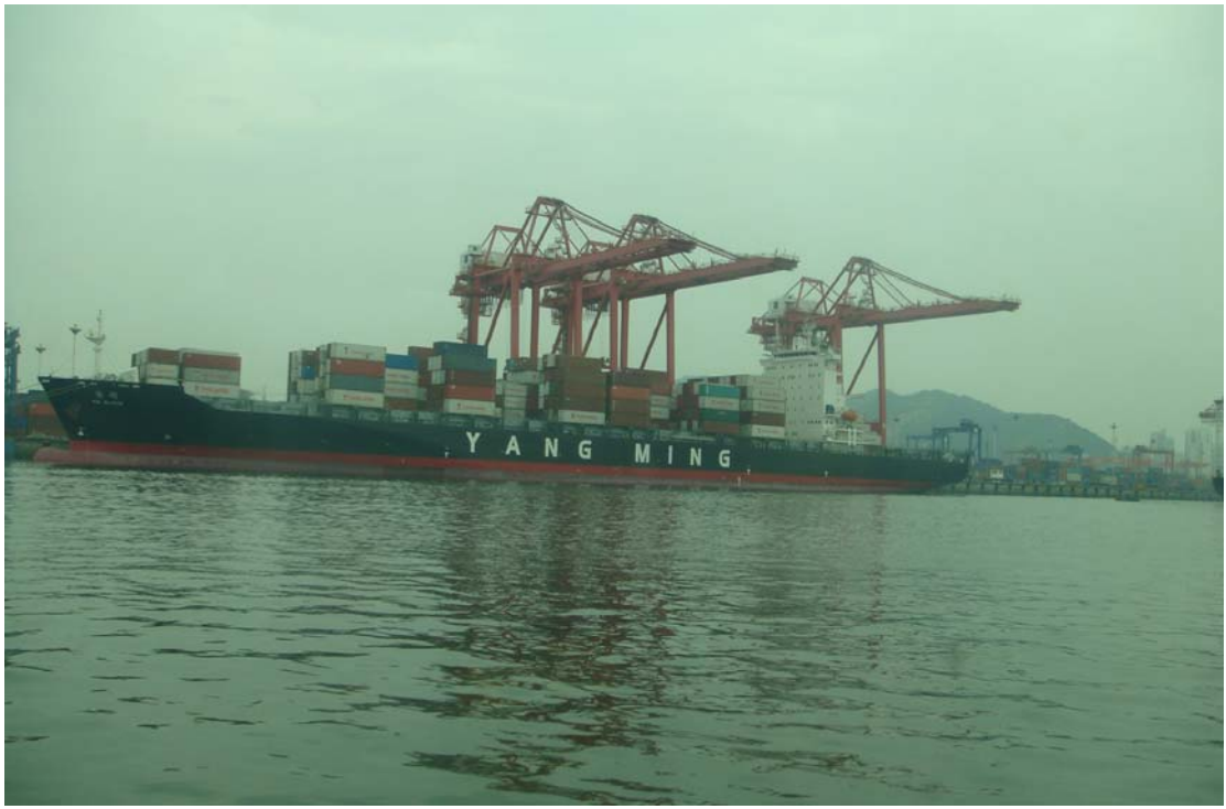
廈門港深水貨櫃碼頭-陽明公司貨櫃船作業