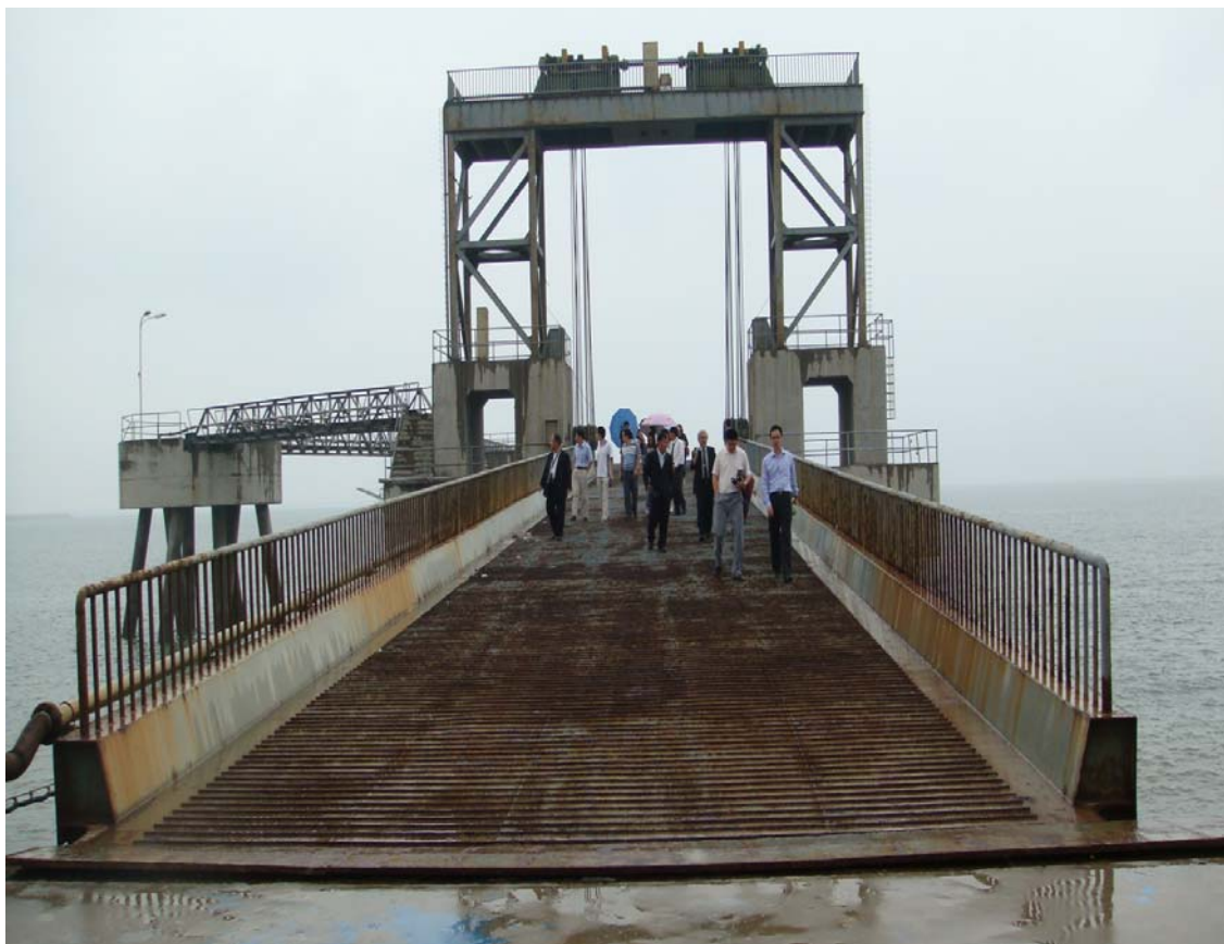
興建中福州新港客貨運碼頭