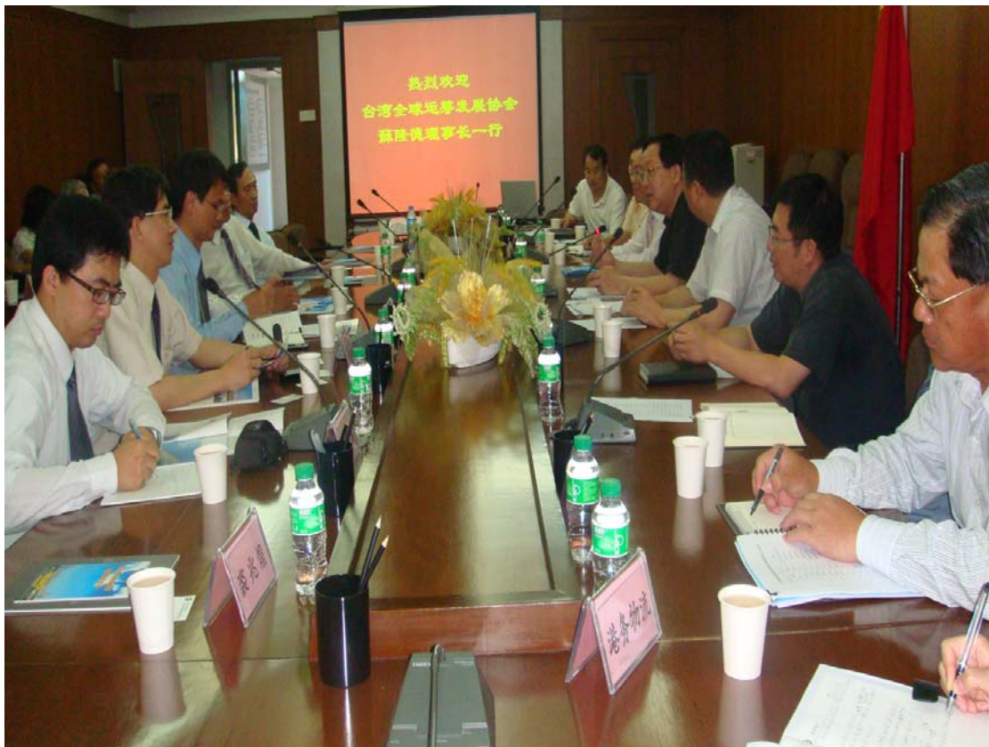
廈門保稅港意見交流