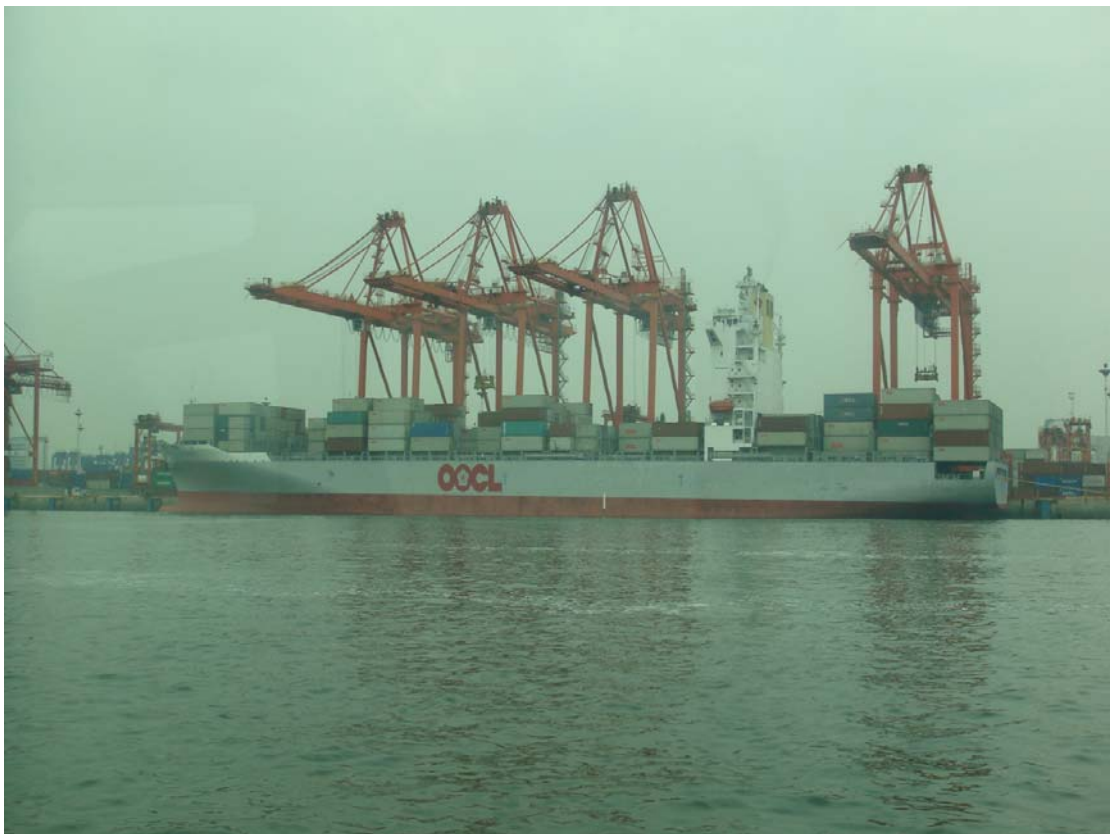
廈門港深水貨櫃碼頭-東方海外公司貨櫃船作業