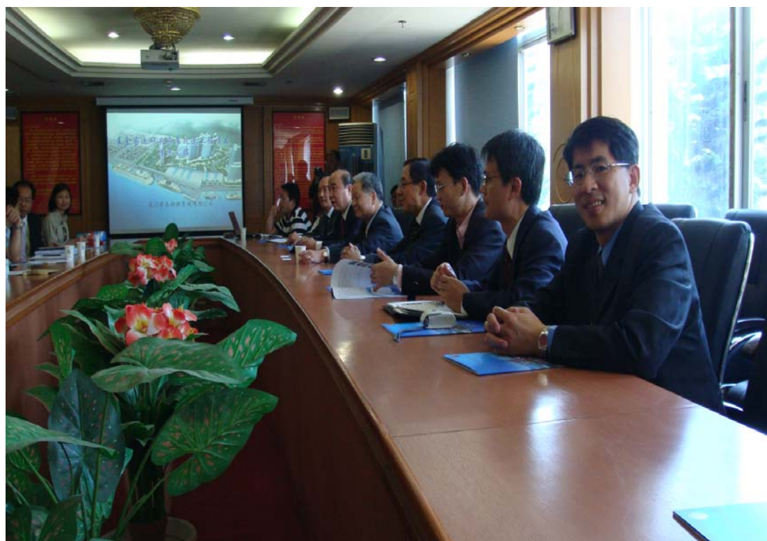
廈門港口管理局意見交流