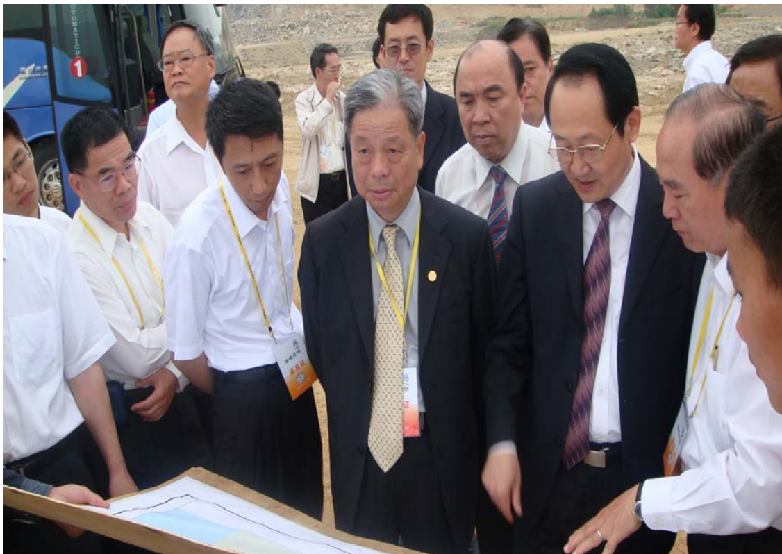
實地參訪漳州開發區聽取建設簡報