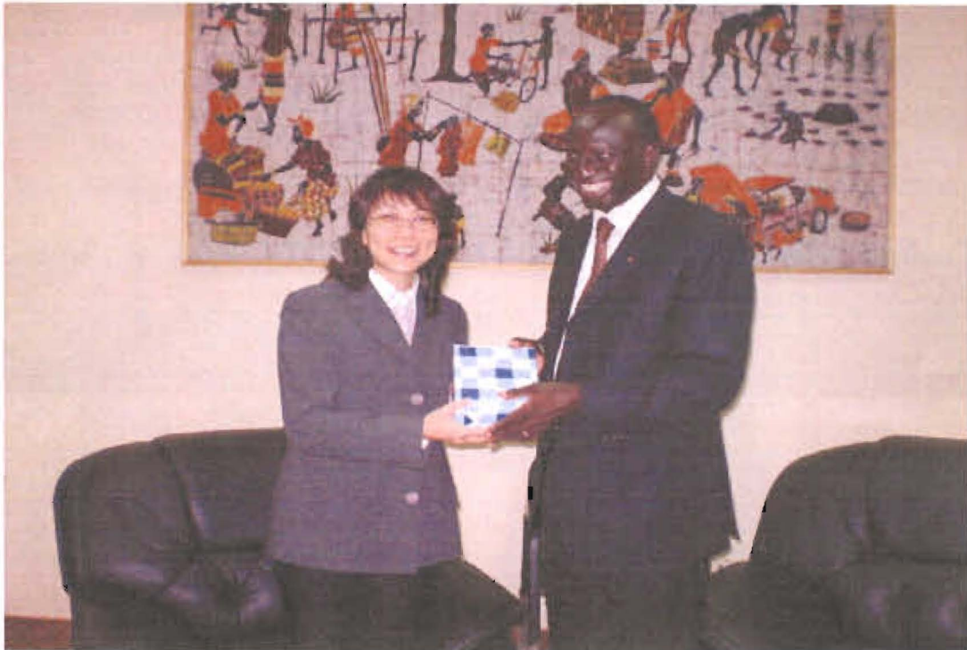
王主委與青年暨就業部長顧達巴合影

表團赴 Ziniare 職訓中心預訂地實地勘查並聽取簡報，指出該職訓中心預定明（99）年 10 月落成，屆時將邀請主任委員再度蒞臨參加啓用典禮。另顧達巴部長於晚宴時間，續就本計畫執行情形與王主任委員交換意見，本訪團訪問期間所有行程，顧達巴部長皆全程陪同並作解說。