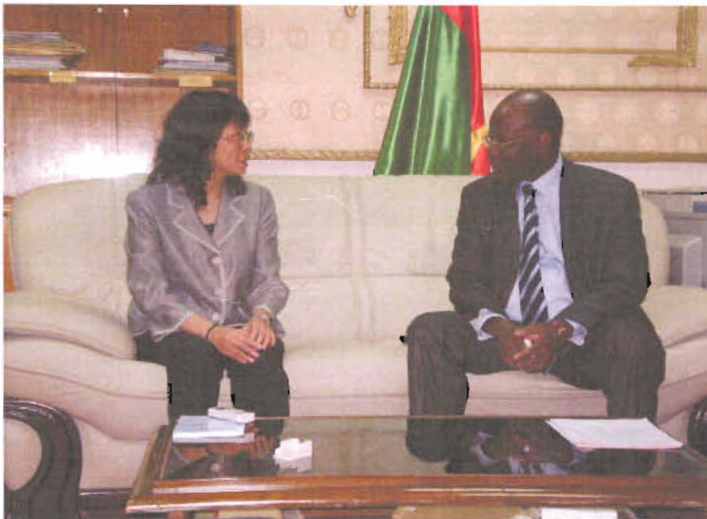
王主委與工作暨社會安全部長卜谷瑪交換意見