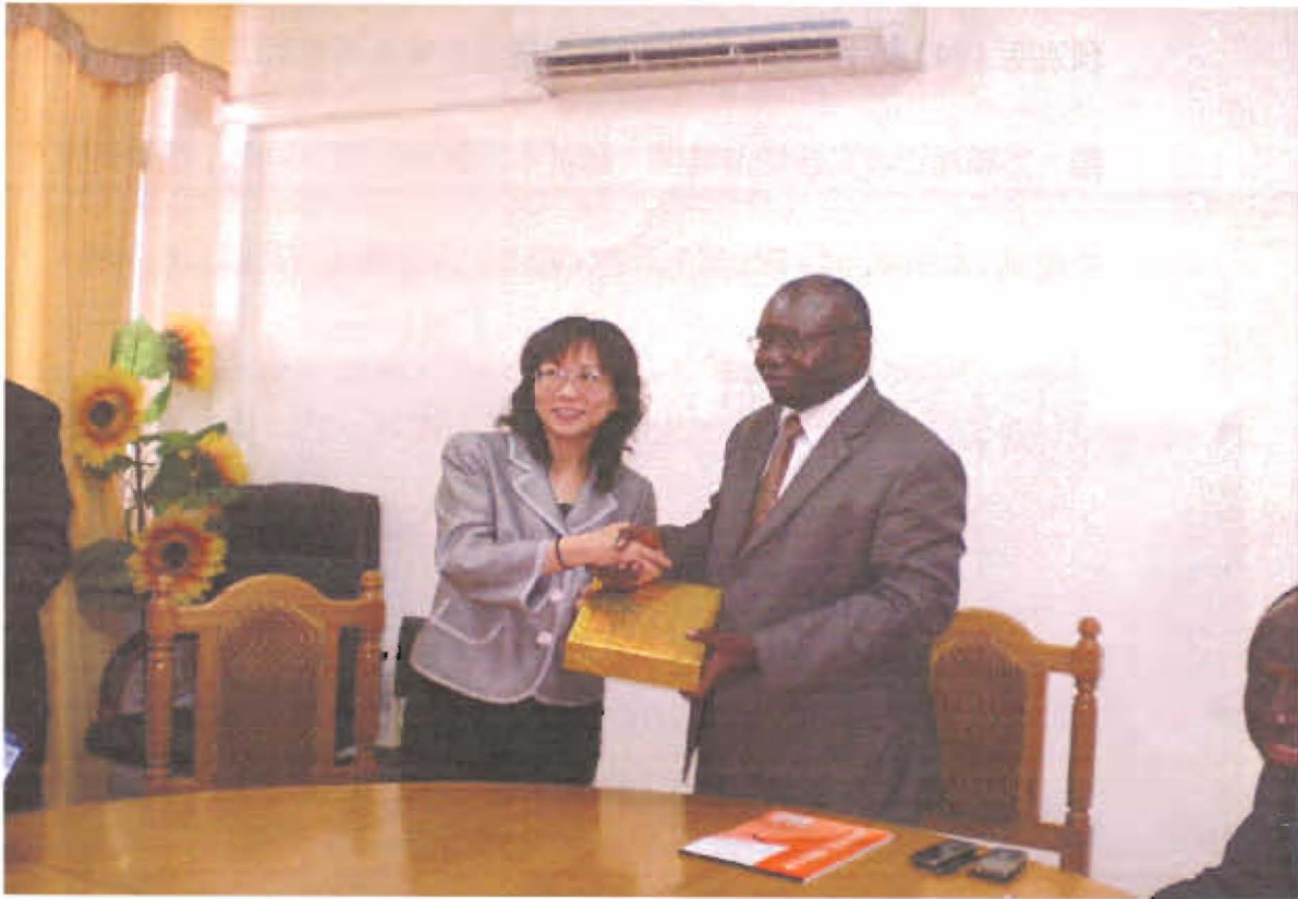
王主委與中高等教育暨科學研究部長巴賀合影