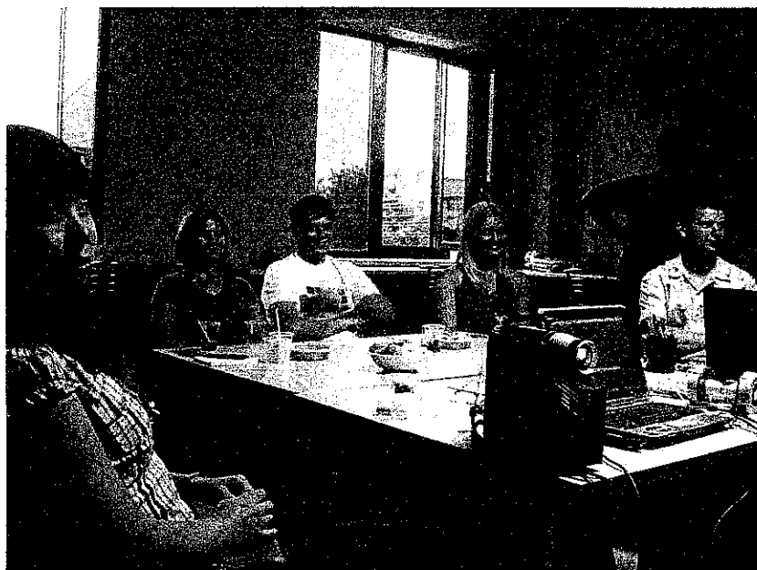
上圖：仔細聽著報告的成員們，桌上有我帶去的扯鈴

後來參加這個社團的時候都是陪同他們一起講英文，每次主題不同，可能是風俗民情，或者是次文化（我向他們介紹台灣的阿宅次文化），跟他們交流英文可以進步很快又能知道更多知識呢！