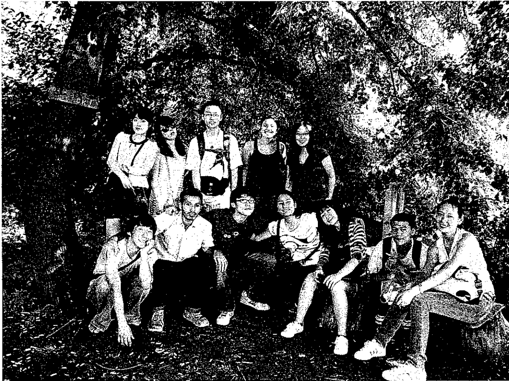
上圖:所有志工的合照