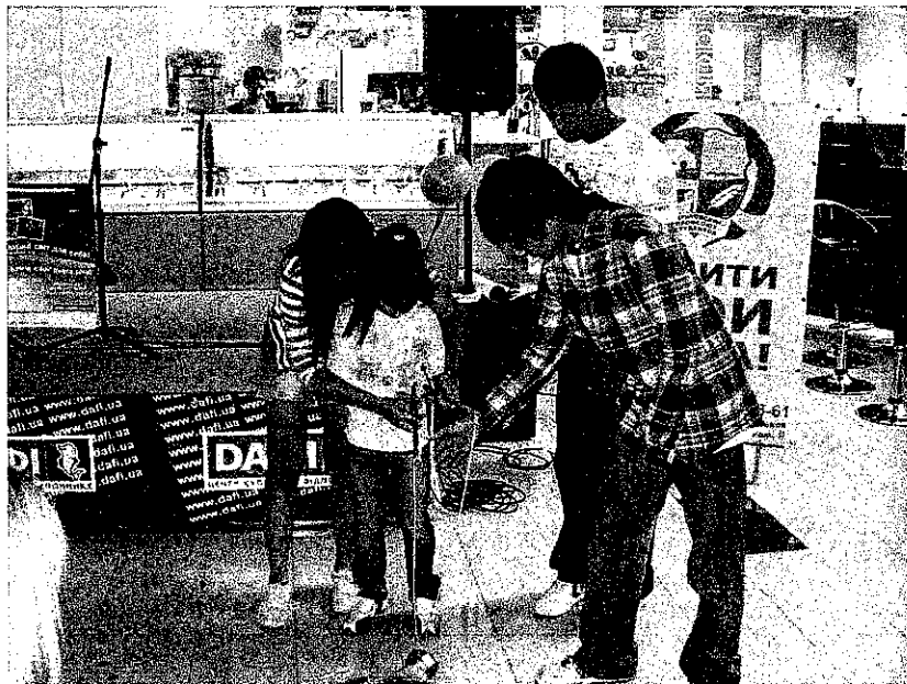
上圖：教小朋友玩扯鈴

這是一個設置在百貨公司內的活動，各個國家輪流上台，向小朋友介紹自己國家的特色與文化。當天我們台灣帶了扯鈴給小朋友玩，小孩身高不高，所以拉起扯鈴特別吃力卻很可愛。他們對扯鈴發出的聲音還有花招很感興趣。