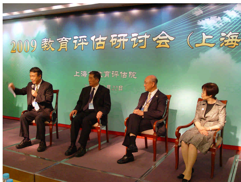
圖 4：本會陳執行長（左一）回應與會者之問題