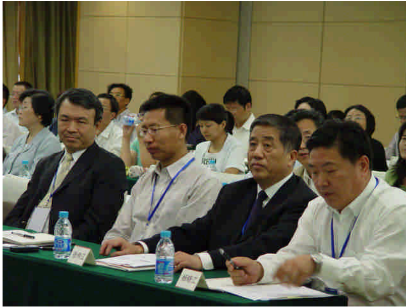
圖 5：本會陳執行長與會情形