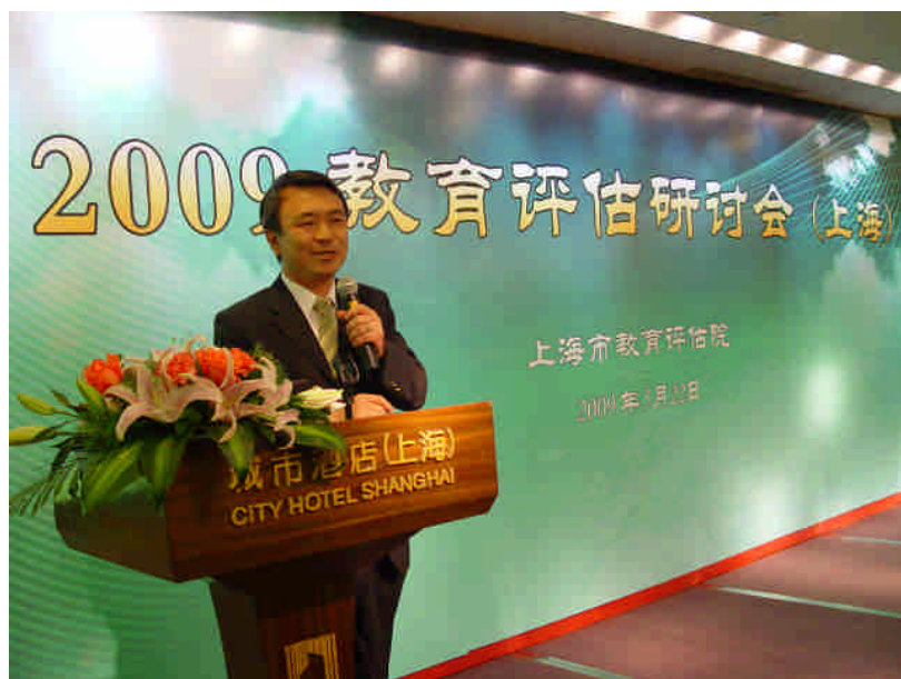
圖 3：本會陳執行長發表演說之現況

大致而言，目前中國大陸之評鑑方式偏向量化模式，台灣之評鑑方式偏向質性模式。因此，此次赴會，在高等教育評鑑實施的理論上與實務上，彼此提供了相當豐富的資訊交流。