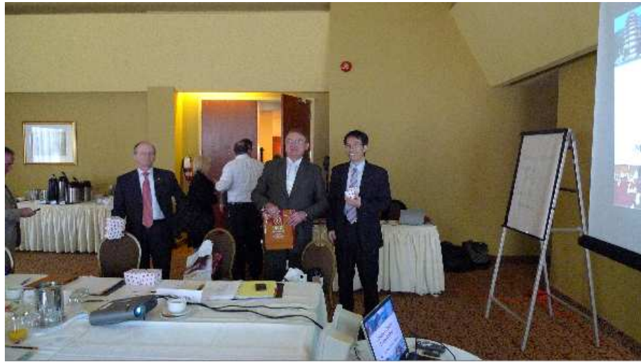
台加第 5 屆資通訊技術會議(ICT MoU)