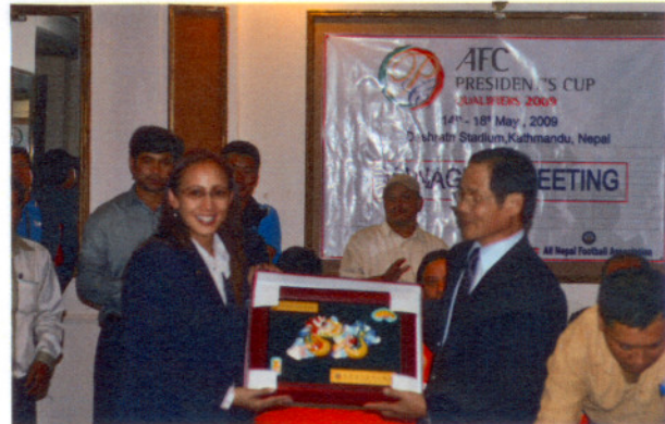
致贈 AFC 禮品