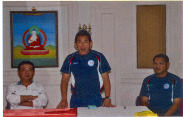
陳總教練一吐悶氣