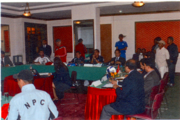
領隊會議及記者會