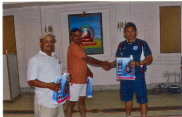
尼泊爾足協致贈紀念品