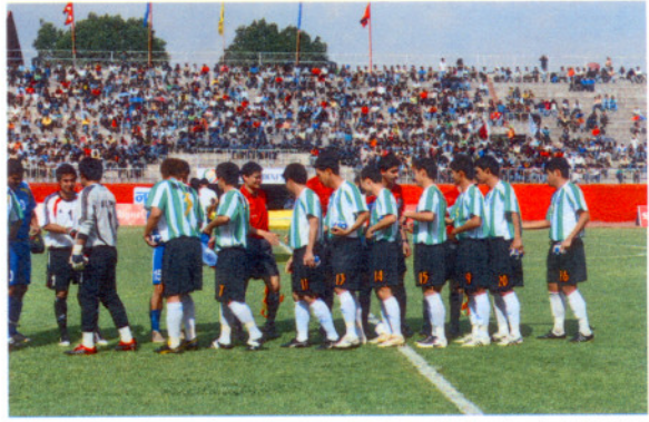
先禮後兵，台電↔尼泊爾警察俱樂部