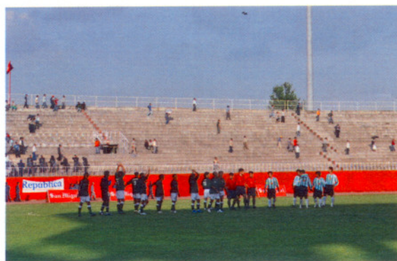
球賽結束 1 : 3 飲恨