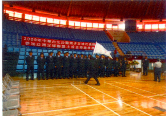
陳教練貴人舞動士氣