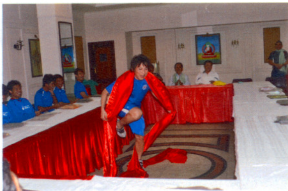
苦中作樂舒解壓力