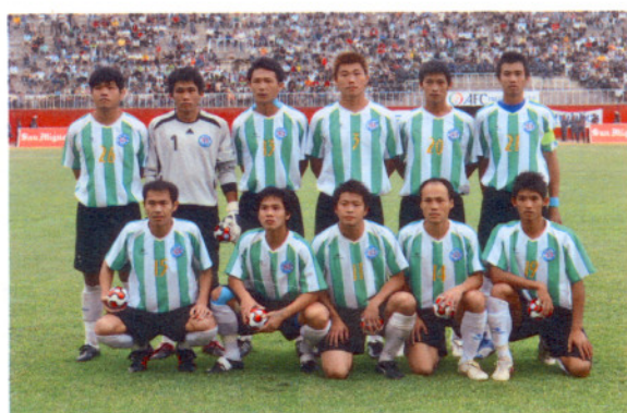
先發 11 人