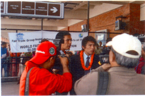
隊長接受媒體採訪