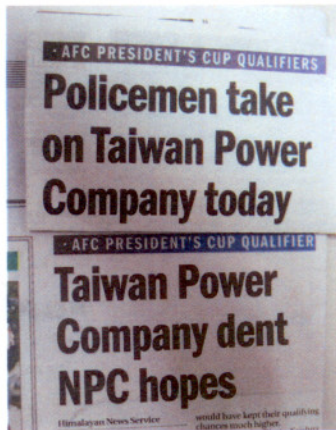
喜馬拉雅時報體育版

晚上 21：00 賽前會議，明日比賽對手塔吉克斯坦 Regar TadAZ 隊在前 4 屆亞足聯主席盃錦標賽獲 2 次冠軍，實力堅強；明天戰略以守代攻，爭和搶勝。