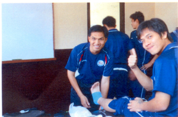
球員賽前防護包紮