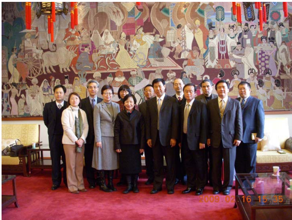
與國家圖書館同仁合影