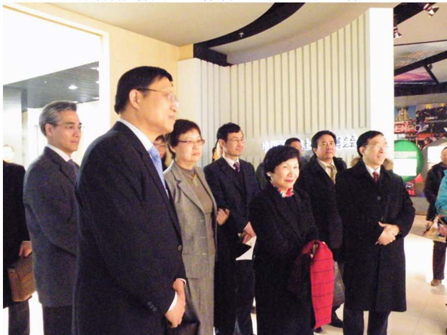
參觀上海世界博覽會園區