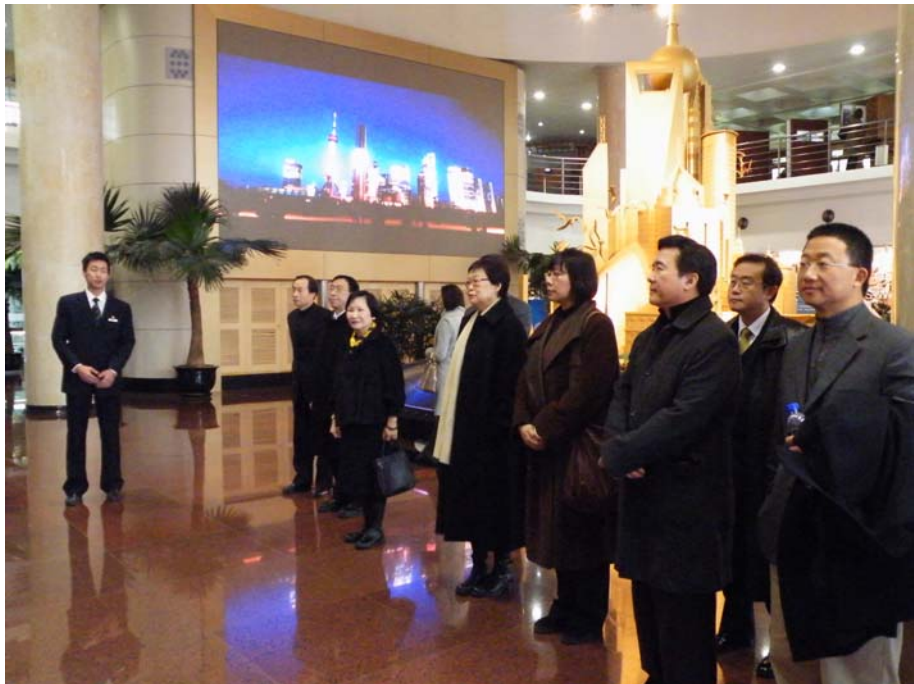
聽取城市規劃館簡報