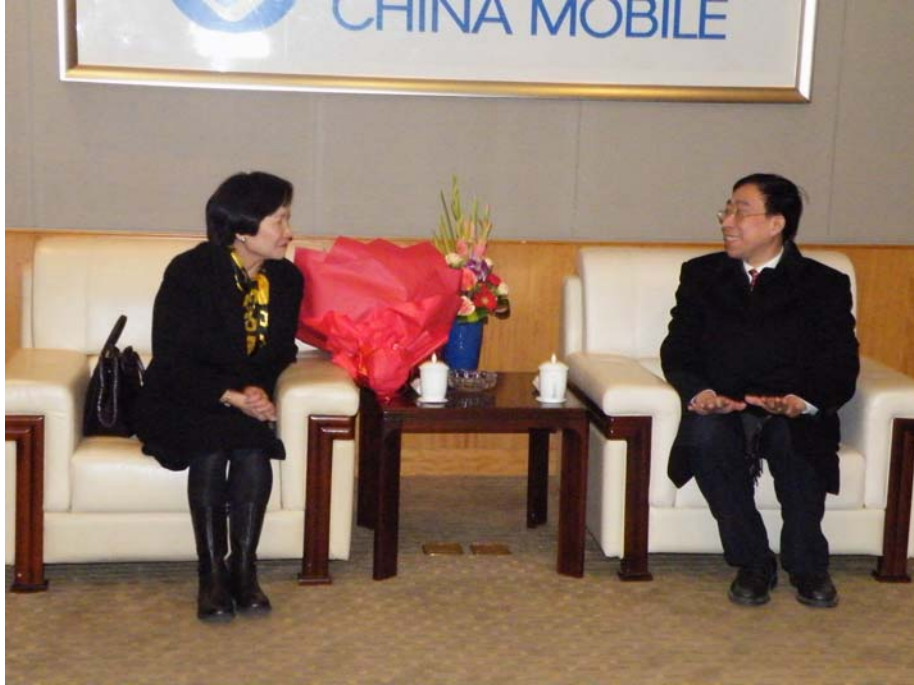
周院長與上海博物館陳館長於機場貴賓室會談