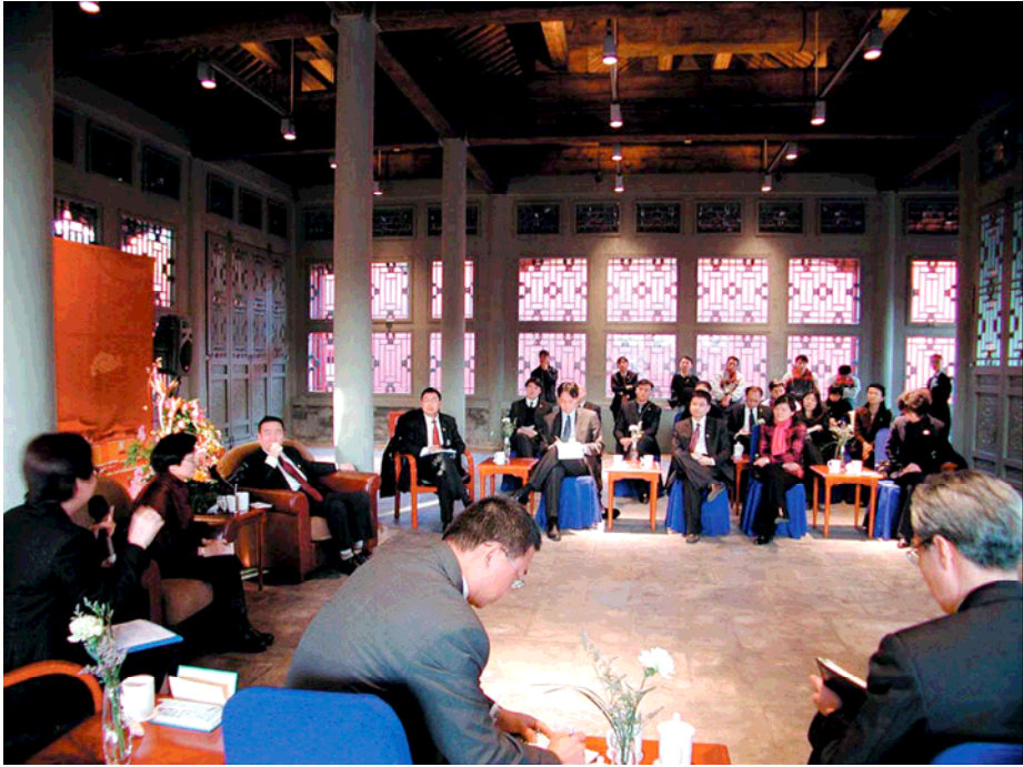
北京故宮建福宮會談現場