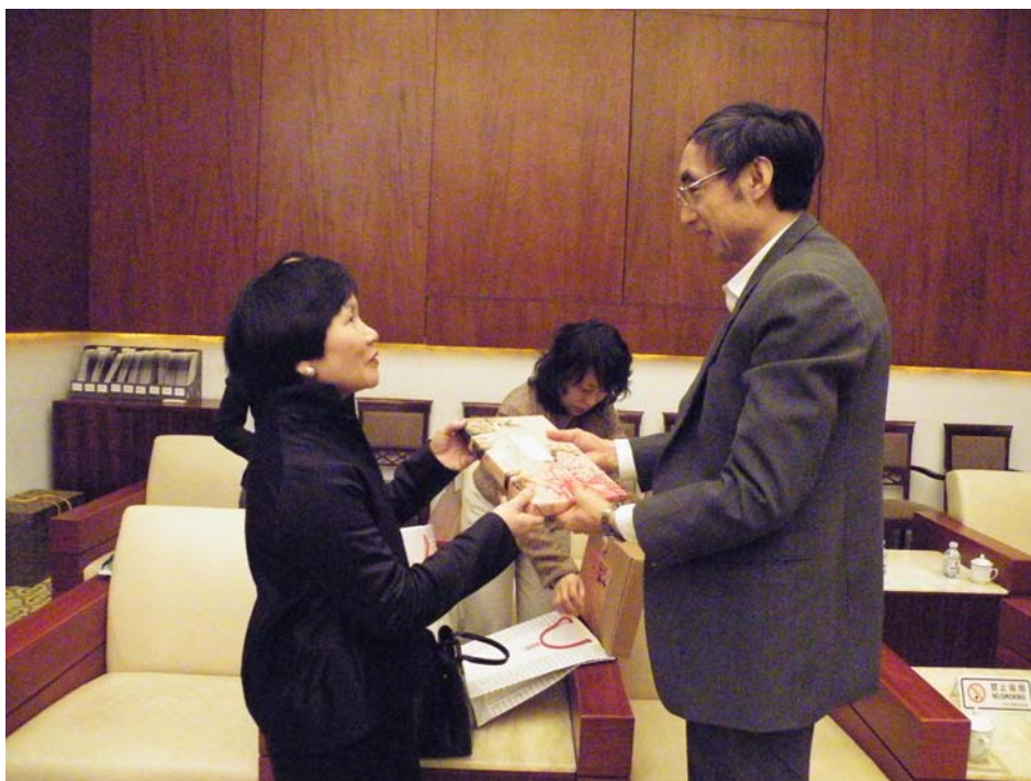
周院長與首都博物館館長交換禮物