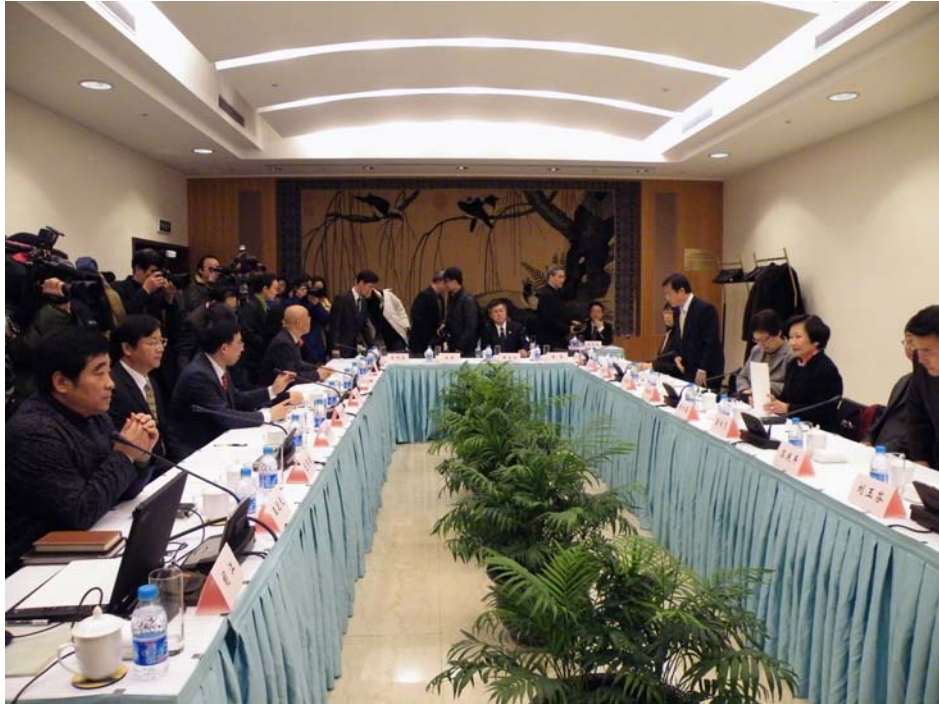
與上海博物館合作會談場景