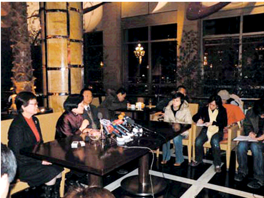
2月15日晚上周院長在北京飯店召開記者會