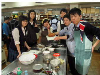
調理実習を一緒に