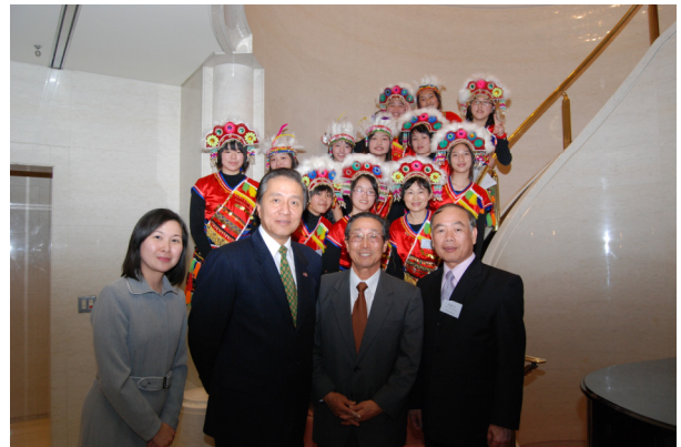
圖 27 馮大使、日交理事長、團長、副團長合照

今晚，是留在日本的最後一夜，台灣駐日本東京經濟文化辦事處，在駐日代表官邸設宴舉行送別餐會，駐日代表馮寄台代表親自主持。晚宴前，由學生代表建國中學張芩浩代表所有與會的成員，報告此次參訪的心得：從行程的安排、日本文化的觀察，與中日文化的差異，談到日本文化的精緻性，值得大家學習。心得不但所有成員頗為認同，馮代表及日本交流協會理事長，也因為同學們的優異表現，頻頻稱道。晚餐後，新竹女中合唱團為大家獻唱，歌聲優美，更讓馮代表感動的說：因為我們的到訪，他是第一次聽到官邸的鋼