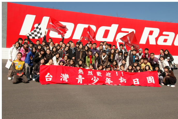
圖 7 團長帶領大家於賽車道大合照

的現場演出，也參觀油電混合動力車等先進發明，之後來到賽車場。在遊覽車接近跑道時，耳邊傳來