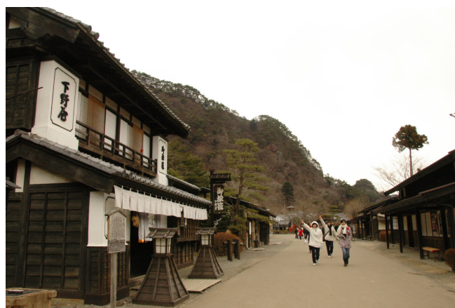
圖 15 於日光江戶村的參觀看到維護文化的用心

下午參觀日光江戶村，這個園區不小，把日本江戶時代的文化完整的保留及呈現出來，除了硬體的建設之外，也有許多的劇場表演，及走動式的日服工作人員，提供遊客一起拍照。結束日光江戶村的參觀後，約近兩個小時的遊覽車車程回東京，於是在車上同學就與隨行的翻譯德山小姐分享學習翻譯的心路歷程。原來德山小姐是台灣苗栗人，畢業於台中女中，後來因為留日關係，在日本結婚，在孩子長大後不斷進修，除增長自己在翻譯上的專業，也順利走上專業翻譯的工作，尤其是同步口譯部份，技巧更是精湛。由於有可能接到各個領域的翻譯工作，德山小姐特別勉勵所有同學能保持不斷進修的心，才能保持