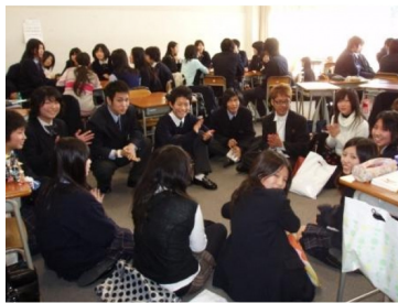
教室で生徒同士の交流が始まりました