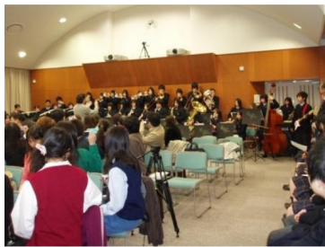
台湾の曲も演奏して歓迎しました