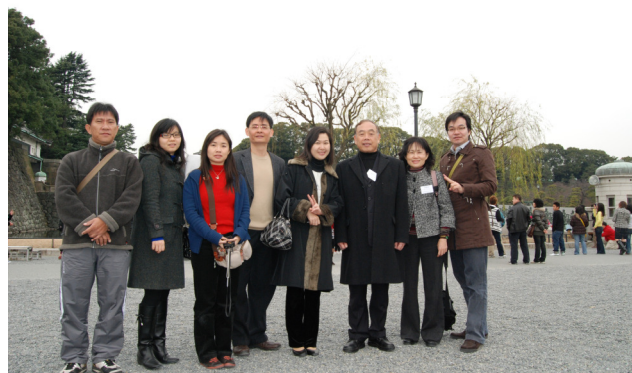
圖 29 團長、副團長與所有輔導老師合照