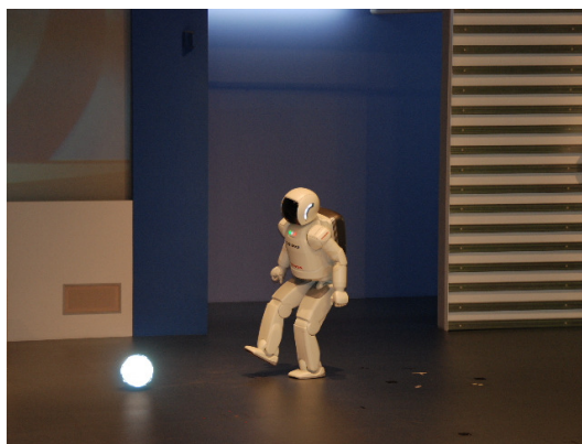
圖 5 參觀機器人「ASIMO」

訪問團所有成員進入園區後，先至「Honda Collection Hall」觀賞簡短的影片介紹，然後參觀這棟三層樓的展示中心。內部放滿了各時期 Honda 研發的車種，包含機踏車、跑車、賽車…等，只是時間太短暫，要深入逛完全區實在不可能。不過大家對於一進門口偌大的『夢』字特別感興趣，在解說員及翻譯的說明下，才知道本田先生本來只是一個小小的機械修理員，卻因為年輕時說了一個大家覺得不可能，甚至是痴人說夢的夢想，雖被大家嘲笑，卻是他當作人生標的的重要指標，而終於創造了他的汽車王國，也因此勉勵年輕有夢的重要。簡單的用完午餐後，我們前往園區內的另一個中心「FAN FUN LAB」參觀機器人「ASIMO」。「ASIMO」身高 120 公分、體重 52 公斤，運用伺服電機、減速機、無線通信、迴轉羅盤…等裝置，讓這個頭戴安全帽的可愛小人可以做出精細的動作；例如端茶、跑步、踢足球等，新一代的「ASIMO」甚至能跳日本藝妓。