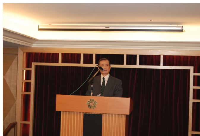
圖 2 齋藤正樹代表於兄弟飯店壯行會致詞

日本交流協會齋藤正樹代表會中也致詞，說明由於日台雙方對短期旅客實施免簽證、互相承認駕照等措施、以及成為日本新幹線技術首次輸出對象的台灣高鐵通車營運等的推波助瀾之下，日台關係一年比一年密切，這幾年來在人員往來方面順勢成長，留學生的交流也很密切，到台灣留學的日本學生，以及到日本留學的台灣學生都有增加的趨勢。此外，從日台進出口貿易總額來看，日本是台灣第二大貿易夥伴，台灣是日本第四大貿易夥伴，由此也可以看出彼此緊密的經濟合作關係。其他方面，如：文化交流、青少年交流、技術交流等各種交流也很密切，現今的日台關係在深度及廣度均屬空前。