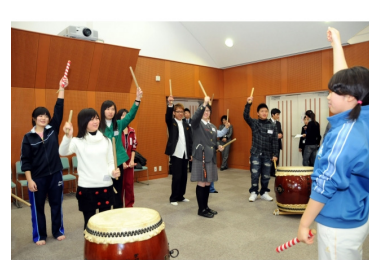
和太鼓に挑戦です