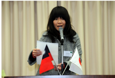
訪日団の生徒からのスピーチ