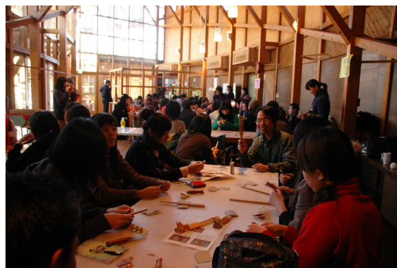
圖 11 大家很認真的製作筷子

離開 TWIN RING 園區，在兩個多小時的車程之後，我們到達享負盛名滑雪勝地奧日光！下車時果然溫度驟降，不到零度的低溫，大夥快快躲進旅館內。晚間有一場日本交流協會所安排的專題講演，分別介紹（一）台灣所提供到日本留學的政府獎學金管道。（二）日本政府所提供到日本留學的政府獎學金管道。（三）所提供獎學金需不需要償還以及（四）日本交流協會所提供到日本留學的獎學金，希望提供足夠的資訊給所有與會的學生參考。隨後今天的晚餐享用溫泉料理，一人一套的溫泉料理豐盛得的讓人捨不得動筷，餐後這旅館還有雪地溫泉可泡，今夜該是個非常日式的夜晚。