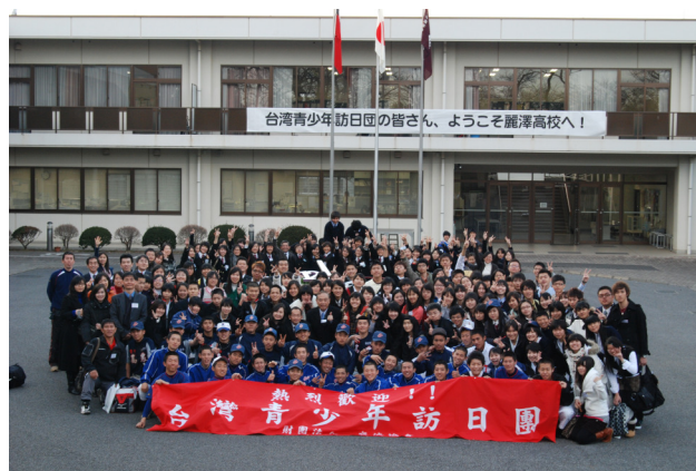
圖 19 麗澤高校門口大合照

離開食堂後，學生除了棒球隊與合唱團之外，分六個社團與各個社團學生做交流，只見學生們認真的學習各社團的活動。社團活動中，學生也趁著熱絡的氣氛下交換禮物，這又是日本人另一個可愛的地方，不管是什麼樣的禮物，他們拿到手上時，先會像檢視古董般仔細看過，而後再露出驚喜的表情，再說出如同美食節目上嚐到美味料理的贊嘆，接著就是一連串的感謝再感謝。歡樂相聚的時光過得總是特別快，要離別時，大家圍著中庭的花鐘成了一個圈，相互拍照、留念。不知是不是年齡相仿的關係，要臨別時大家顯的十分依依不捨。此刻，竹女合唱團突然唱起了歌，嘹亮的歌聲使得大家都不自禁的跟著唱和了起來，音樂果然是無國界！在車子開動的那一剎那，大家都主動的把手伸出車外，揮到麗