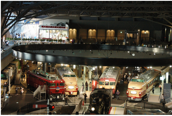
圖 24 參訪日本鐵道博物館