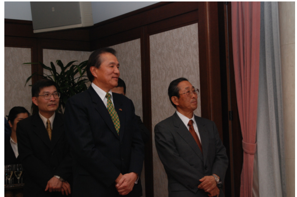
圖 25 馮大使及日本交流協會理事長聆聽學生心得報告

下午的行程，讓大家自由參觀日本鐵道博物館。這間博物館介紹了 JR 的歷年演進，裡面有各式各樣的火車，從創立以來的車種、車站、站牌、服務人員制服等，均有詳盡的介紹。最讓人印象深刻的，是一個縮小版的東京城，其中 JR 的現行車種都可以見到；另外還有介紹一般電車如何驅動和加速，以及新幹線的實境模擬操作，逼真的程度甚至連車身的晃動你都會感受的到；除了有火車之外，販賣部也賣一些有關火車的紀念品。