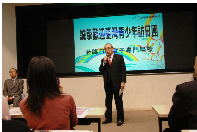
圖 22 日本電子專門學校理事長致歡迎詞