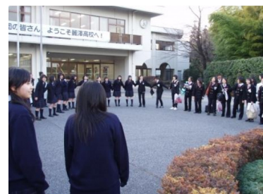
名残惜しい別れの時