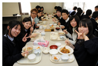
昼食は本校食堂で生徒と一緒に