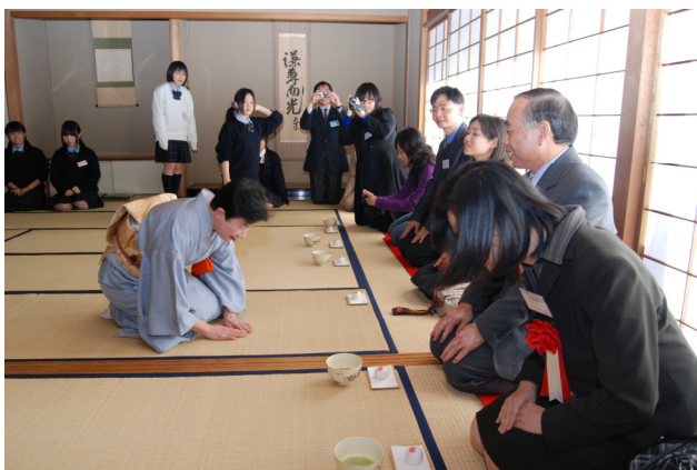
圖 18 體驗日本茶道的社團活動

午餐就在麗澤高中的學生餐廳用餐，這所學校的學生全數在學校用餐，進餐廳映入眼簾的是兩排的洗手台，衛生教育十分徹底；用餐方式採票券制，分三處窗口供餐，今天的菜色是咖哩飯、烏龍麵、豬排丼。餐廳可容納一次 1000 人次，前方有兩個超大飯桶提供食量大的人自行取用，另有六種日式醬菜自取。學生們都十分守規矩，在半小時內用餐完畢，並自行將廚餘碗盤分類放好，令人十分驚訝，生活教育可以做得如此成功。