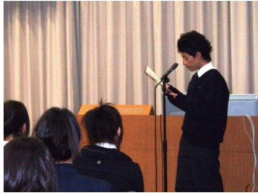
生徒が中国語で通訳をしました