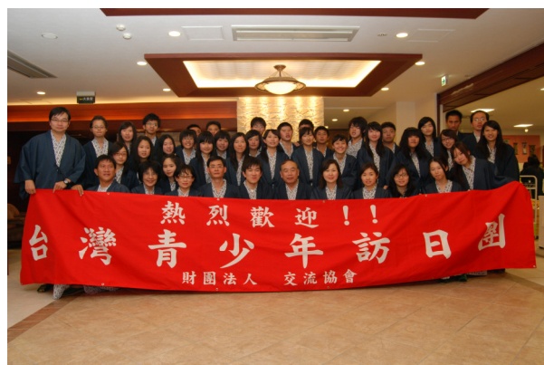
圖 13 於奧日光溫泉飯店著日式浴袍大合照