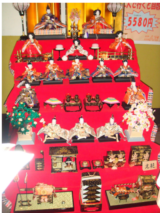
圖 20 日本街道上放置慶祝女兒節擺飾

下午是日本東京外語大學中文系的學生帶領學生自由活動時間，也是每位學員最期待的時間，因為從東京下飛機開始，每個行程都很滿，而且完全沒有自由活動時間，對於雖然人在日本，可是卻從不曾自由踏過日本街道的學員而言，這個自由時間彌足珍貴。每一小組有 2 位大學生帶領，中午一起吃了份量十足的相撲火鍋之後，及各組帶開，至於去什麼地方，也交由各組成員與日本大學生一起討論決定。由於今天適逢日本『建國紀念日』，全國放假一天，所以街上都是人，但也因此可以讓學生有機會進一步去觀察和體驗日本人的日常活動方式。