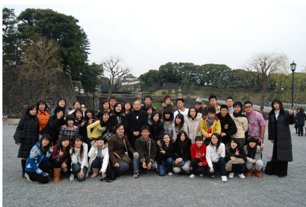
圖 28 於日本皇居前大合照

九天的行程，日本八天的體驗，讓大家更進一步了解兩國文化上的差異，也醞釀出願意更進一步去了解對方文化的種苗，當然，這過程中，大家學會了更多的感謝與相互的扶持，除了文化的體驗，有更多個人內心深層的成長，這恐怕都是出發前所始料未及的，也相信這種同儕之間的相互扶持，在未來成長的路上會有很大的幫助。