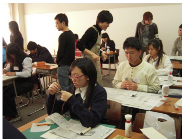
美術の授業に参加しました