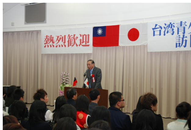
圖 17 團長於歡迎會致詞

這是學生們最期待的一天，參訪東京千葉縣的麗澤高中。麗澤高中創立於昭和 10 年，距今已有 73 年歷史，是由廣池千九郎先生所設立，目前校內還保留有當年廣池先生所居住的房舍做為紀念館。歡迎會場的佈置很簡樸，但十分中華特色，像是那幅牆上掛的「修天爵而人爵從之」。開幕式的用心，確確實實讓我們感受到了，尤其是在國外聽到中華民國國歌時，心中的感觸的確百感交集。歡迎會在 10 點由校長主持，他簡單的介紹了學校的沿革和歷史，目前高中部約有學生 650 名，但整個體系屬學園制，所以廣大的校園內除高校之外還有大學、中學校、小學校和幼稚園，校地寬廣，大學部的社團中還有騎馬社的成立，另外校園中，還有 9 洞的小型高爾球場，以及歷史悠久的吉野櫻，想像春天綻放時的美景，真是羨慕這麼優雅的學習環境。