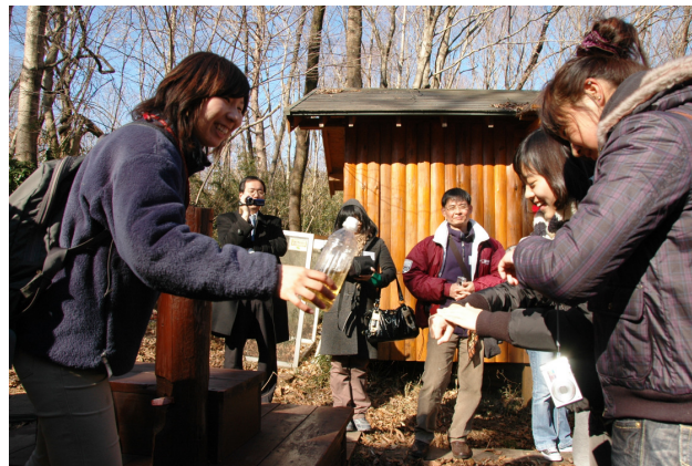
圖 9 菌類分解廁所內排泄物而成為可以飲用的水