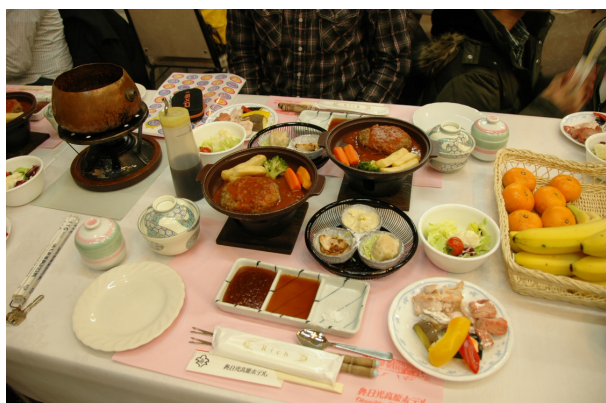
圖 12 豐盛的溫泉料理

離開 TWIN RING 園區，在兩個多小時的車程之後，我們到達享負盛名滑雪勝地奧日光！下車時果然溫度驟降，不到零度的低溫，大夥快快躲進旅館內。晚間有一場日本交流協會所安排的專題講演，分別介紹（一）台灣所提供到日本留學的政府獎學金管道。（二）日本政府所提供到日本留學的政府獎學金管道。（三）所提供獎學金需不需要償還以及（四）日本交流協會所提供到日本留學的獎學金，希望提供足夠的資訊給所有與會的學生參考。隨後今天的晚餐享用溫泉料理，一人一套的溫泉料理豐盛得的讓人捨不得動筷，餐後這旅館還有雪地溫泉可泡，今夜該是個非常日式的夜晚。