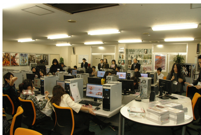
圖 23 各組於日本電子專門學校見習課程

日本的學制中，專門學校等同台灣的技職院校。今天我們來到位於新宿區的電子專門學校參觀。這所學校創立於 1951 年，目前共設有電腦繪圖系、電玩系、卡通動畫系、設計系、音樂系、IT 系、電子/電器系等七個科系，校系分布在繁華的新宿街頭，各分為 20 個館在不同的建築內。首先由該校理事長開場，並簡短觀賞學校影片介紹。這所電子學校設備非常先進，舉凡電腦繪圖、影像處理、SE 工程、音效整合…等教學器材，都力求跟上數位時代的轉變。學生分為三組，由老師帶領學習動畫、音效、及影像的入門，這對日本動漫畫已普遍在生活的學生而言，真是莫名的興奮。經驗分享時，電子專門學校還特地介紹三位從台灣來留學的同學，學習 GAME 音樂的製作專門技術，對他們來說，擁有一技之長遠比拿博士更為重要。簡單的見習課程結束時，有的學生手上就多了一片動畫作品集光碟，希望能回家自己摸索，做出如宮崎駿的動畫卡通。