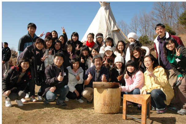
圖 10 大家摩拳擦掌槌麻糬後留影

做的，流汗之餘，也覺得特別的好吃。餐後我們體驗了日本的傳統工藝製作，製作筷子及筷套，只看大夥一個個賣力的將手中砂紙認真的磨著櫻花木及檜木，試著以各種方式，磨出自己心目中最理想的筷子模樣。