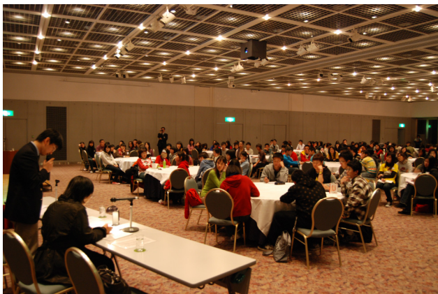
圖 8 宇都宮大學松金副教授演講