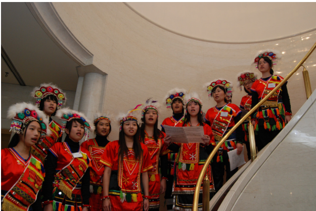
圖 26 新竹女中合唱團於馮大使官邸獻唱

下午的行程，讓大家自由參觀日本鐵道博物館。這間博物館介紹了 JR 的歷年演進，裡面有各式各樣的火車，從創立以來的車種、車站、站牌、服務人員制服等，均有詳盡的介紹。最讓人印象深刻的，是一個縮小版的東京城，其中 JR 的現行車種都可以見到；另外還有介紹一般電車如何驅動和加速，以及新幹線的實境模擬操作，逼真的程度甚至連車身的晃動你都會感受的到；除了有火車之外，販賣部也賣一些有關火車的紀念品。