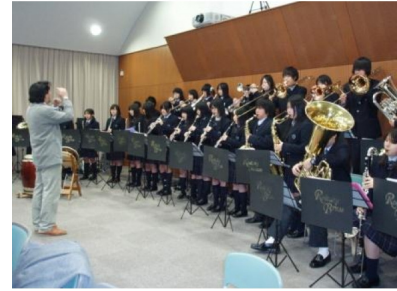
本校吹奏楽部が両国の国歌を演奏しました