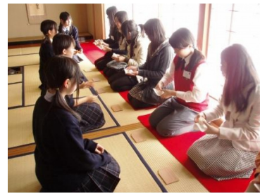
日本の茶道を体験していただきました