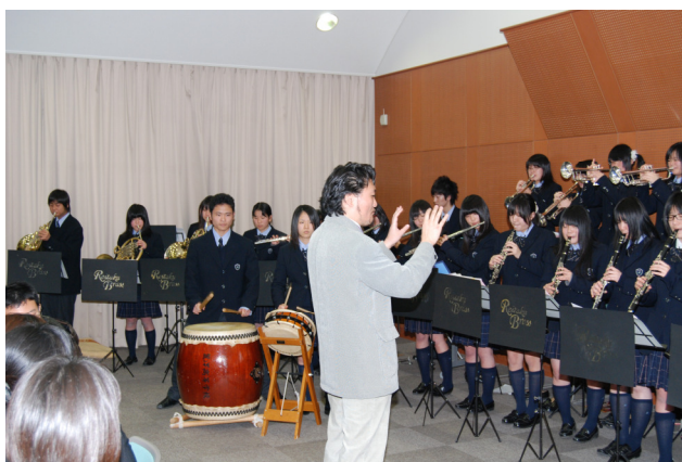
圖 16 麗澤高校演奏中華民國國歌