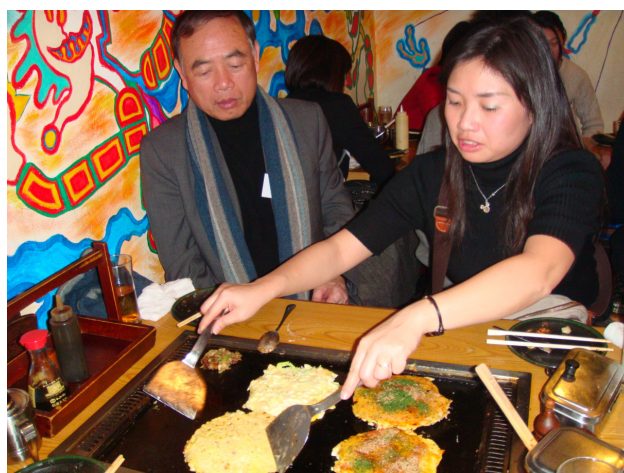
圖 21 晚餐大家親自製作大阪燒