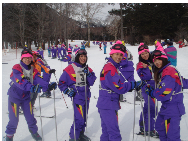
圖 14 充滿興奮之情的滑雪初體驗

清晨用完早餐，全團的人都興奮著要去滑雪，只是團長和老師都擔心學生安全，大夥穿上厚重的裝備，拿著比人高的雪橇，前往滑雪場，只見才開始移動，就不斷有人因不熟悉雪地而滑倒。一到滑雪場，只見白藹藹的高原雪景盡入眼底，大家有著莫名的興奮。學生都由專業教練帶領，先學習穿著笨重雪鞋在地上走，大部分學生都屬初學，所以被帶到最接近平地的初級滑雪區，只見每個人穿上雪橇後都好像嬰兒學走路一樣，大字腳、前後搖晃，一個不留心就摔進雪地。但是不到一小時，有不少人竟然都能小小的滑上一段，果然年輕人的學習力強，當然，老師們的學習就比較受挫一些。整個上午在充滿刺激與滿足的氛圍中，結束滑雪體驗。