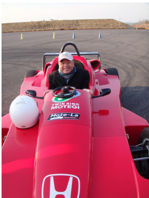
圖 6 團長體驗坐賽車的感覺

參訪過程中，每位同學都配有耳機，由這幾天陪著我們的翻譯德山小姐為我們做同步翻譯；德山小姐超強的翻譯功力，讓大家能輕鬆瞭解複雜的機器人。我們看了一段「ASIMO」