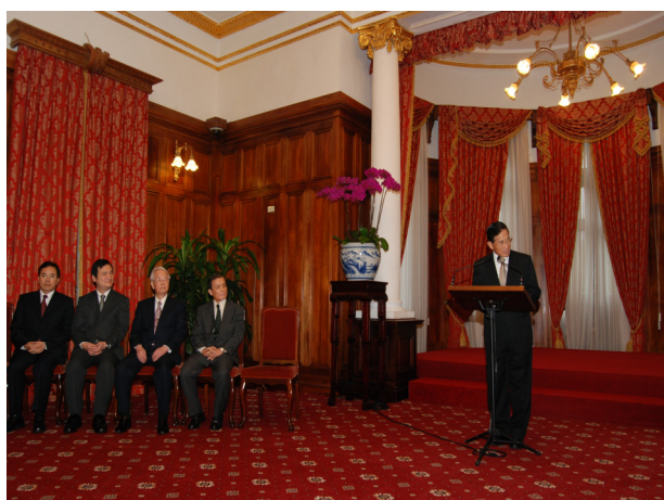
圖 1 歐鴻鍊部長於台北賓館致詞

僅奠定兩國深厚的民間交流基礎，也是雙方在經貿、政治上密切互動的原動力。為維持這種緊密的特別夥伴關係，我國願意與日本展開全面性交往，並宣告今年為「台日特別夥伴關係促進年」，以展現我國政府重視台日關係的決心與態度。政府並希望外界可以瞭解，「台日特別夥伴關係」並不是一個口號，政府將會以高度的行動力與執行力來推動這項政策，希望透過與日本展開全面性的交往，達到增進兩國之相互瞭解，進一步強化並達成全方位台日特別夥伴關係的目標。