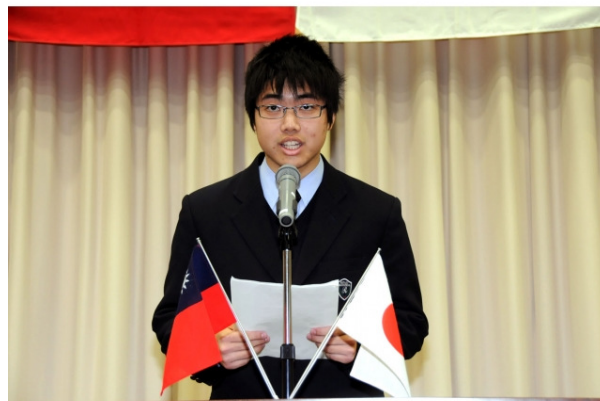
本校生徒会長歓迎のスピーチ