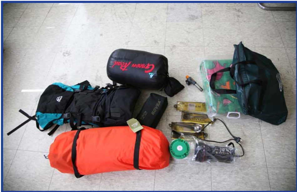
圖 3.5 調查員個人裝備