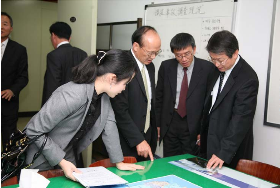
圖 3.3 雙方調查作業經驗交流