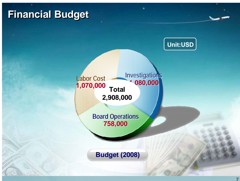
圖 3.2 韓國航空鐵道事故調查委員會 2008 年度預算