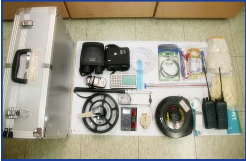
圖 3.4 調查員共用配備