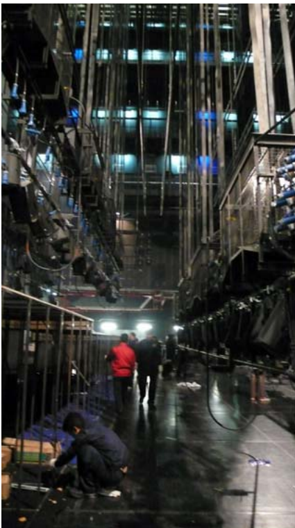
戲劇場燈光技術部門裝台

9. 其他對應設施：大劇院內設有五間排練廳，位於三個劇場之間，可以共用也可以分別彈性使用。一個綜合排練廳供演出進行綜合排練和觀摩排練；另有兩間中型排練廳，一間專供舞蹈和戲曲武生使用，地板有較好的彈性，另一間專供樂隊排練用，廳內殘響時間可以調節；兩間小型排練廳，主要用於分部排練。各劇院都設有化妝間、指揮休息室、琴房、演員候場區、換裝間、服裝整燙間、道具間、演員休息廳等對應設施。舞臺技術部分，設有音響控制室、燈光控制室、調光器設備室、音響設備室、攝影機房等。大劇院設有集中影音製作中心，有大錄音室一間、同步錄音轉播室一間，以及電視轉播機房和影音後期製作室。大劇院設有一間大繪景間，設置佈景吊掛和繪景設備，還設有佈景、道具整修間和佈景倉庫，以及為集裝箱運輸用的升降平臺2台。