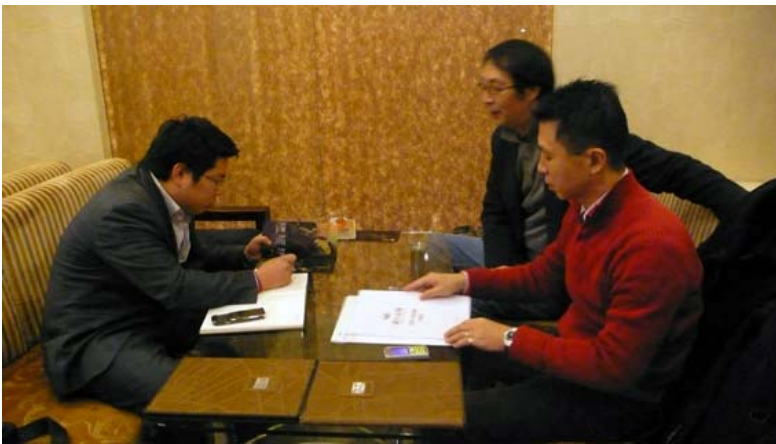
與北京大學文化產業研究院相關人員會商演出事宜

館，近年來成為世界各地旗艦級演藝團體至北京巡演時，必然造訪的演出場地。就其過去的演出活動顯示，入場觀賞表演活動的觀眾的平均素質較高，對本團將有正面的激勵作用；而其全國性甚至世界性的曝光率，將使本團的演出成為藝文訊息或評論的注目焦點。