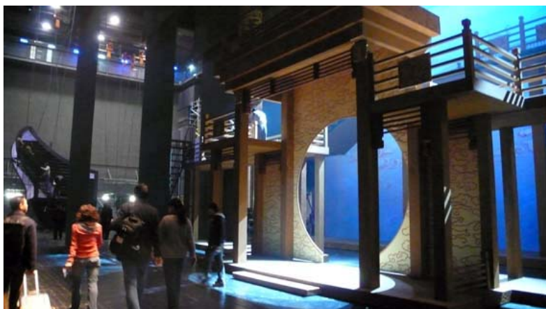
新編京劇《赤壁》在歌劇院舞台上裝台

板，並用三層結構來增加彈性，保護了芭蕾舞演員的腳尖。是中國境內面積最大的無縫隙專用芭蕾舞面板，臺面可傾斜至 5.7 度。樂池面積為 120 平方公尺，可容納約 90 人的三管編制樂隊，也可升至觀眾席高度位置變成觀眾席。在樂池中，特別為指揮設計了專用升降臺，指揮可以以這種特別的方式出場、