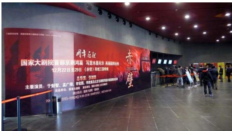
國家大劇院售票口

設計 (CI)、品牌推介、廣告媒介、製作監製、行銷推廣、活動組織 (包括參觀)、公共關係 (媒體合作) 等。品牌策略是大劇院的核心策略。品牌推廣中心是大劇院經營管理中的新嘗試，是大劇院經營的核心部門，引入現代企業管理最新理念設置。