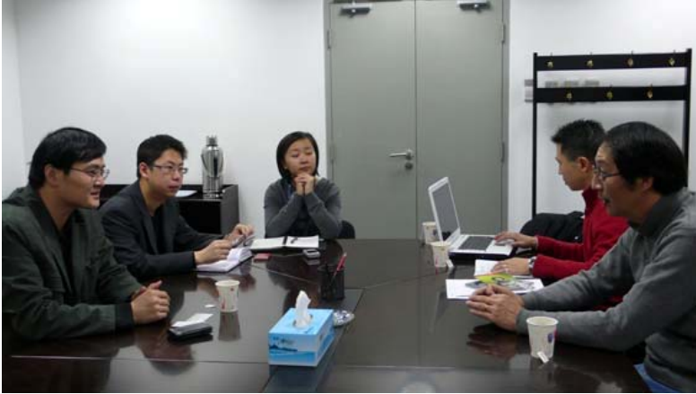
與國家大劇院演出部相關人員會商演出事宜

本團 2009 年赴大陸巡演劇目為《金鎖記》，主要呈現國光近年來在京劇新編創作的成果，將台灣京劇總體劇場的概念，帶到彼岸的舞台上，與當地專家學者及觀眾進行實質交流。「國家大劇院」與北京大學「百週年紀念堂」為北京兩個重要的表演藝術場