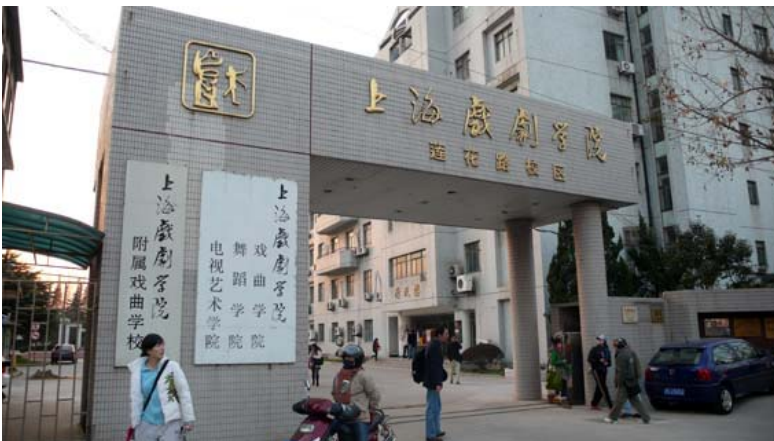
上海戲劇學院蓮花校區大門

上海戲劇學院戲曲學院，是上海地區唯一以培養戲曲高層次藝術人才的高等學府。在市上海市政府相關單位的直接領導下，她為緩解上海地區戲曲高層次表演、導演後繼人才的匱乏應運而生，在整合上海地區高等藝術教育資源的歷程中迅速壯大。戲曲