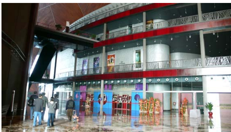
國家大劇院觀眾走道及禮品店

國家大劇院作為國家表演藝術的最高殿堂，關注藝術水準，由藝術委員會和藝術總監嚴把藝術關，堅持藝術性、經典性，堅持用發展的眼光、海納百川的開放胸襟，開創民族文化藝術的新格局。致力於向世界展示中國多民族表演藝術的卓越成就，追求藝術性、原創性、經典性，扶持中華民族原創舞臺表演藝術的發展，透過委託創作，政策扶持等鼓勵民族舞臺藝術的創作與展示，借助大劇院的舞臺將本土表演藝術推向世界。