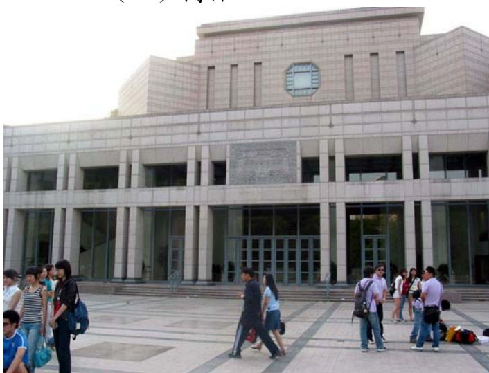
北京大學百週年紀念堂外觀

北京大學百週年紀念講堂是在時任中國國務院副總理李嵐清的主導下，為慶祝北京大學建校 100 周年而建，是北京大學標誌性建築之一。建築面積 1.26 萬平方公尺，最高處為 34.8 公尺，地上主體三層，側房兩層，地下一層，擁有觀眾大廳和小劇場及化妝間、排練廳、紀念大廳、四季庭院、會議室、展廊、貴