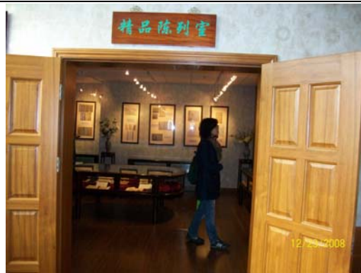
27. 上海師大圖書館精品陳列室