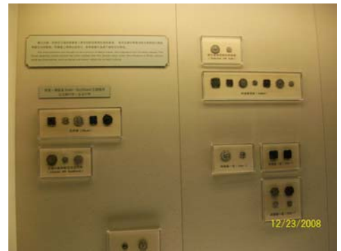
44. 上海博物館系統性蒐集出土文物 1