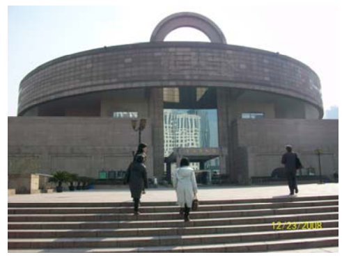
42. 上海博物館外觀頗具特色