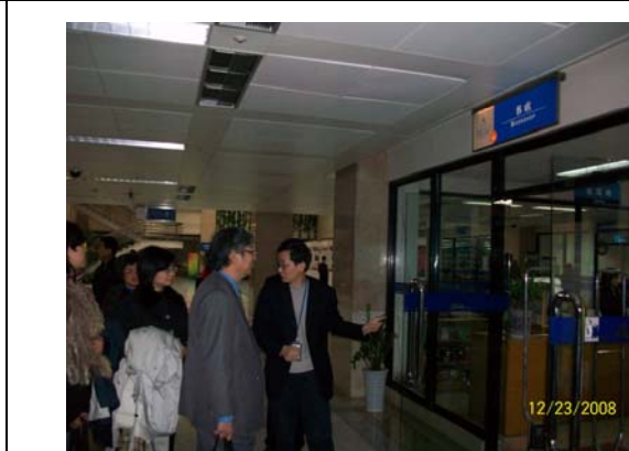
38. 上海圖書館內附設書店