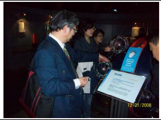
40. 上海科技館內有許多可動手探索的展品