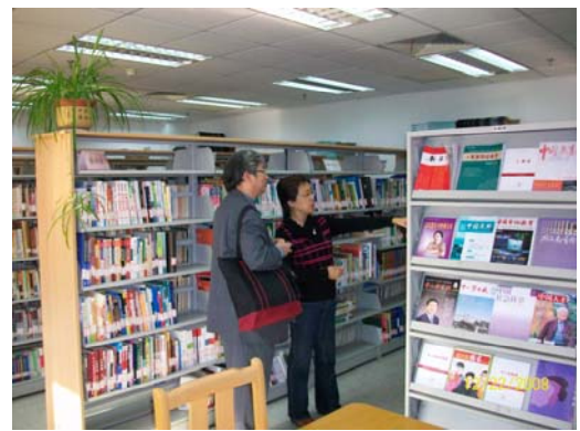
12. 中學校長培訓中心圖書室供學員查閱資料