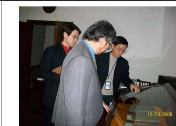
36. 上海圖書館典藏的華人家譜最多