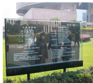
上海博物館外簡介告示牌

青銅館」陳列了 400 多件古代社會文明的重要標誌—青銅器；「古代雕塑館」內陳列 120 餘件雕塑製品，其中以金、紅、黑三色石刻塑像為主。二樓「古代陶瓷館」是上海博物館的收藏特色之一，陳列著 500 餘件的陶瓷精品，其中包含新石器時代的彩陶、春秋戰國的青瓷，以及人們眾所皆知的唐三彩等具有各個時代的代表性陶瓷。三樓為「歷代繪畫館」、「歷代書法館」以及「歷代爾印館」。四樓為「古代玉器館」，以及「歷代錢幣館」典藏將近 7,000 件從古至今的貨幣，數量驚人且保存完善。另有二個特展「南陳北崔—陳洪綬、崔子忠書畫特展」及「明清家具展」。