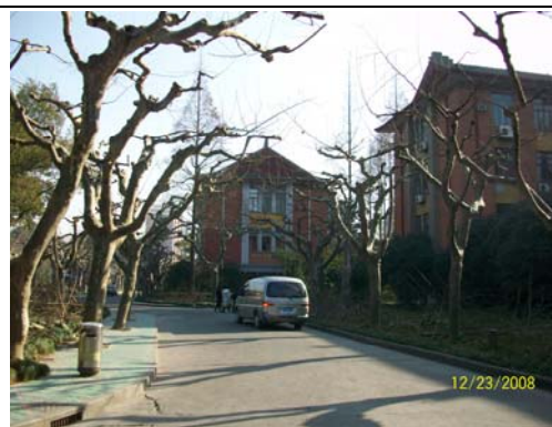
20. 上海師大校園一隅