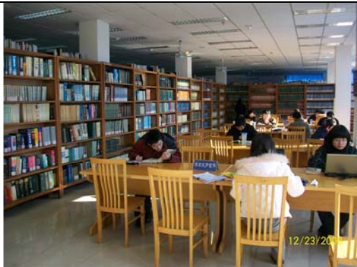
21. 上海師大圖書館一隅