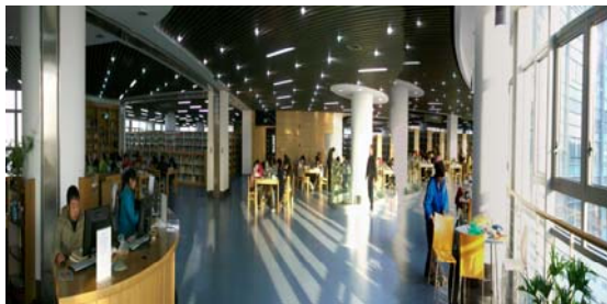
15. 華東師大圖書館閱覽室幾乎座無虛席