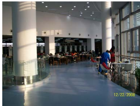
16. 華東師大圖書館環境清幽