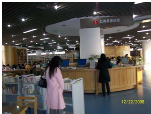
17. 華東師大圖書館一隅