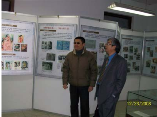
23. 上海師大圖書館每年均就館藏辦理特展