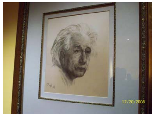
50. 朱家角延藝堂精美手工藝展品- 刺繡(非素描)