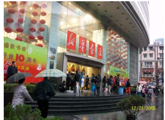
46. 上海書城門庭若市