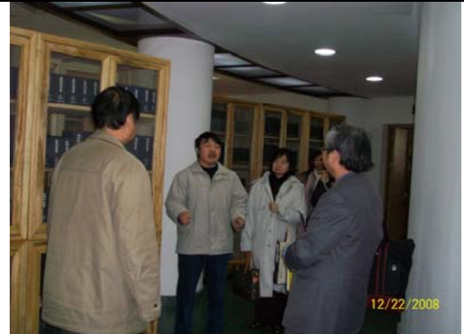
14. 華東師大圖書館古籍特藏部