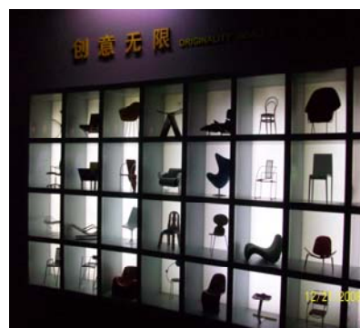
上海科技館「設計師搖籃」展區之展示櫥窗

圓頂方體建築的上海博物館位於上海市黃浦區人民大道、河南南路和延安東路口（即人民廣場的南側），與北京、南京、西安齊名的中國四大博物館之一。館內珍藏文物 12 萬件，其中以青銅器、陶器和書法、繪畫最具特色，尚有中外文物書籍 20 萬本。全館總面積約 39,200 平方公尺，高約 29.5 公尺，共有四層樓，目前一樓為「中國古代青銅館」及「雕塑館」，「古代