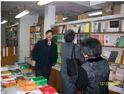
9. 華東師大教育書店書類眾多