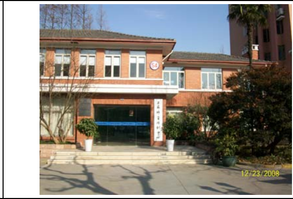
32. 上海師資培訓中心外觀