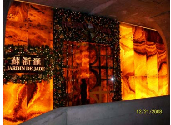
8. 上海創意產業中心入駐的餐廳富麗堂皇