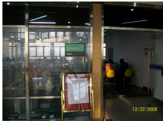
18. 華東師大圖書館電子閱覽室設備新穎