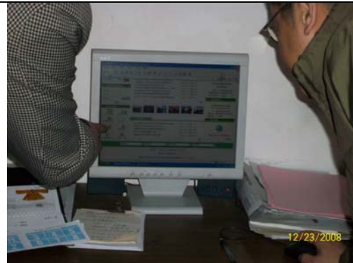
22. 上海師大圖書館吳副館長於線上展示上海近代方志資料庫