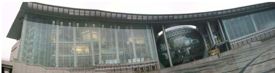
外觀氣勢宏偉的上海科技館

本館人員購買了每位成人 60 元人民幣的門票，實地參觀了設計師搖籃、視聽樂園、機器人世界等展區，並坐上體驗車進入虛擬的人體消化系統，果真集聲光效果、寓教於樂精采展示。