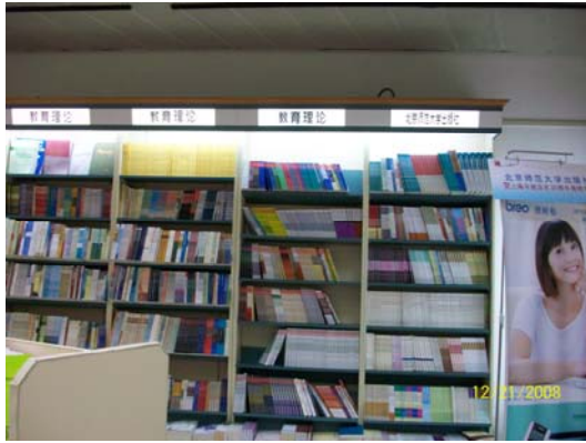
47. 上海書城內教育類書籍數量眾多