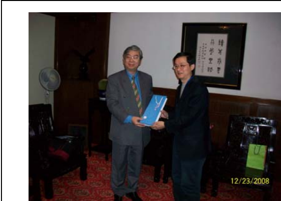
35. 上海圖書館與本館互贈紀念品