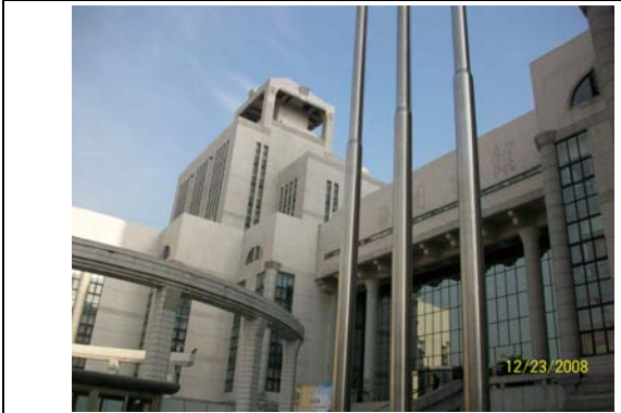
33. 上海圖書館是大陸規模最大的公共圖書館