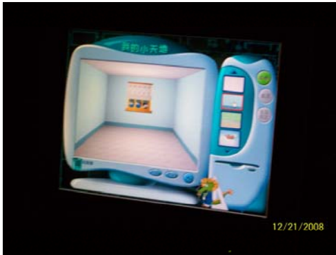
41. 上海科技館 CAD 教室電腦畫面