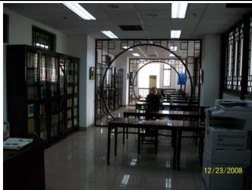
29. 上海師大圖書館參考閱覽室古色古香