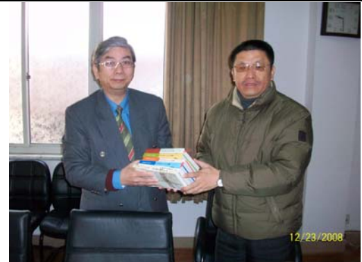
30. 上海師大圖書館贈書予本館