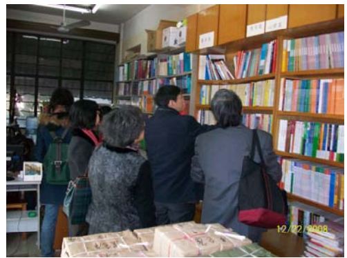
10. 華東師大出版社讀者服務部