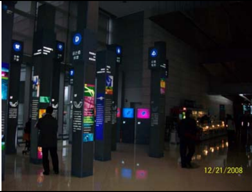
39. 上海科技館以柱狀群簡介各樓層展區