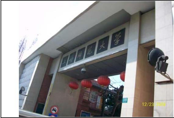
31. 上海師範大學東部校門