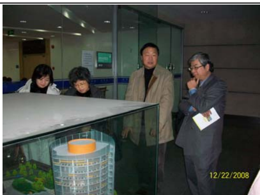
19. 華東師大圖書館模型外形頗具特色