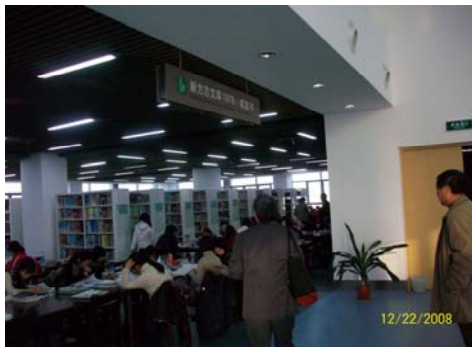
新方志文庫典藏大陸各省 3 千多個縣地方志

該館特色資源，其一為《年譜資料庫》，是《中國年譜資料庫》的主庫，目前收集了 3700 多位古今人物的年譜近萬種。每種年譜均有譜表介紹，其中多數年譜能流覽全文，惟目前僅限館內閱覽。其二，該館另闢恆溫恆溼專室專門典藏民國初年抗戰年間的出版品，原因是該時期的紙質及抗酸性等不佳，反較明清時代的紙品不易保存，加以戰亂多所散迭收集不易。其三，設有新方志文庫，主要收集典藏 1978 年以來全國 3,000 多個縣的地方志，與本館建置之台灣方志網資源相近，未來可考慮與該館進行陸台兩地地方文獻資料之交流與觀摩。令人印象深刻的還有「自動存包櫃」，以閱覽證磁卡開關，並有系統自動顯示使用狀況，不失為利用高科技的便民措施。