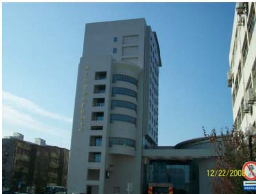
11. 大陸教育部中學校長培訓中心外觀