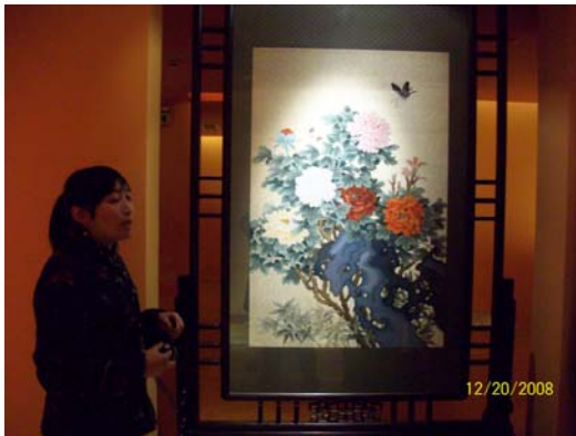
49. 朱家角延藝堂精美手工藝展品- 縉絲牡丹中堂