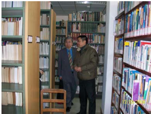
25. 上海師大圖書館典藏書庫