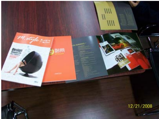
7. 上海創意產業中心精美文宣品