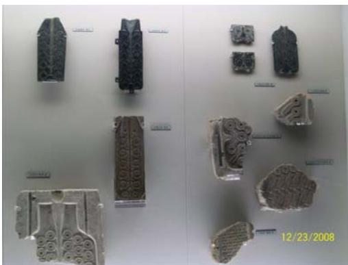
45. 上海博物館系統性蒐集出土文物 2