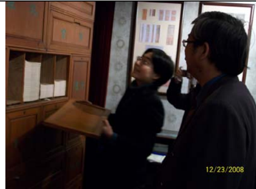
28. 「古今圖書集成」典藏櫃為鎮館之寶