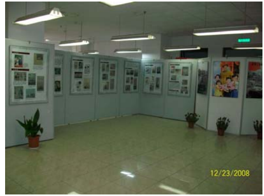
24. 上海師大圖書館館藏特展-上海記憶