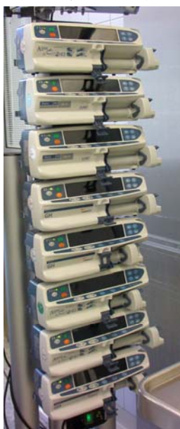
圖八 Syringe pump