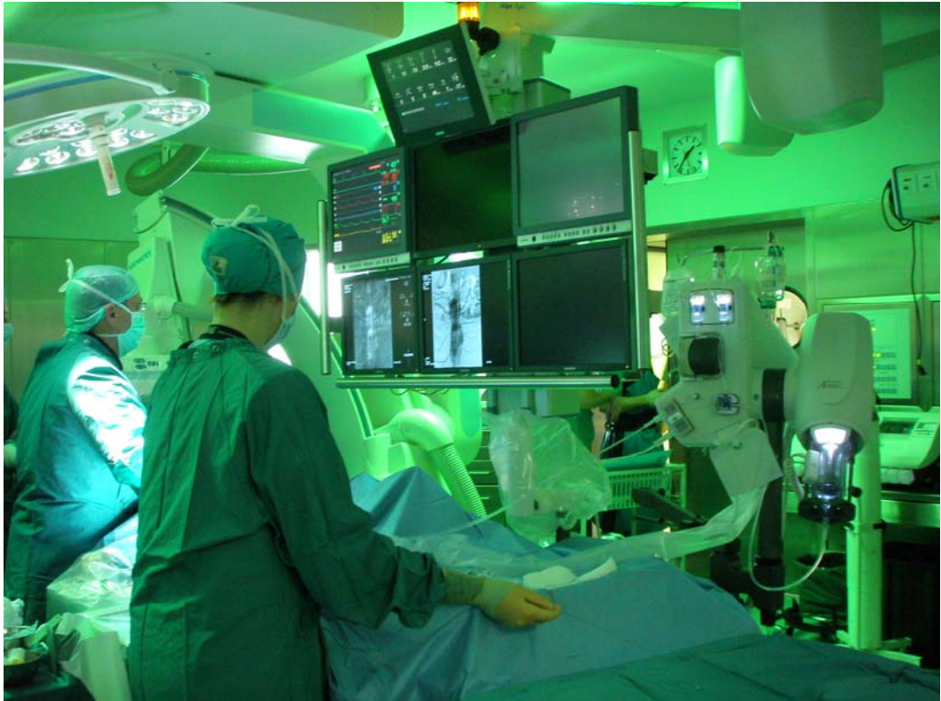
圖七 手術中需使用放射線之專用手術間