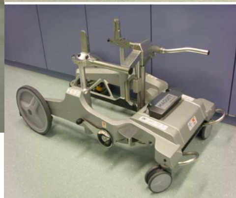
圖六 Maquet 電動床