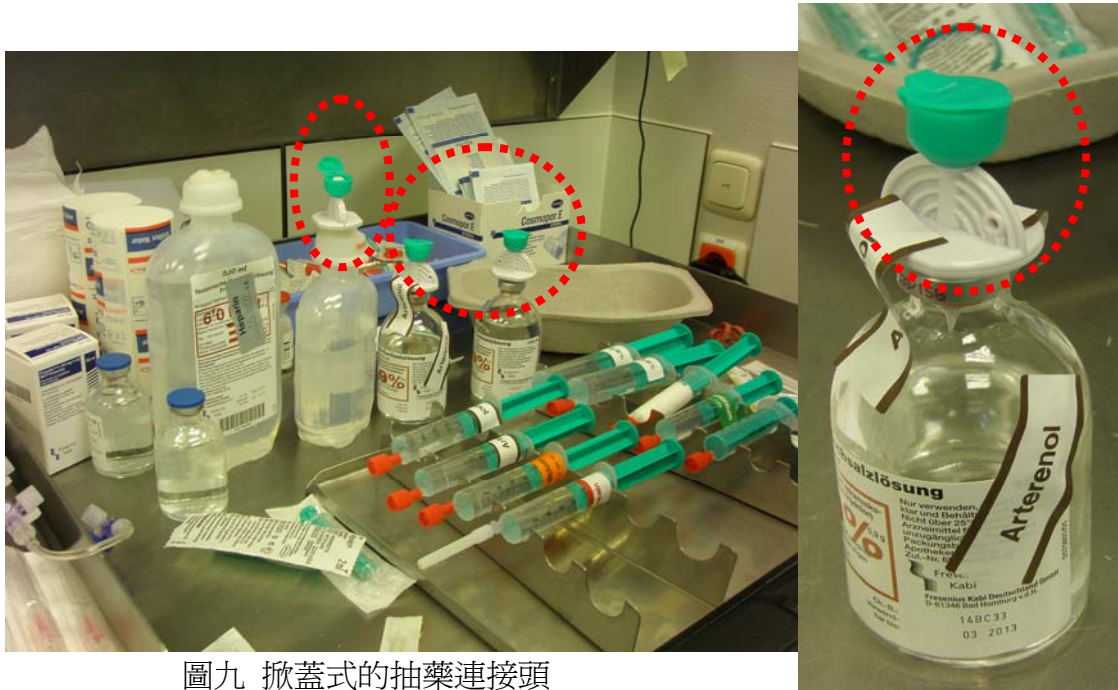
圖九 掀蓋式的抽藥連接頭

物基本量，可以省下許多準備時間及避免遺漏的產生，並能減少因重複性拆除無菌品而增加感染的機會。(圖九)