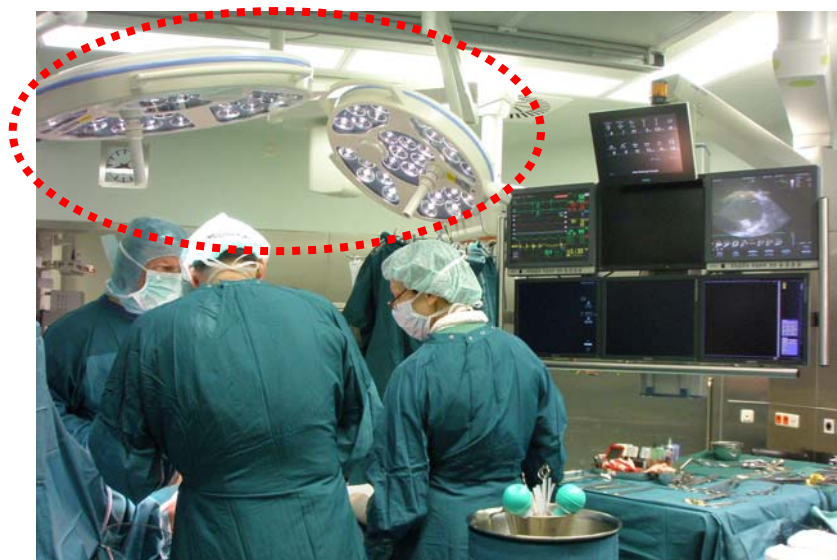
圖五 LED 手術燈