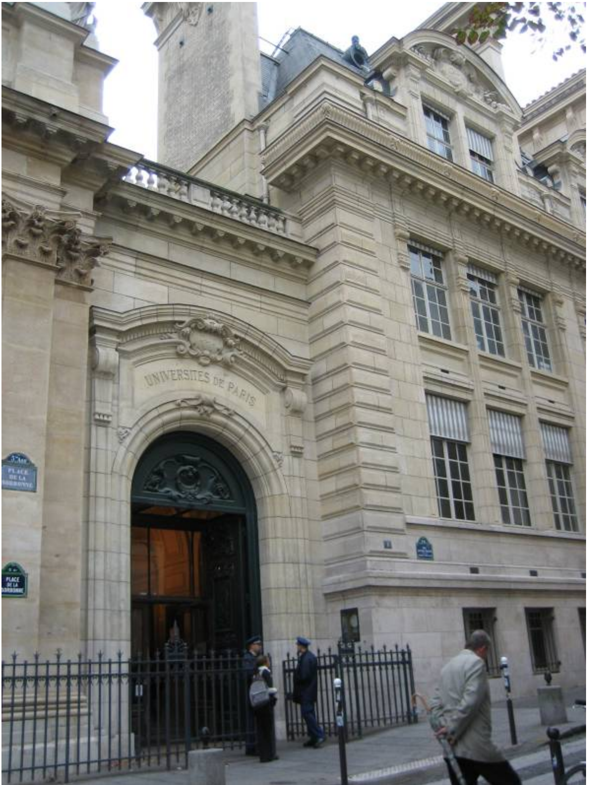
索本廣場(Place de la Sorbonne)上原巴黎大學(Universités de Paris)入口