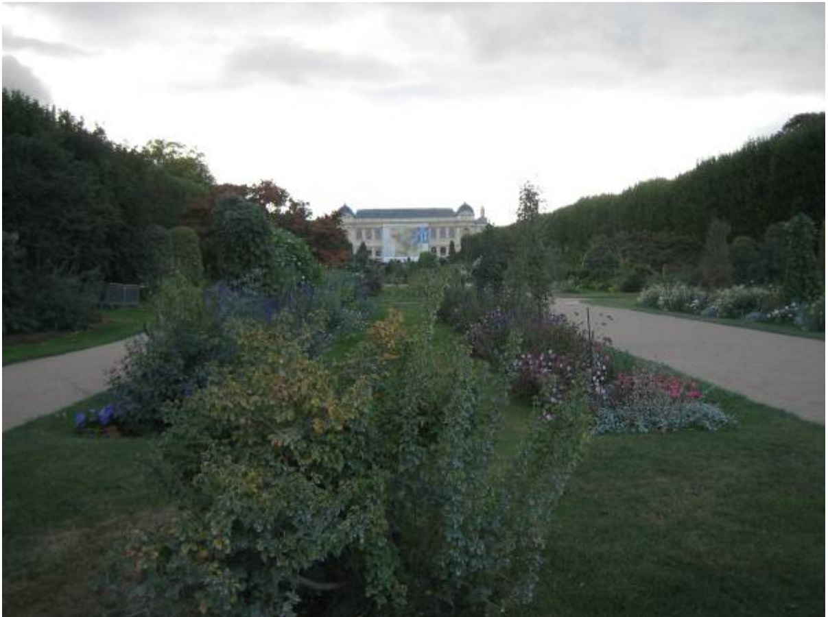
從植物園(Jardin des Plantes)遠眺國立自然史博物館演化大長廊建築