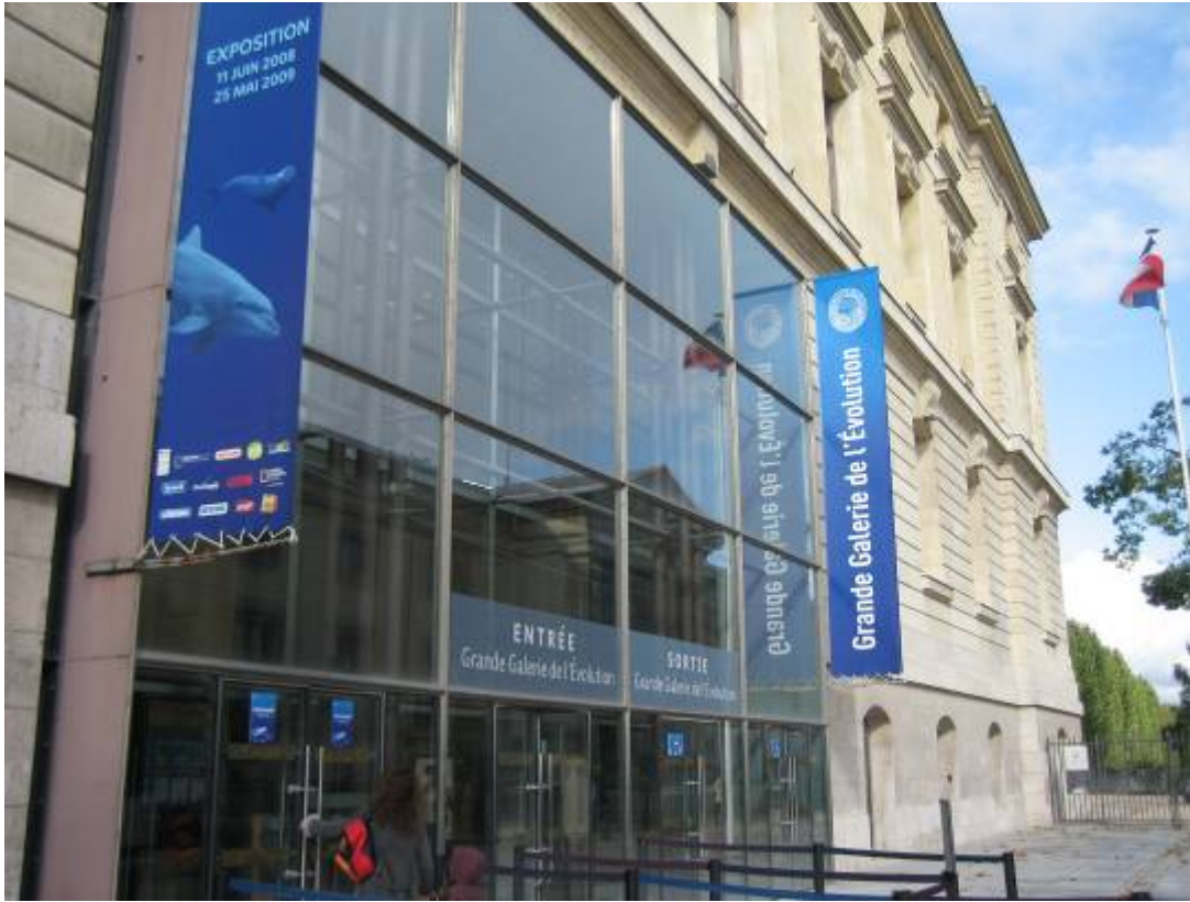
國立自然史博物館(Muséum National d'Histoire Naturelle)演化大長廊正門