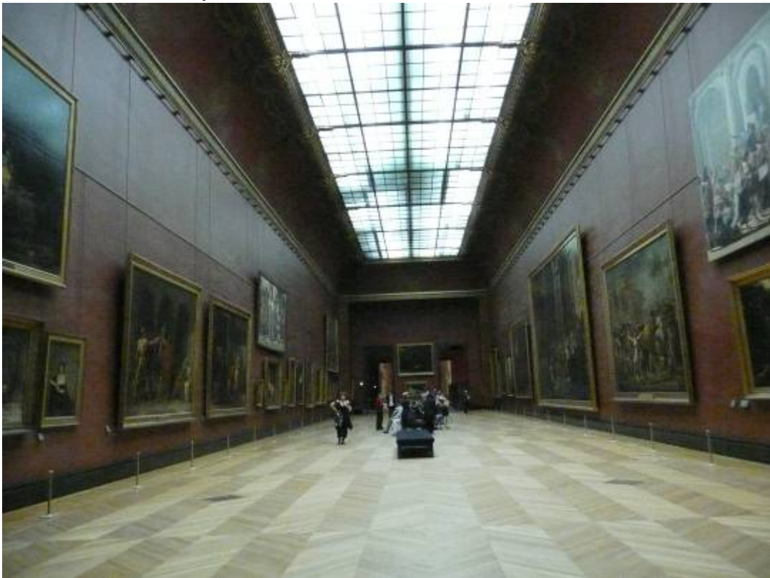
羅浮宮美術館閉館前的莫廉廳(Salle Mollien)