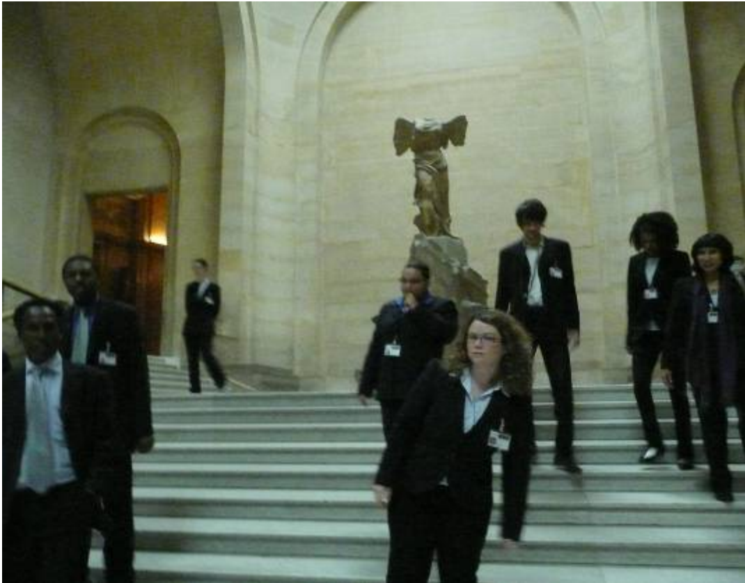
閉館前驅離觀眾的看守人員