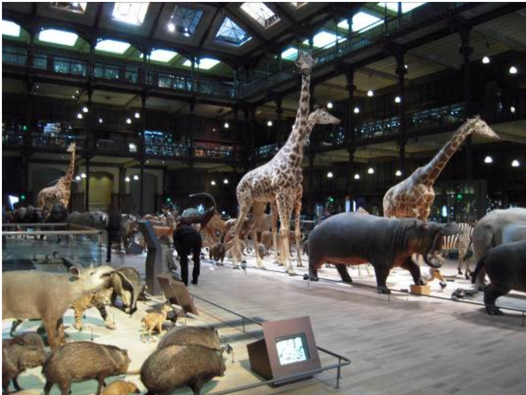
國立自然史博物館演化大長廊內部