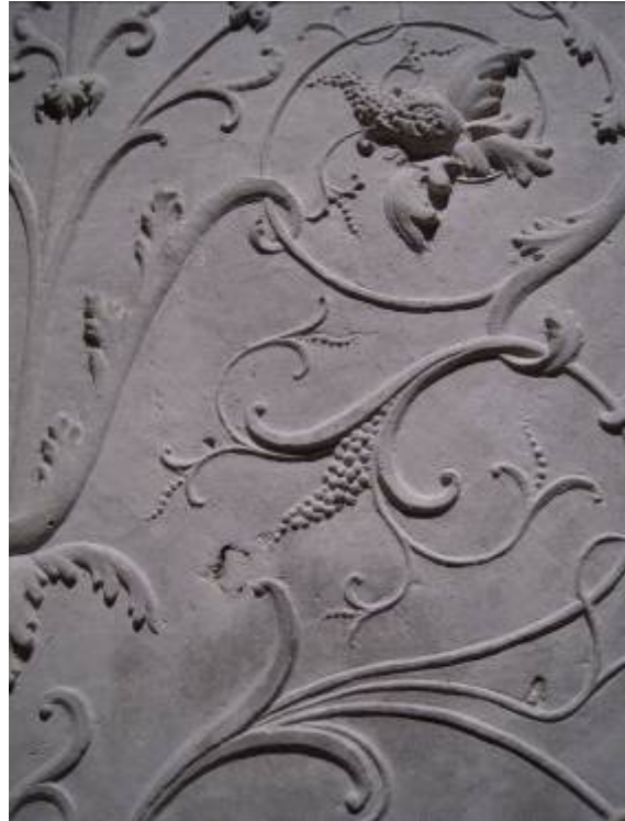
出色的照明襯托出淺浮雕的特質與作品內涵