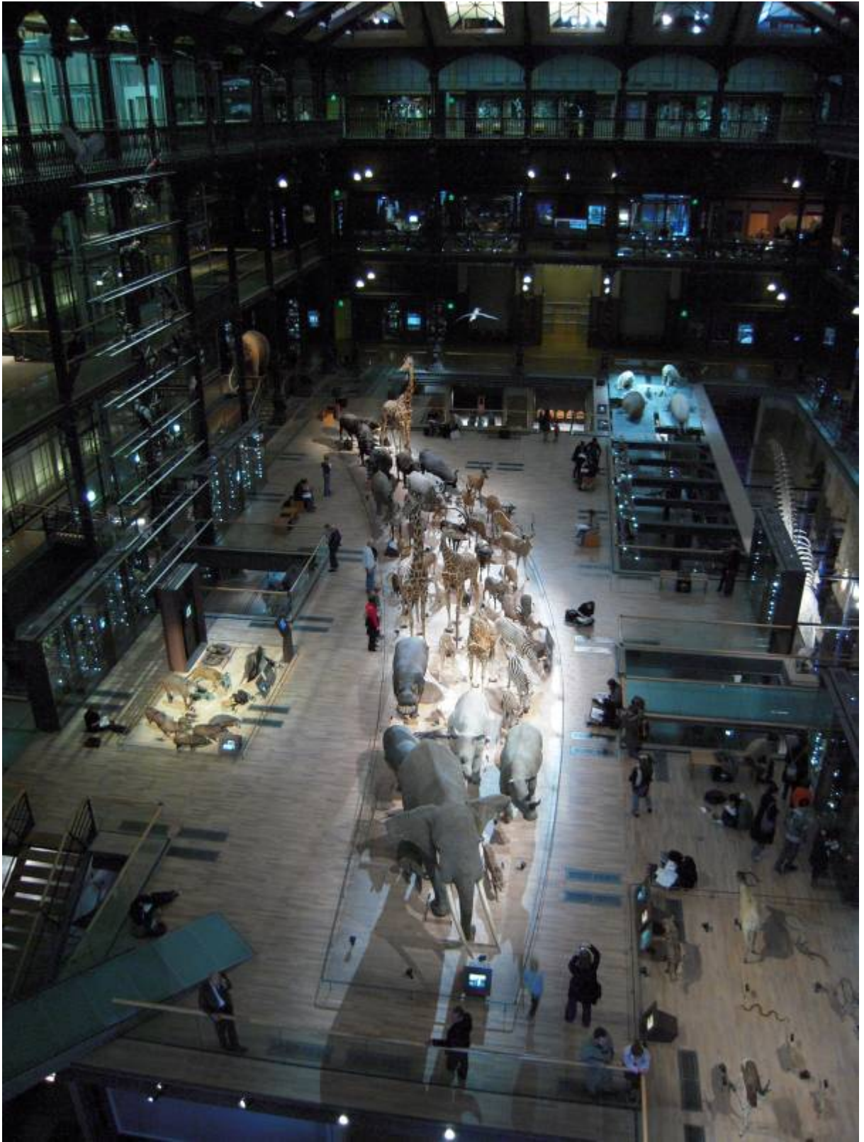
鳥瞰國立自然史博物館演化大長廊