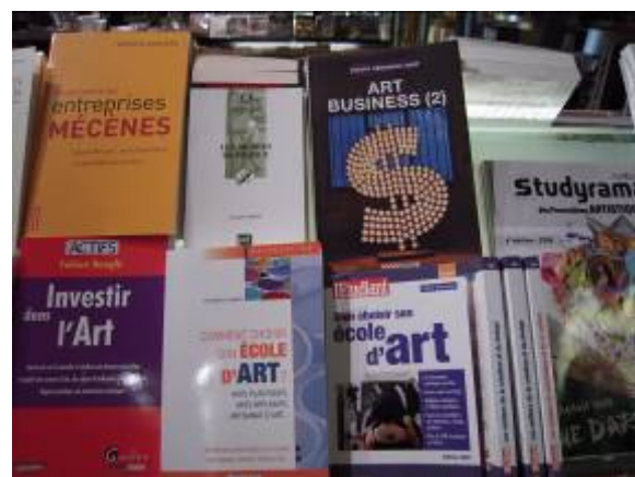
書店內「博物館學」叢書新書架上的暢銷書