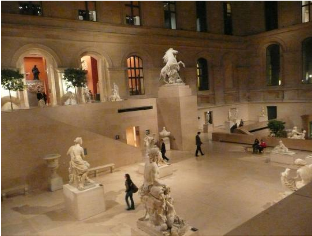
馬利中庭(Cour Marly)與十七世紀法國雕塑