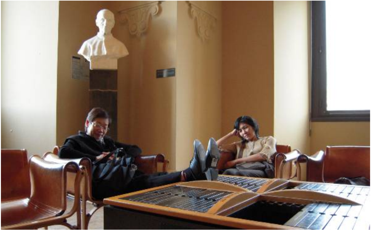
在國立自然史博物館內小憩