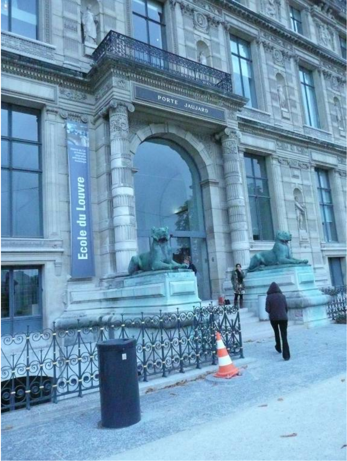
羅浮學院(Ecole du Louvre)正門