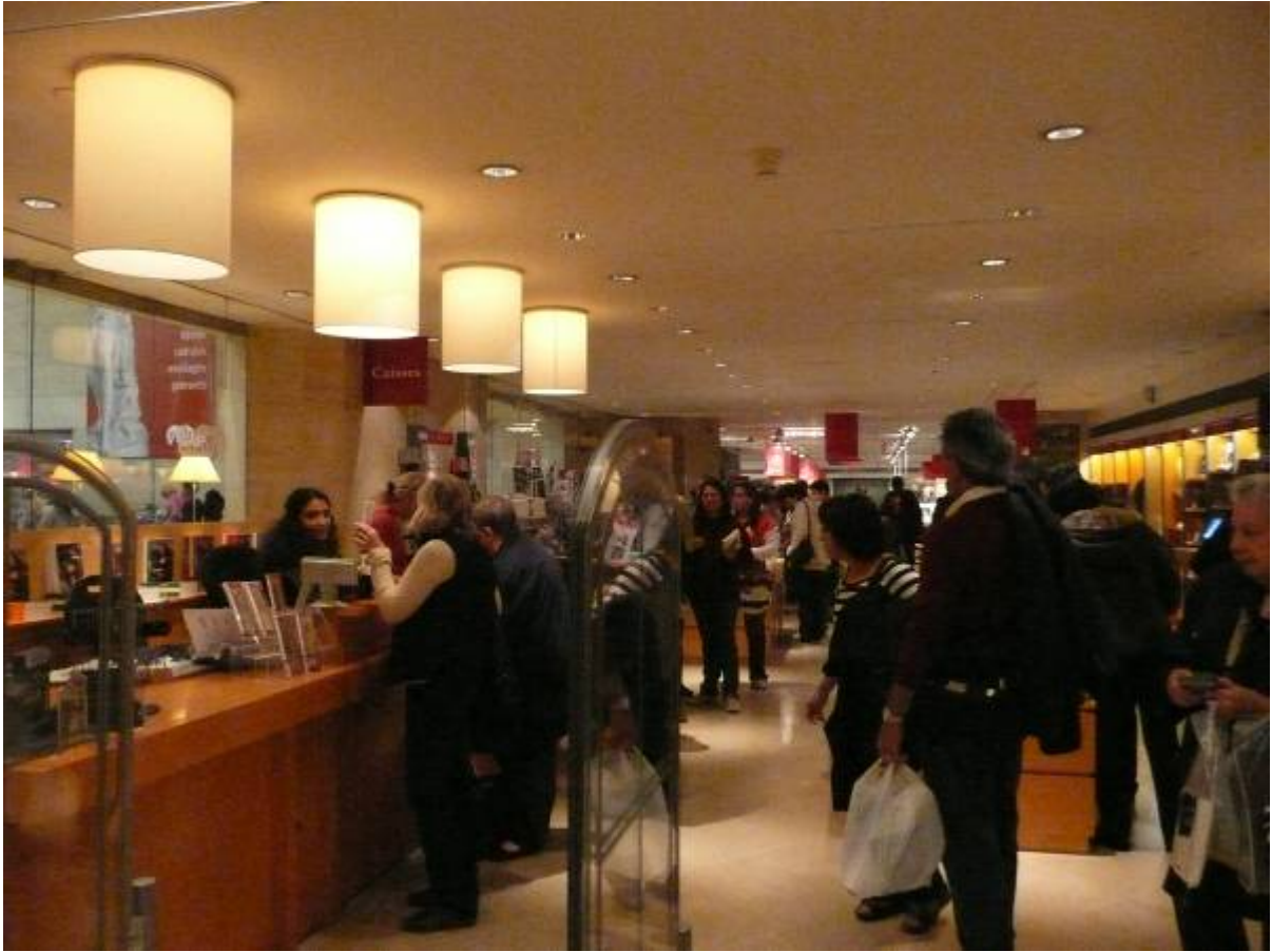
羅浮宮美術館書店一隅