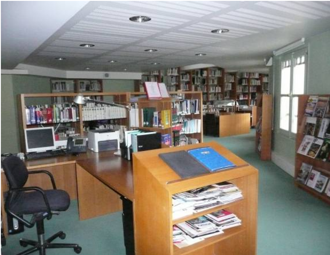
國立資產研究院文獻資源中心(Centre des Ressources Documentaires)