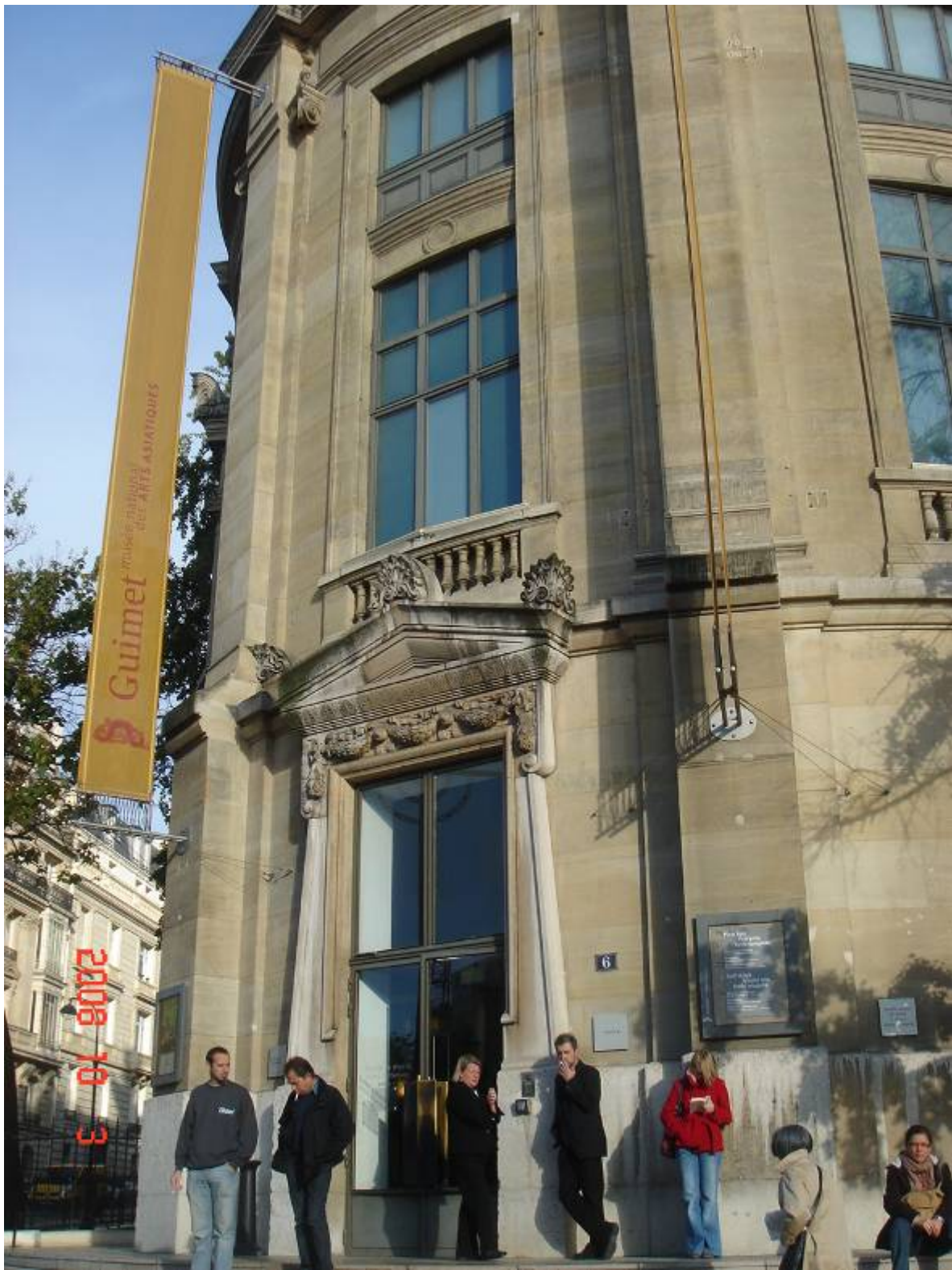
開館前的國立吉美亞洲藝術館(Guimet-Musée National des Arts Asiatiques)正門