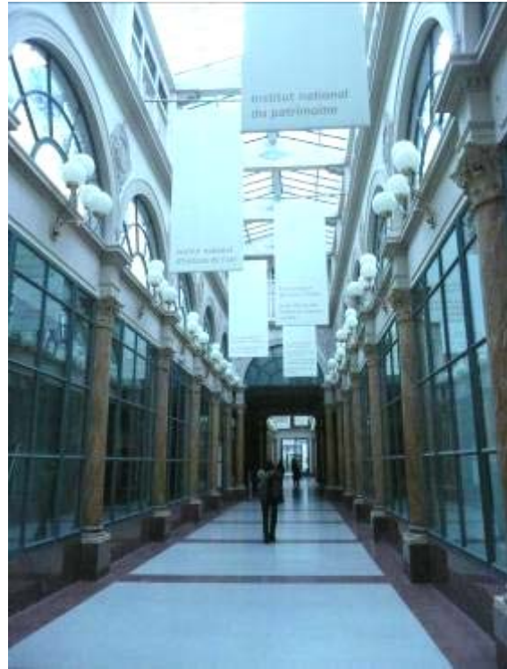
國立資產研究院(Institut National du Patrimoine)入口及走廊