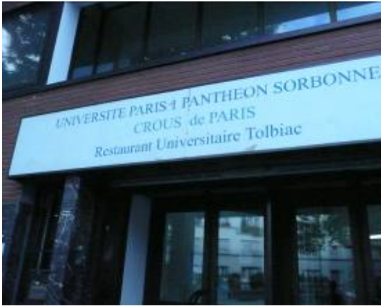
巴黎第一大學(萬神殿-索本)