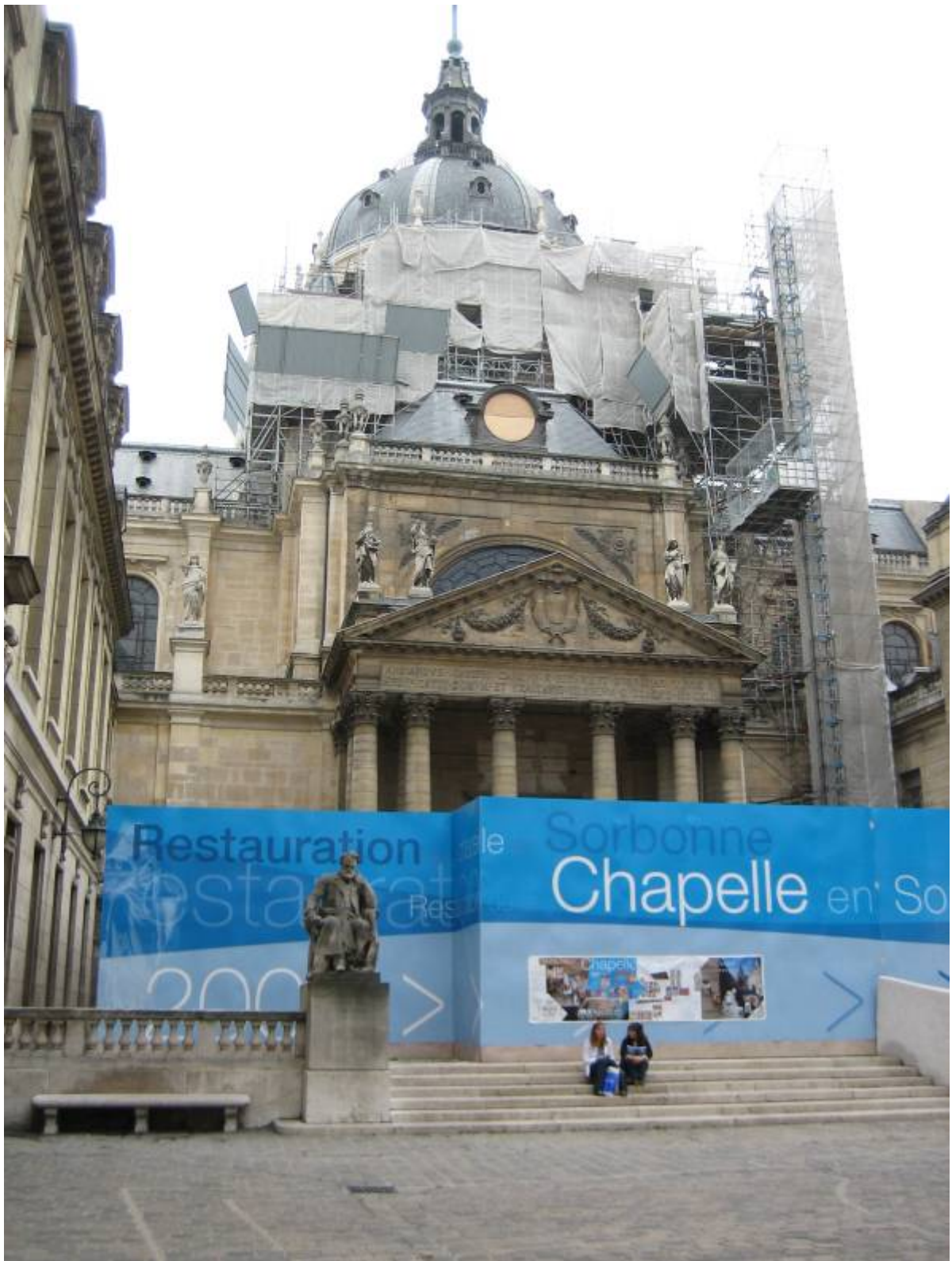
修復中的十七世紀索本小教堂