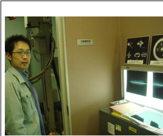
研究員作內部設施說明