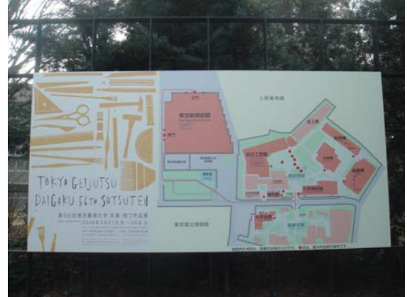
東京藝術大學校內平面設施說明牌及教授名牌