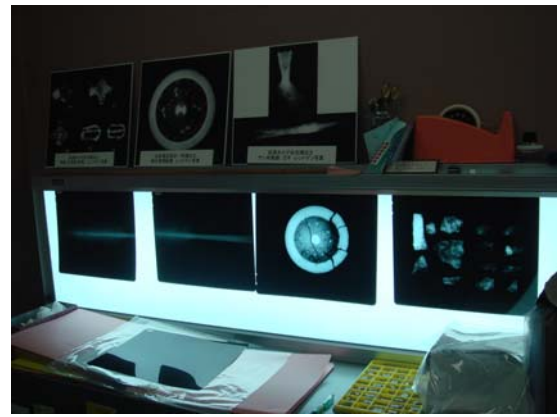
文物 3D 製作室之儀器設備