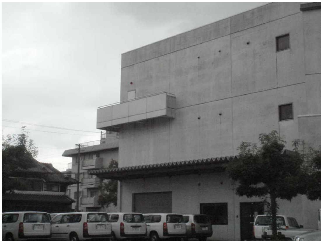
奈良縣立橿原考古學研究所