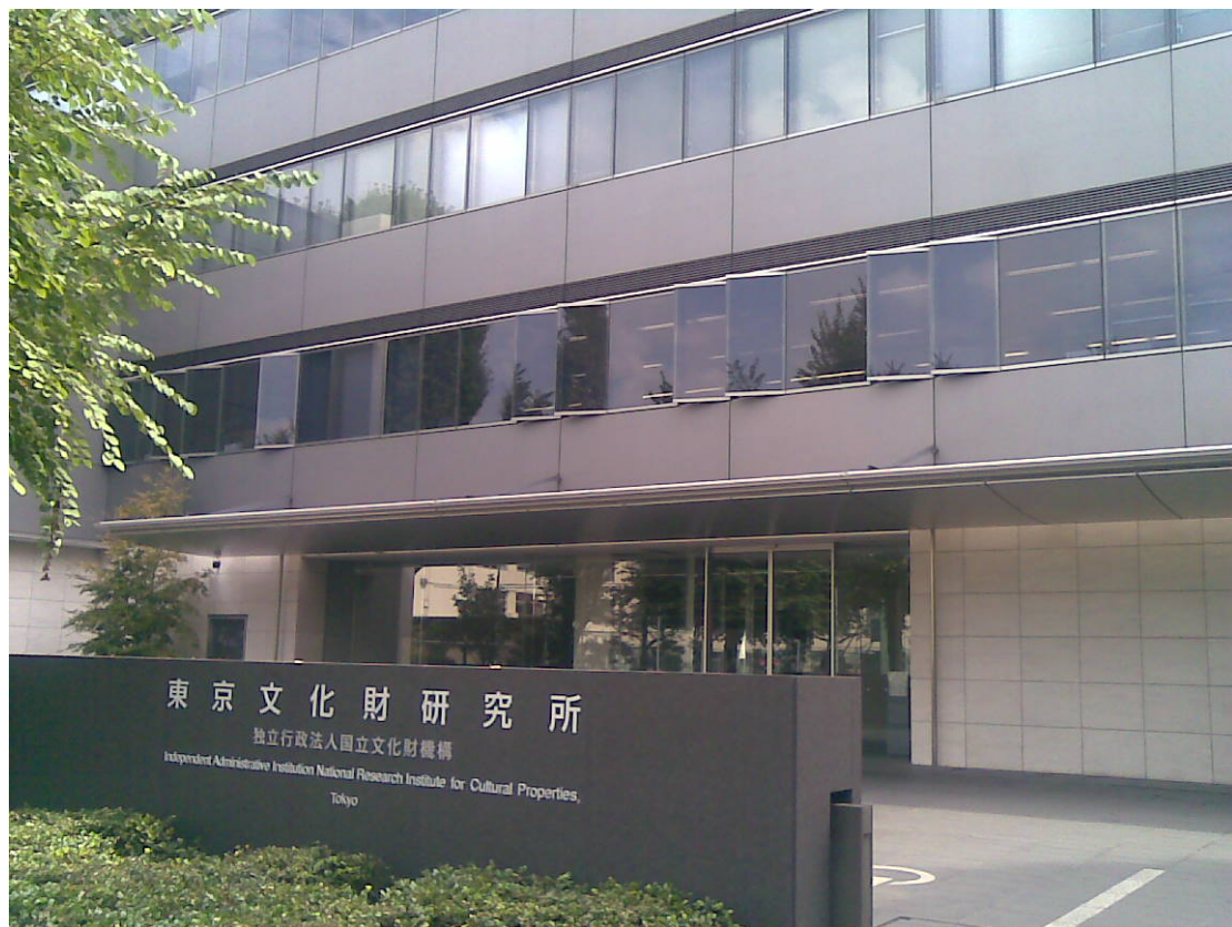
東京文化財研究所

在國際合作部份，由於議員立法的「有關關乎海外文化遺產保護的國際合作的法律」成立，要求今後推動有關進一步的文化遺產的國際合作，安排國際貢獻等。