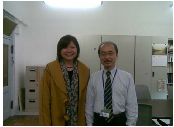
東京國立博物館教育推廣觀摩