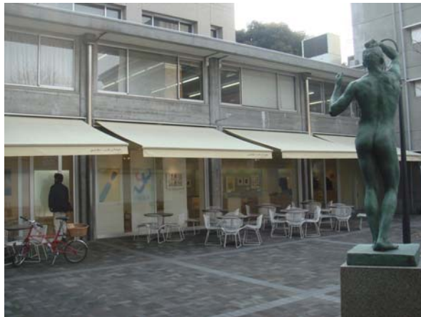
東京藝術大學附屬博物館