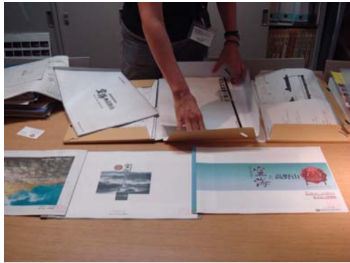
東京國立博物館特展