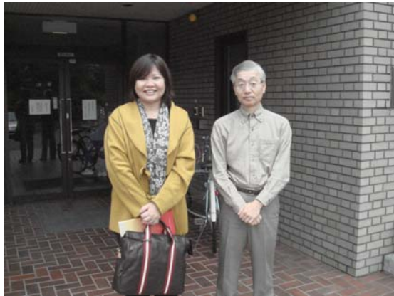
奈良縣立橿原考古學研究所