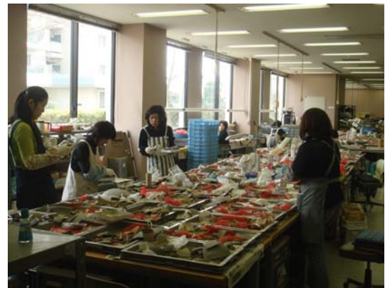
研究所的出圖文物整理區