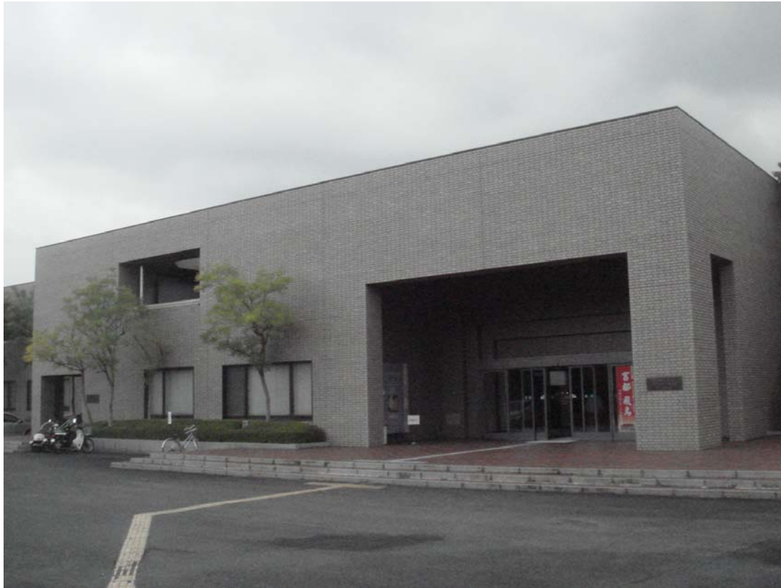
奈良縣立橿原附屬博物館