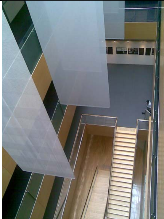
東京文化財研究所建築物正門入口