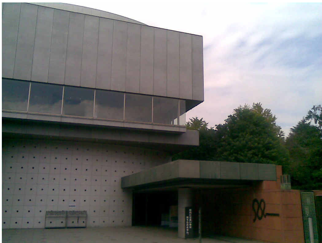
東京藝大附屬美術館

目前，雖只有「美術」和「音樂」二學部，但正在積極改革兼具成為攝影藝術（電影・動畫）、舞臺藝術（演劇・舞蹈）的綜合藝術大學。為此，除了在2005年4月設立了映像研究所（電影專業主任：北野武教授）之外，另外還設有美術研究所及音樂研究所，而現任校長為宮田亮平。