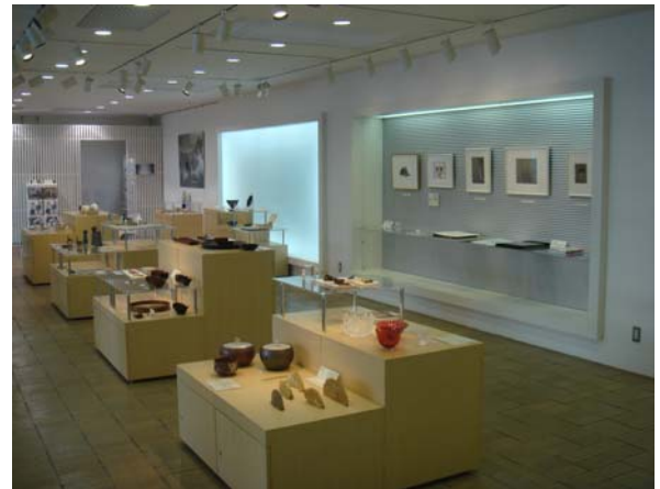
東京藝術大學附屬博物館賣店