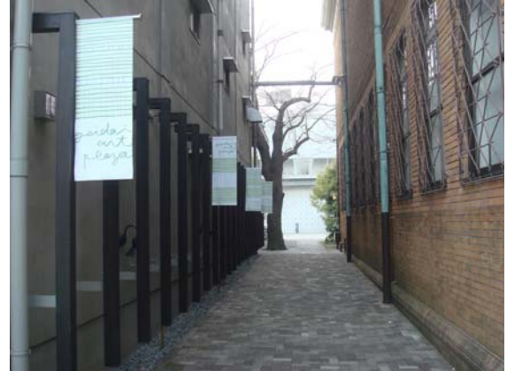
東京藝術大學校區一景