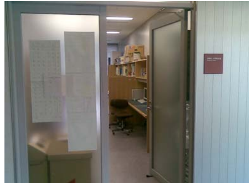
東京文化財研究所博士生研究室