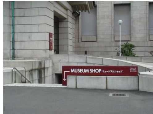
東京國立博物館全館資訊告示牌