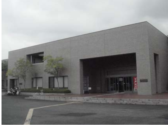
奈良縣立橿原考古學研究所附屬博物館