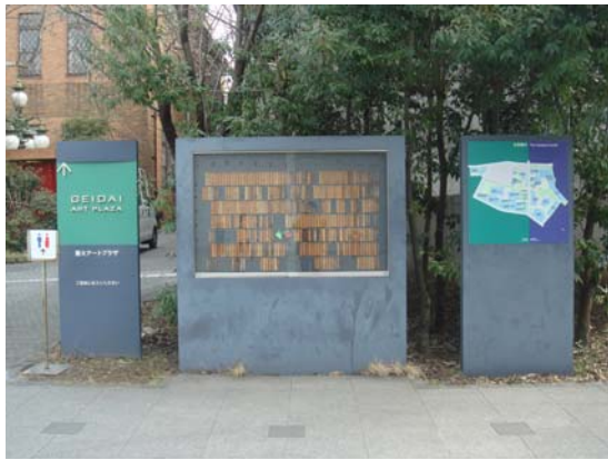
東京藝術大學附屬博物館賣店