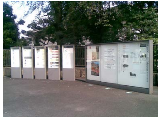
東京國立博物館捐款名錄牆