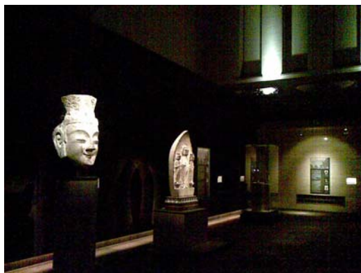
東京國立博物館本館