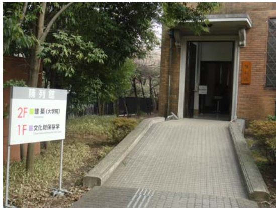
東京藝術大學附設陳列館