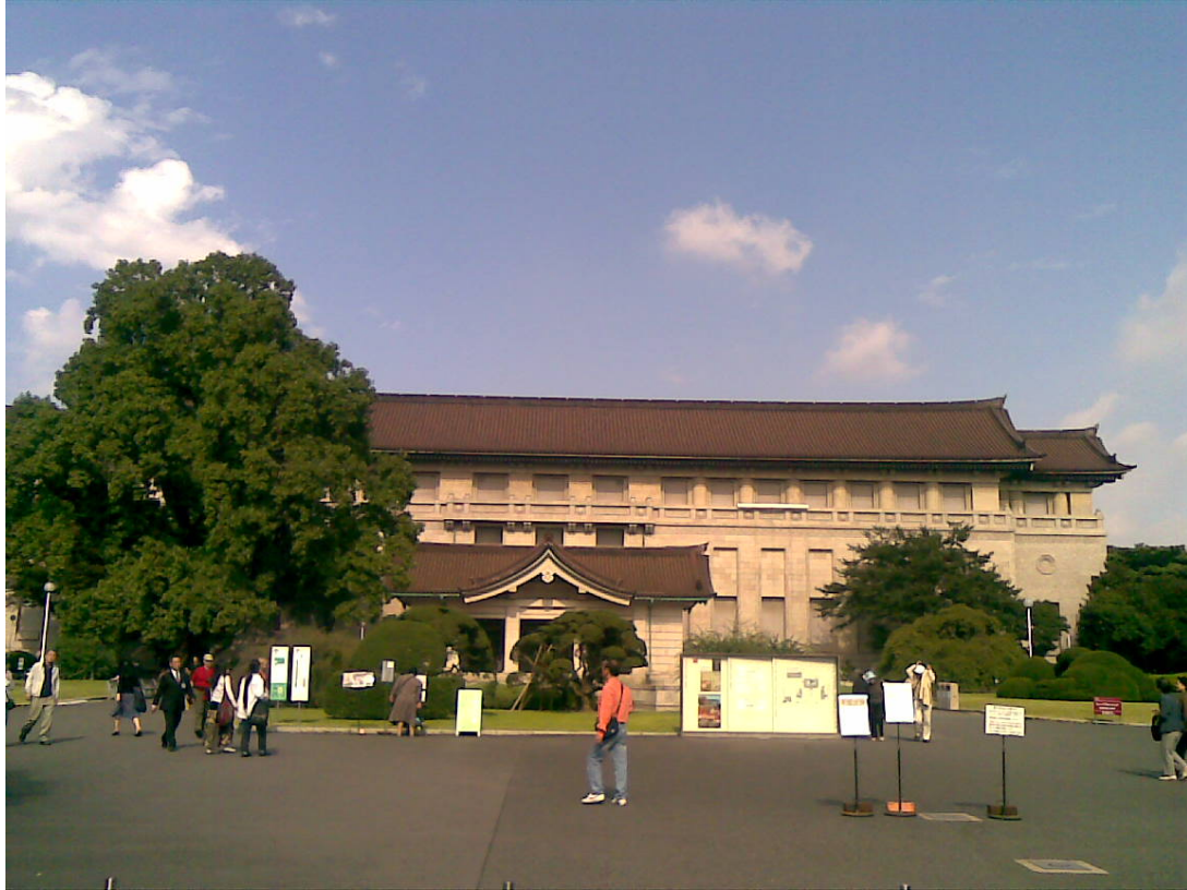
東京國立博物館本館

美術工藝和出土文物，表慶館主要為專題展覽之用途，另外還有平成館、法隆寺寶物館、黑田紀念館和資料館等。主要建築整體風格為明治時代的洋式建築，同時擁有日式風格的展館。