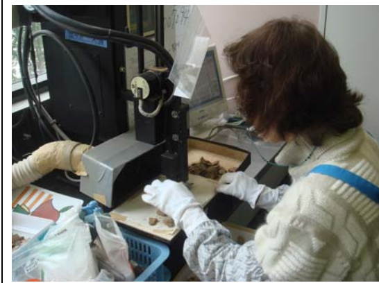
研究所的出圖文物編號區