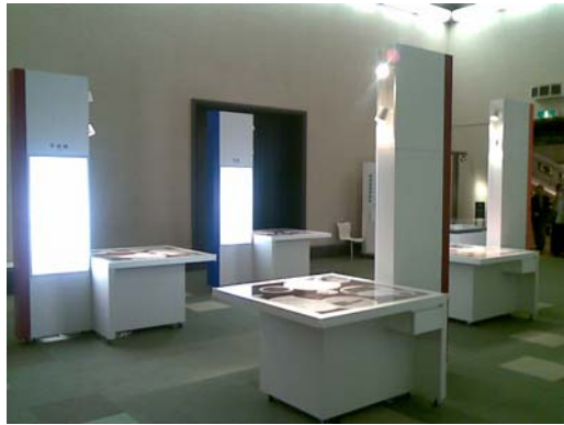
東京國立博物館特展