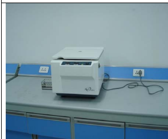
圖 14 生理實驗室儀器 (二)