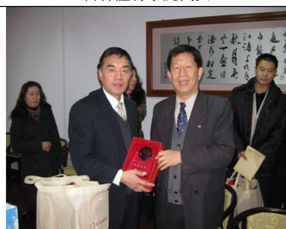
圖 8 兩校座談會(三) 交換見面禮