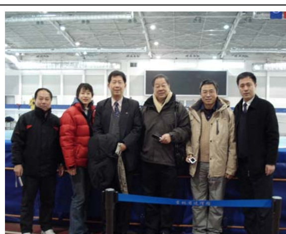
圖 2 速滑館