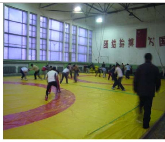
圖 24 角力館