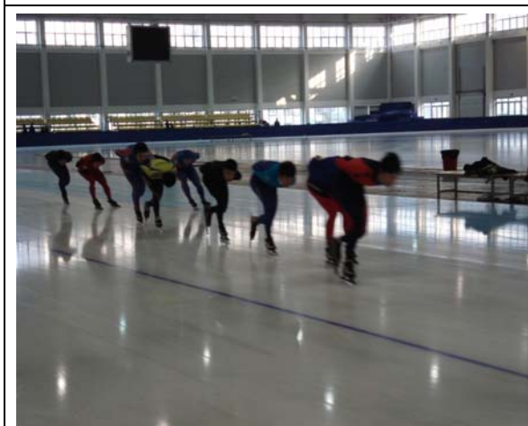
圖 3 競速滑冰訓練