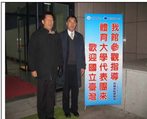
圖 11 參訪吉林體院場館(一)