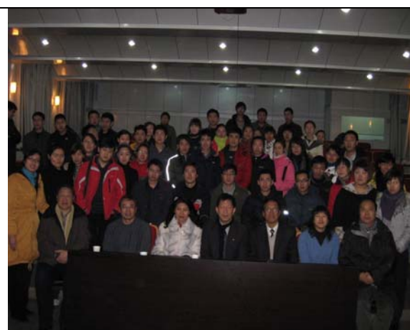
圖 18 研究所學術交流座談會(六) 大合照