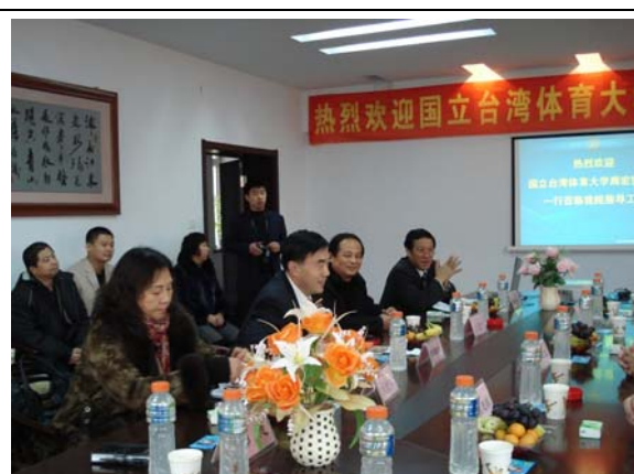
圖 6 兩校座談會(二) 吉林體育學院代表