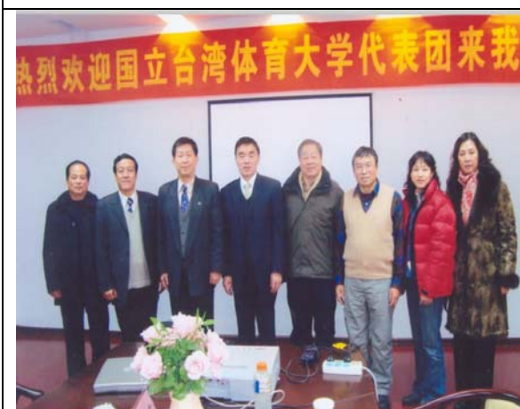
圖 9 兩校座談會(四) 兩校一級長官大合照