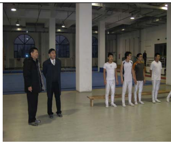
圖 12 參訪吉林體院場館(二) 體操館