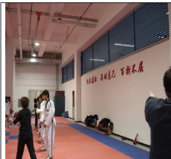
圖 19 跆拳道館