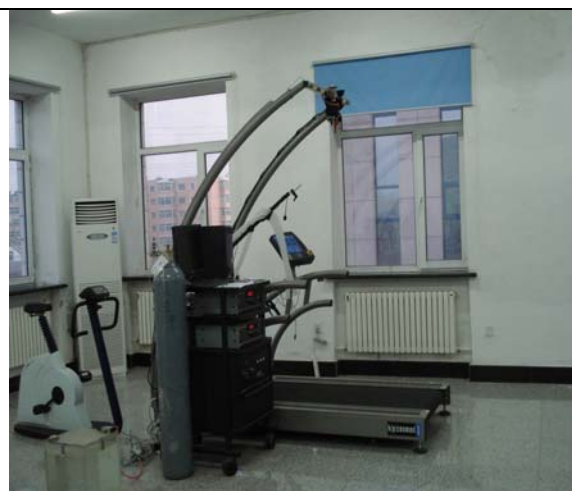
圖 13 生理實驗室跑步機 (一)