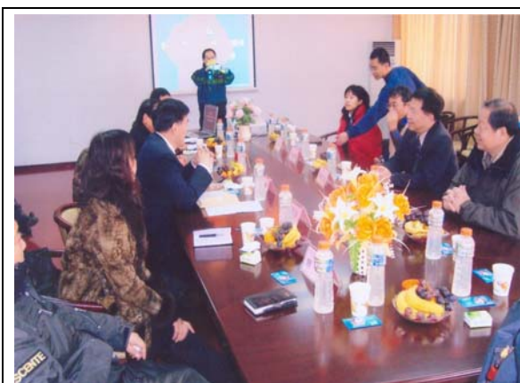
圖 5 兩校座談會(一)