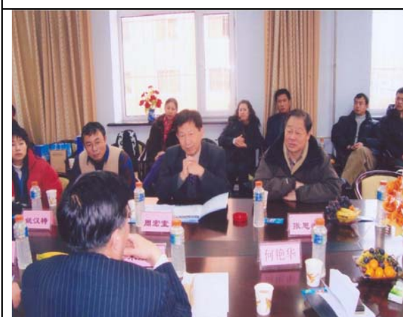
圖 7 兩校座談會(二) 我方代表