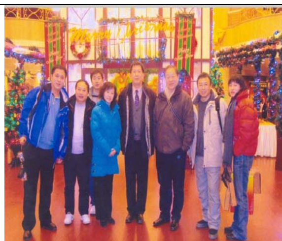
圖 18 錢行大合照