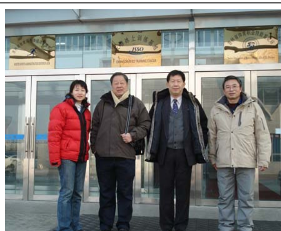
圖 4 滑速館場館