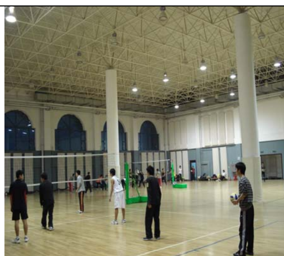
圖 22 排球館