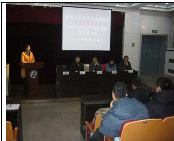
圖 16 研究所學術交流座談會(一)