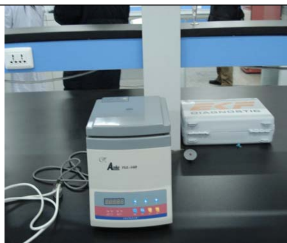
圖 15 生理實驗室化驗儀器 (三)