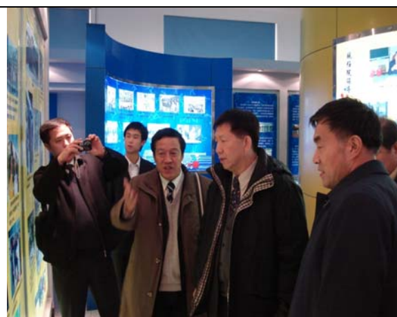
圖 10 參訪吉林體育學院校史館