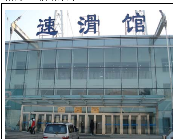
圖 1 速滑館