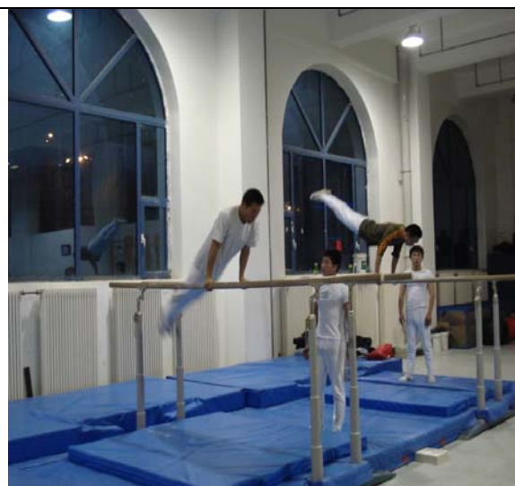
圖 20 體操館