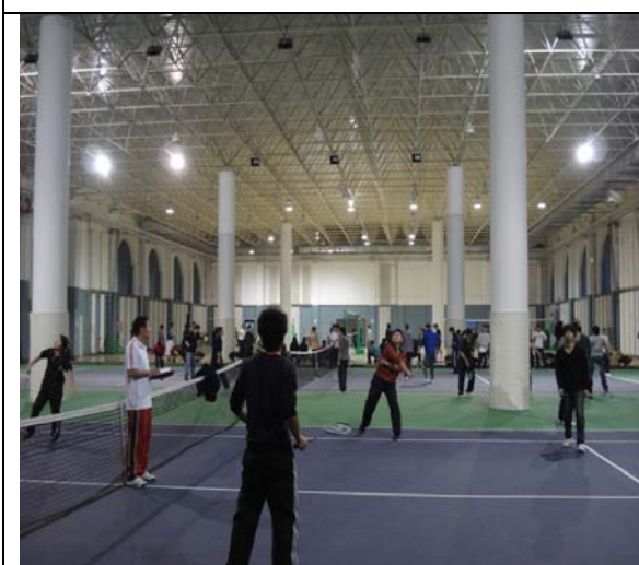
圖 21 羽球館