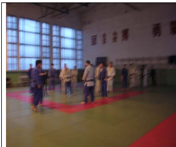
圖 17 柔道館