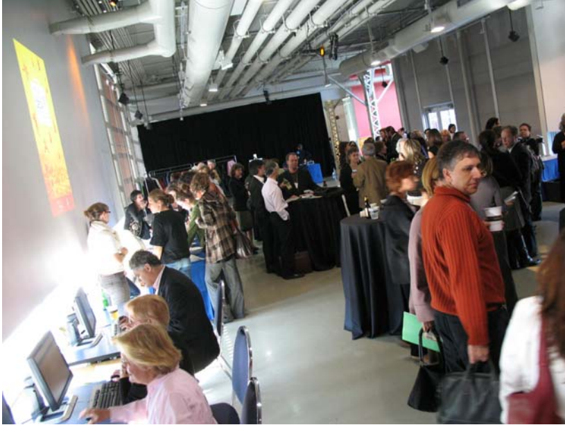
CECA年會與會者在上下午中場休息時間進行交流。