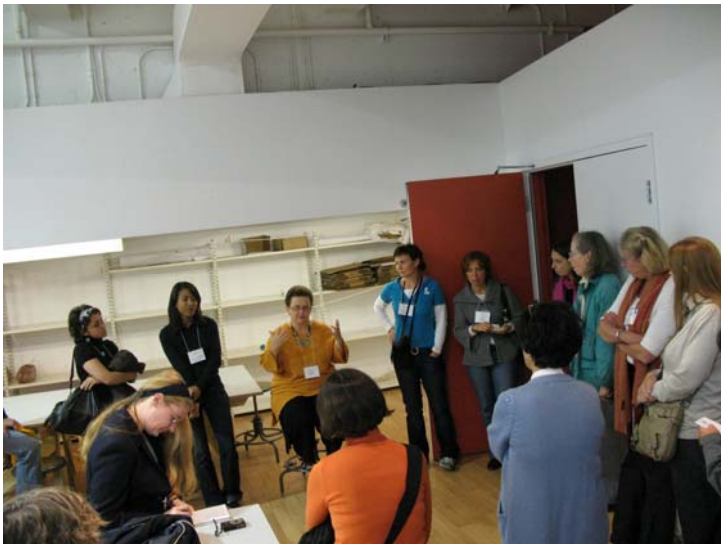
CECA與會者在Montreal美術館就美術館教育專業議題進行個案分享討論。