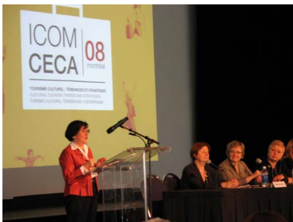
CECA 主席 C. Dufresne-Tasse 女士致詞

CECA 年會為國際博物館教育界重要會議，與會人士包括來自美國、加拿大、中南美洲、澳州及歐洲的學者與博物館教育相關專業人員，此次會期自 9 月 29 日起至十月 3 日，於加拿大 Montreal 科學中心會議廳舉行。3 日早上報到後，隨即參加開幕儀式；Montreal 市長、Montreal Museum of Archaeology and History 館長、Old Port of Montreal Corporation 執行長、觀光相關政府機構代表以及 CECA 主席 C. Dufresne-Tasse 女士分別致意，接下來即展開為期五天的會議活動，共有來自 31 國家會員與會、55 場專題及實務案例發表(會議議程請參見附件一)。此外，與會者在大會安排下每天會後至相關機構進行參訪交流。