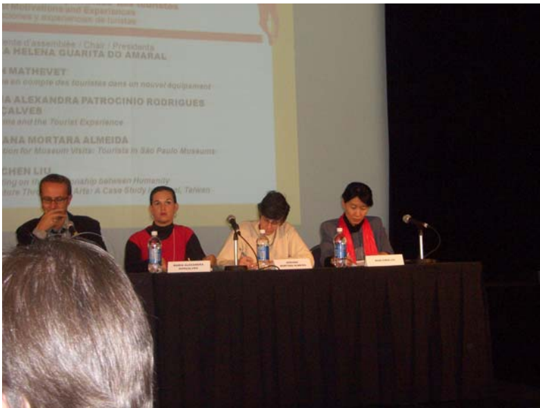
本人(右一)於2008年CECA研討會中發表論文。

本人參與發表及討論的場次於 10 月 2 日下午 2:00-3:30 舉行。本人以「透過藝術省思人文與自然的關係：台灣個案」(Reflecting on the Relationship between Humanity and Nature Through the Arts: A Case Study in Taipei, Taiwan)為題，在研討會中以被文建會列為地方特色館的「台北市關渡自然公園」為例，說明戶外型暨自然環境的博物館如何透過視覺藝術、表演藝術及音樂，針對特定觀眾群以藝術為觸媒及策略聯盟方式發展博物館新面貌。與會者在本論文發表後進行問與答的討論，與會者對目前台灣的情形多表關切與好奇，會議結束後部分與會者仍持續與本人交換資訊與心得。