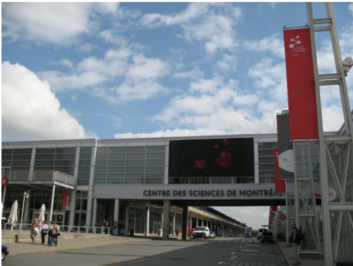
2008CECA研討會會址：加拿大Montreal 科學中心

CECA研討會於十月三日中午結束，本人於會議結束後當天傍晚搭機至加拿大西岸溫哥華，於十月四日及五日進行相關參訪交流活動，十月六日凌晨搭機回台，於十月七日上午抵達桃園機場。