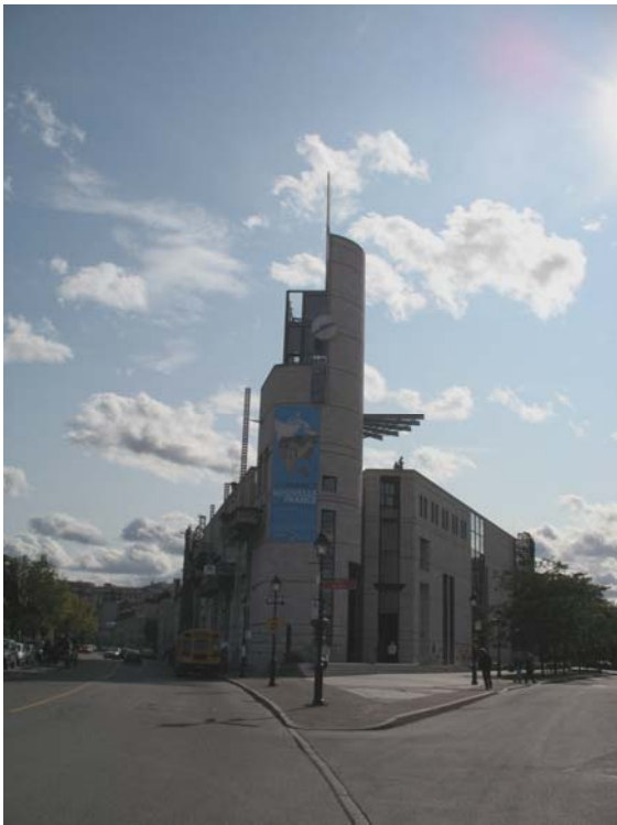
加拿大Montreal考古暨歷史博物館