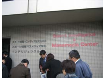
體育情報案科參觀情形