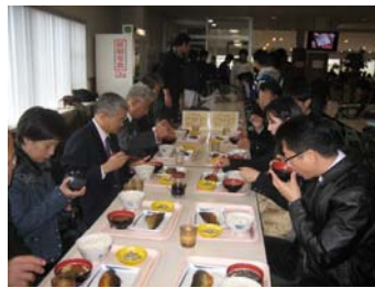
享用 B 餐實況