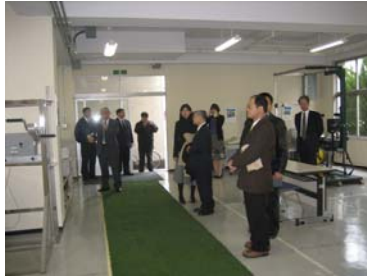
健康福祉科參觀情形