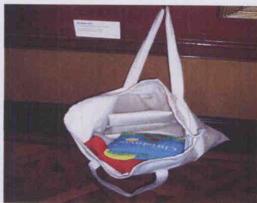
圖：為兒童設計的體驗式教材

籍或文物（例如，畫作為海及沙灘，則有到海邊遊玩的書籍、挖沙玩具等），可讓小朋友自行取出，做為了解畫作的輔助；該館也積極採取讓博物館走出去的策略，設計有英國博物館常見的文物箱 loan box 4 個，每個文物箱各有主題，如維多利亞時代的玩具、或二次大戰等，箱內文物價值不高，但有豐富的故事性，因此很受學校老師歡迎，也可讓平常對博物館不熟悉或不方便前來參訪的觀眾，對博物館有了另一類的接觸。