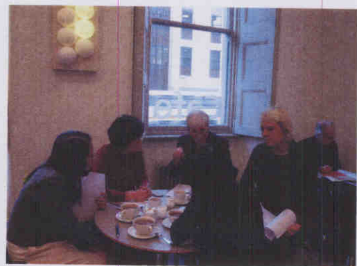
圖：與館長及西北部經理座談