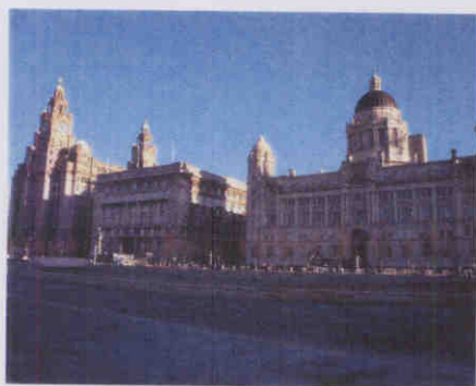
圖：利物浦重要地點：三女神

其中「碼頭頂」可說是利物浦最重要的地標，其上有三棟建築物沿 Mersey River 北岸興建，一般稱為三女神(Three Graces)；照片上由左至右分別為：皇家利物浦大樓(Royal Liver Building)、康諾德大樓(Cunard Building)和利物浦港大樓(Port of Liverpool Building)。皇家利物浦大樓於 1911 年完工，鐘塔上兩隻大鳥是利物浦的吉祥物，分別守候利物浦港、市，現在是皇家利物浦保險公司的總部，屬英國一級古蹟。康諾德大樓於 1916 年完工，本是康諾德船運公司的總部，現為二級古蹟。利物浦港大樓完工於 1907 年，也是二級古蹟，是原來船塢港口理事會(Mersey Docks and Harbour Board)的辦公室，利物浦所有船隻都得在此註冊登記。此三建築正面面對 Mersey 河，河岸邊矗立多座紀念碑，建築物背面則正式進入利物浦市，有便利的大眾運輸工具，因此是許多大型活動的集合場所，造訪當天就有利物浦一年一度的聖誕慈善馬拉松在此舉行，此活動亦是利物浦規劃為 2008 年歐洲文化首都系列活動之一。