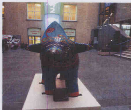
圖：迷你香蕉羊曼蒂曼陀羅

The Beat Goes On 和 Only a Game? 兩展區則分別探索、呈現、回顧對利物浦認同及形象形塑最重要的音樂與足球，利物浦出身的歌手曾多次拿下英國流行歌曲排行榜冠軍，是英國人心目中最具音樂感的城市，並且獲金氏世界紀錄封為流行音樂之都 (City of Pop)。「The Beat Goes (2008 年 7 月至 2009 年 11 月)不停歇的拍子」是利物浦首次舉行的音樂回顧展，以大量互動裝置，完整呈現過去 60 年來，披頭四、原子少女貓等樂手的輝煌成績，並於網站提供線上點唱及 1945 年至今的文獻資料；在足球方面，利物浦擁有利物浦足球隊及艾佛敦足球隊兩支勁旅，其中利物浦足球隊是歐洲足球冠軍杯爭霸戰的五度冠軍得主，戰績顯赫，每年到利物浦足球場朝聖的球迷，為該市帶來不少收益；而足球是歐洲最受歡迎的運動，「Only a Game? 只是一場球賽」(2008 年 10 月至 2009 年 4 月)試著探討歐洲足球文化，如跨國球員、種族歧視、慶祝參與等，是由利物浦世界博物館、英國國立足球博物館、歐洲足協總部等單位聯合製作。