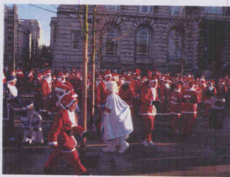
圖：聖誕慈善馬拉松活動現場

在利物浦港大樓附近不過幾百公尺處，是利物浦另一處世界文化遺產指定地：亞伯特船塢 (Albert Dock)。亞伯特船塢建於 1846 年，是英國第一座只用生鐵、磚石所建船塢，因完全沒有使用木料建材，被稱為世上第一個不易燃船塢，船隻可直接開入，在庫房邊裝卸貨物，是當時最先進的設計；但在 19 世紀後期，蒸氣汽船取代傳統動力的船後，這樣的設計卻成