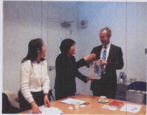
圖：致贈本會地方文化館套書