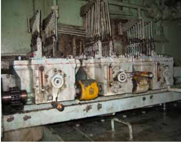
主機大缸油注油器