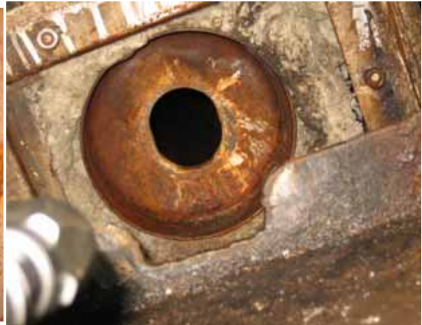
BOILER CHEMICAL FLUSHING 完成