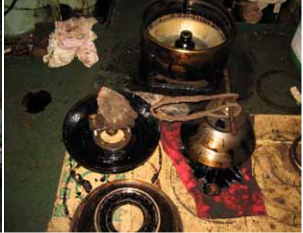
#2 號燃油淨油機分解清洗