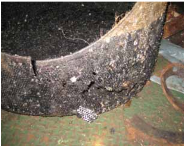
High level sea chest strainer