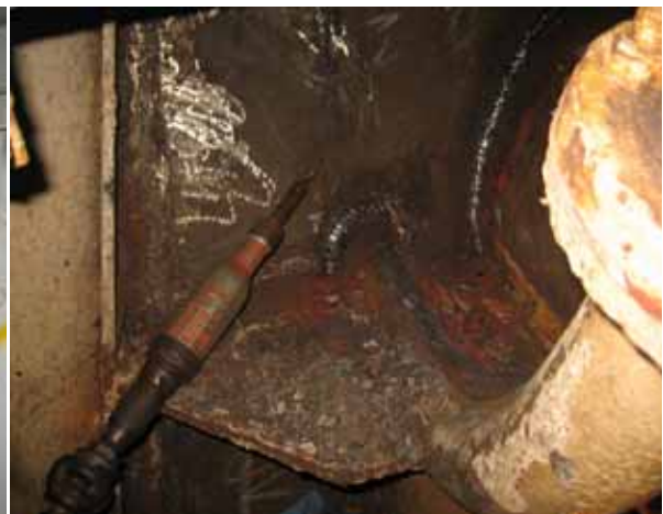
船殼隔板電焊修補完畢