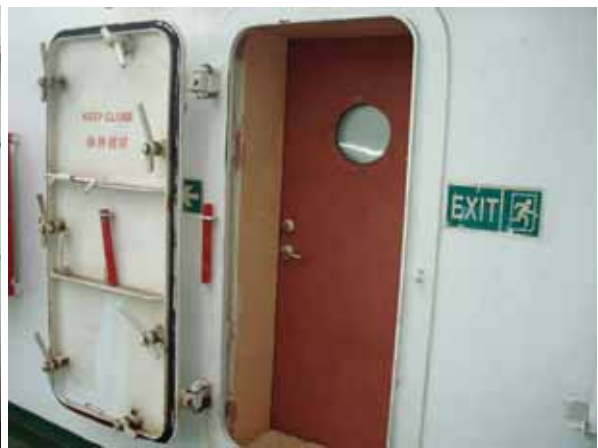
BOAT DECK 門更新