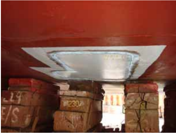
FPT SHELL PLATE