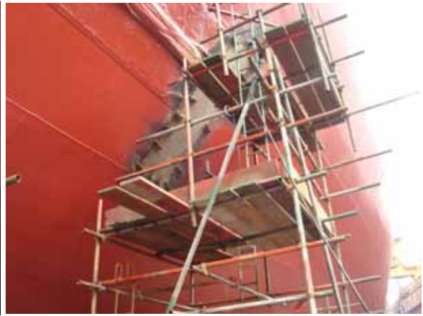
E/R SHELL PLATE