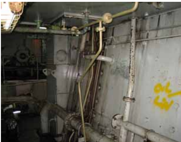
M/E DRAIN PIPE