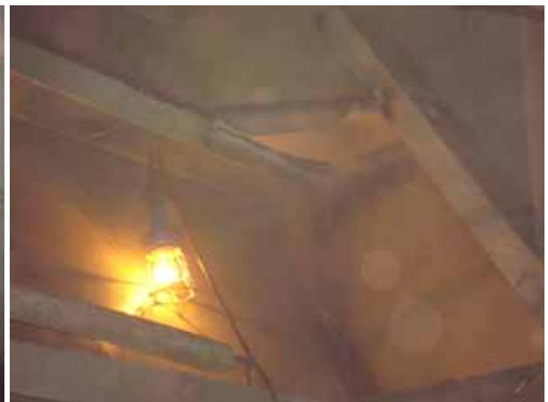
AFT STEEL WORK