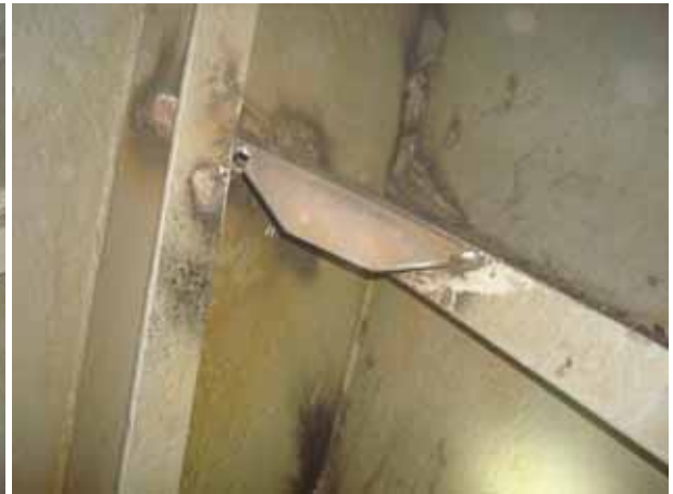
AFT STEEL WORK