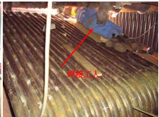
Boiler furnace wall tube top 安裝