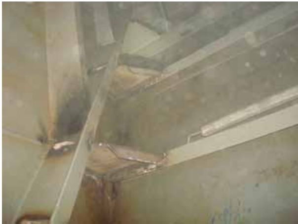
AFT STEEL WORK