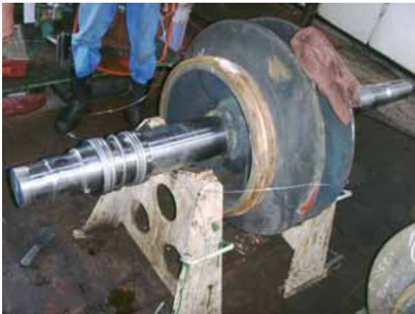
CARGO PUMP 組裝