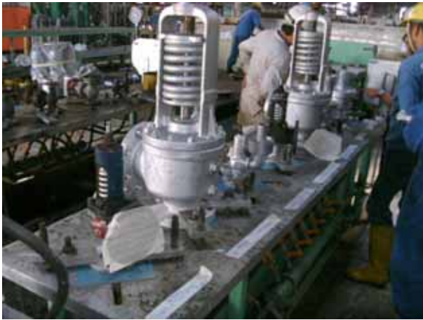
Boiler safety valve pressure test