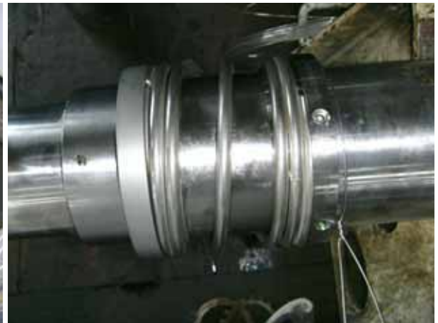
CARGO PUMP 機械軸封安裝