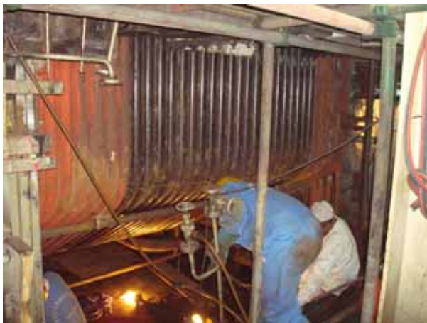
Boiler furnace wall tube bottom 安裝