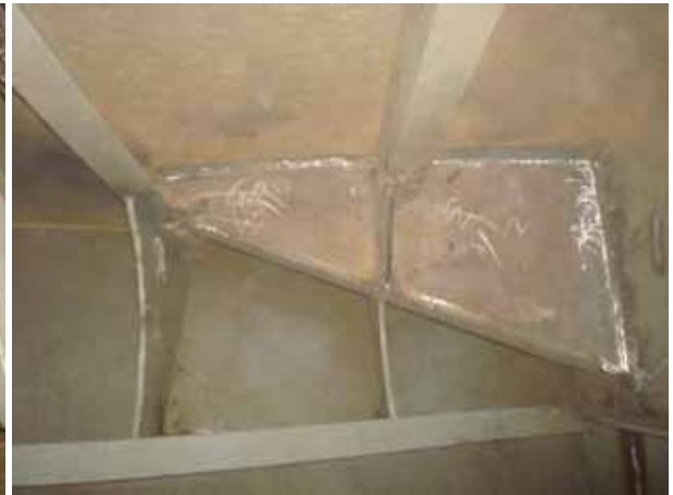
AFT STEEL WORK