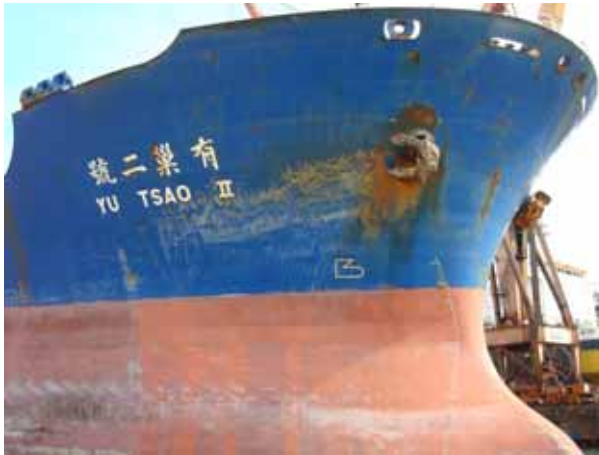
entrance docking gate