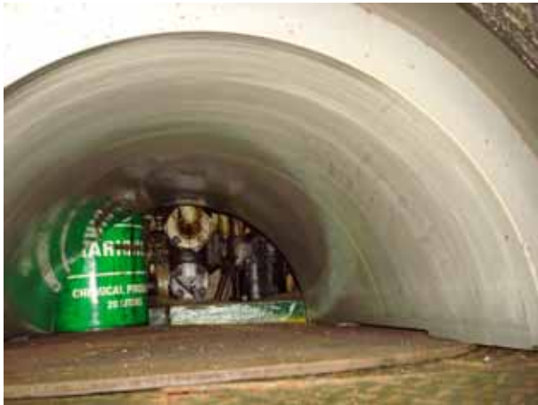
INTERMEDIATE SHAFT BEARING