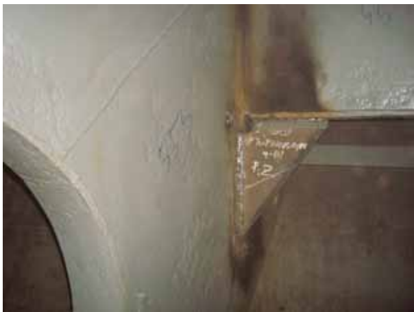
AFT STEEL WORK