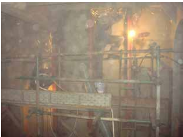
AFT STEEL WORK