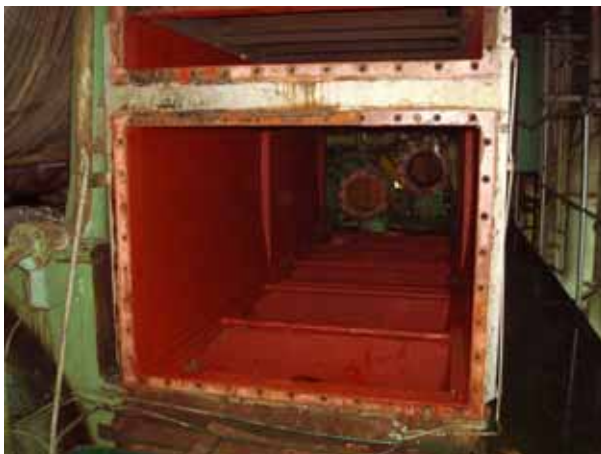
Air cooler chamber 除鏽油漆