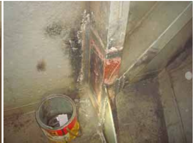
AFT STEEL WORK