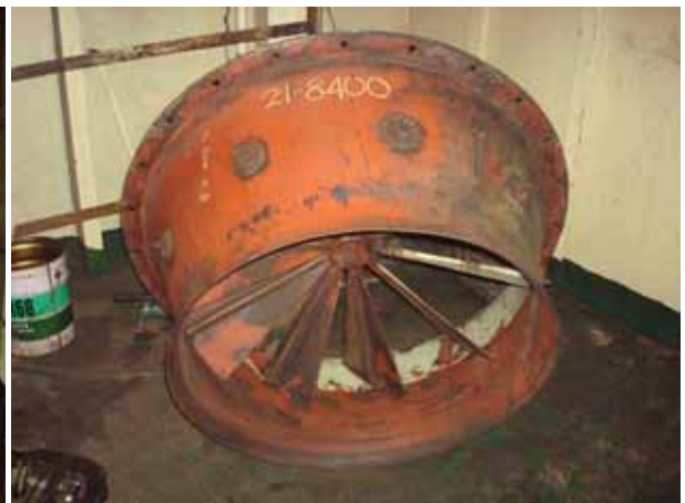
Boiler FD fan 拆檢