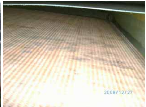
主機 AIR COOLER 氣側清潔