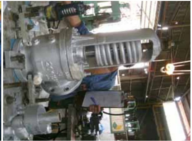
Boiler safety valve pressure test