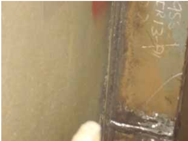
AFT STEEL WORK