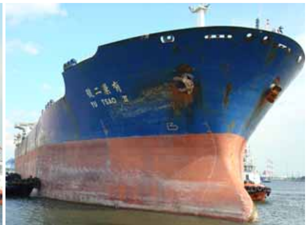
NEAR DOCKING GATE