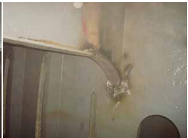
AFT STEEL WORK