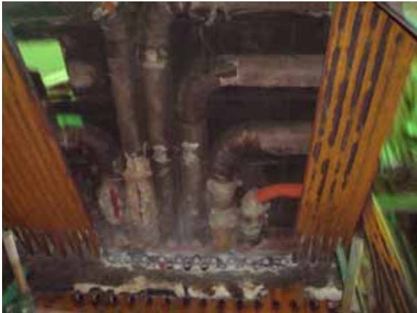
Cutting of the top side furnace wall tube