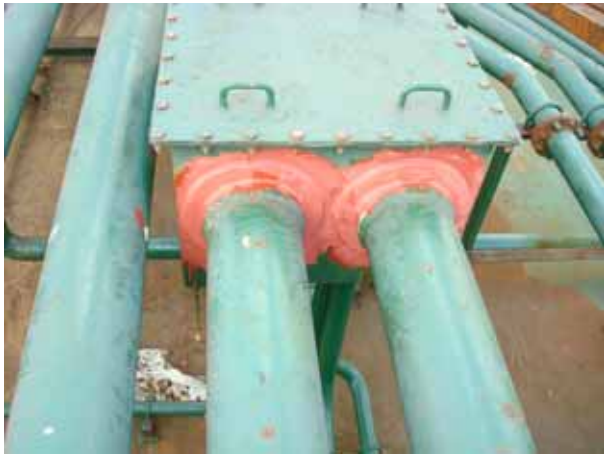
Junction box for cable line