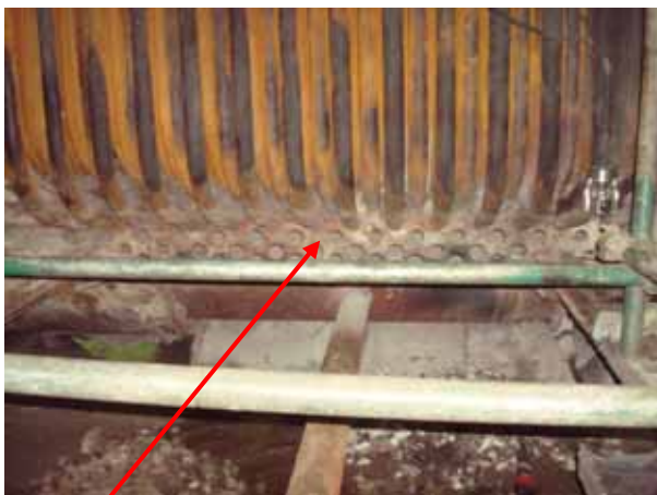
water drum for boiler furnace wall tube