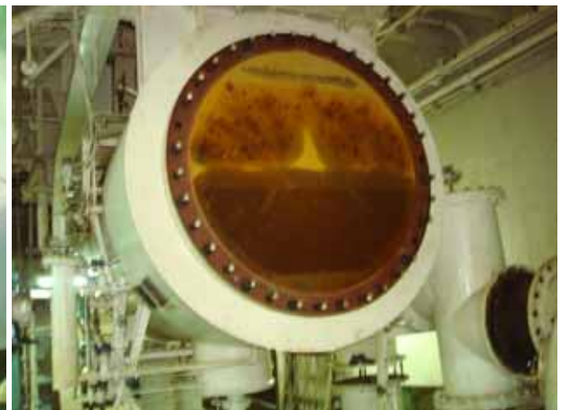
Condenser for T/G