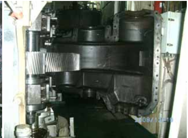
CARGO PUMP 減速齒輪