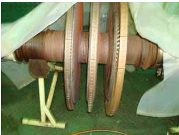
Rotor for Cargo pump