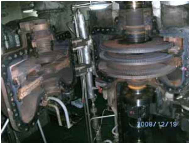
CARGO PUMP TURBINE SIDE