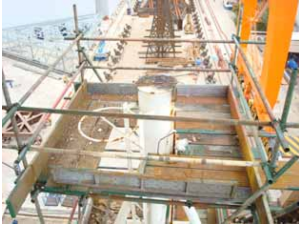
Navigation light cutting for renewal