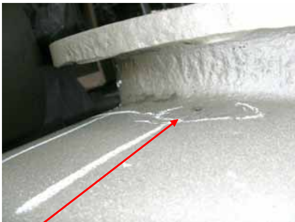
PV Breaker blasting & found hole