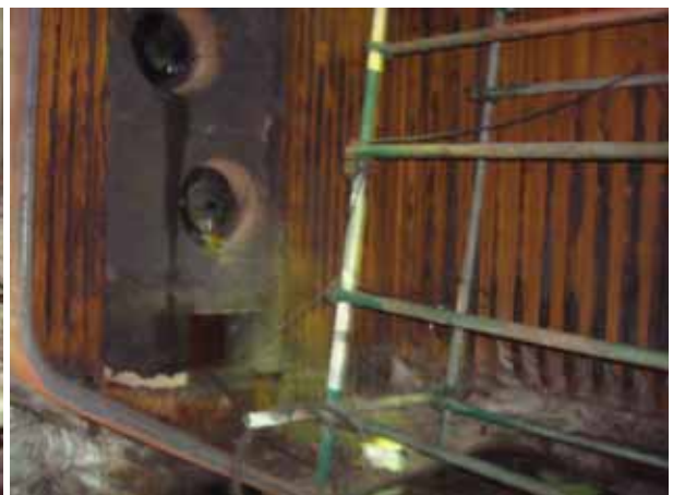
Furnace for boiler