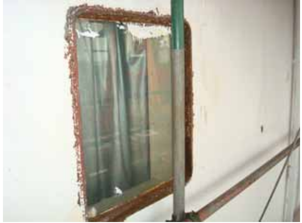
Bridge wing under side