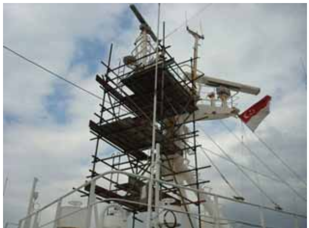
Staging for radar mast