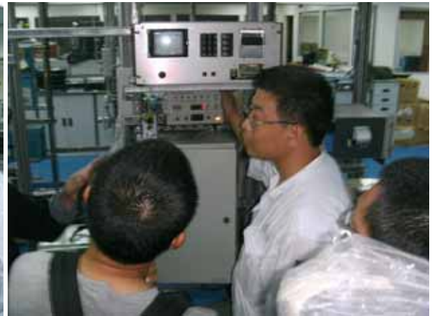
ODME training by Sinco