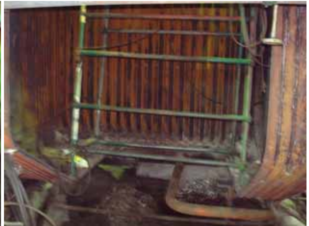
Cutting of the bottom side furnace wall tube