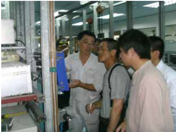
P/R gas detector training by Sinco