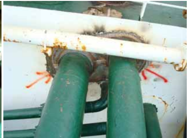
cable pipe double plate for penetrate P/R