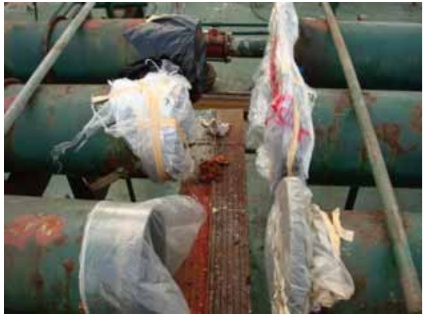
Expansion joint renewal for cargo line