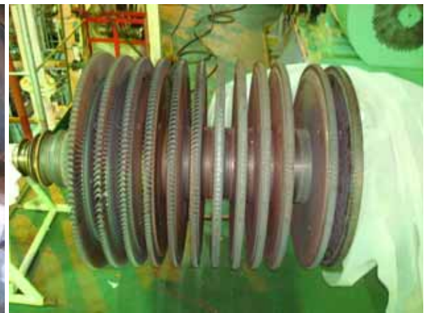
Rotor for T/G