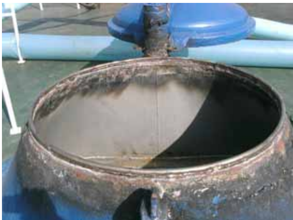
Hatch cover for ballast tank